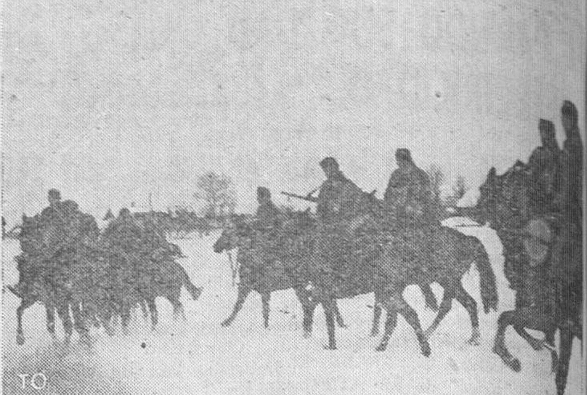
Una patrulla de husares de Honved que luchan en el sur de la zona centro, en Rusia