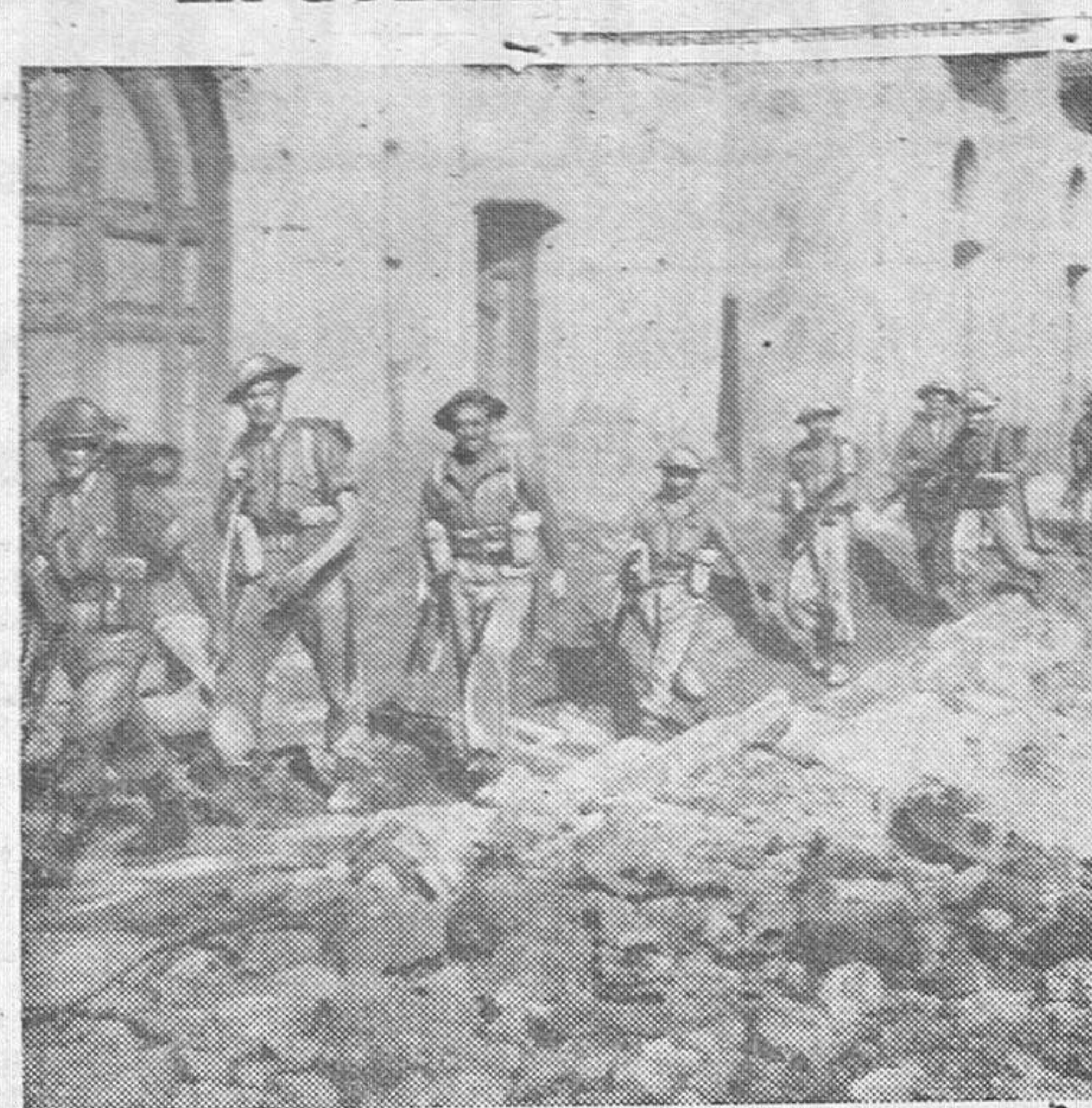
Infantería británica entra en un pueblo italiano después de duros combates por su posesión