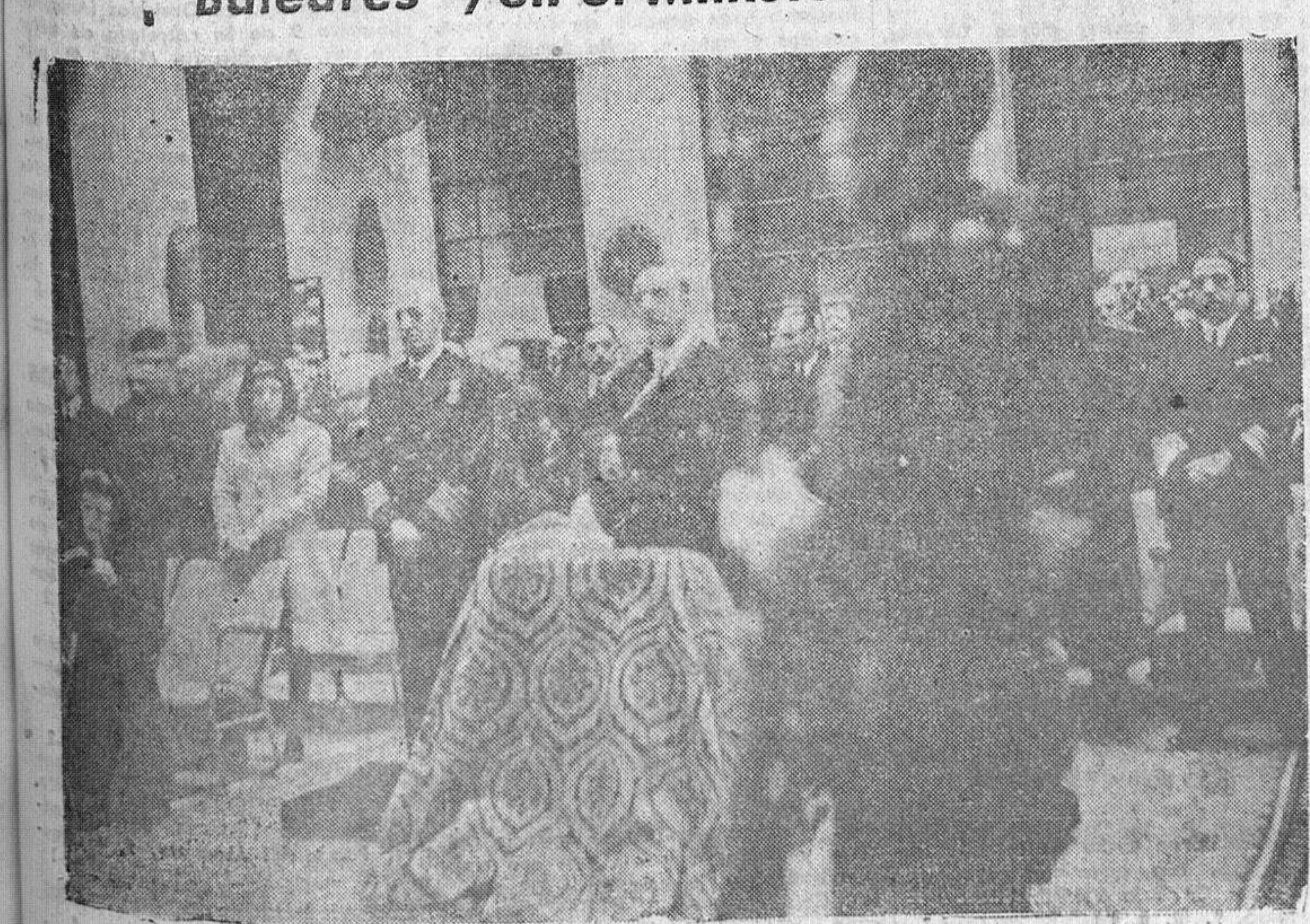
El ministro de Marina, almirante Moreno, con el jefe del Estado Mayor de Marina y el secretario, presiden la solemne misa celebrada en el patio del Ministerio de Marina por los caídos del crucero "Baleares".