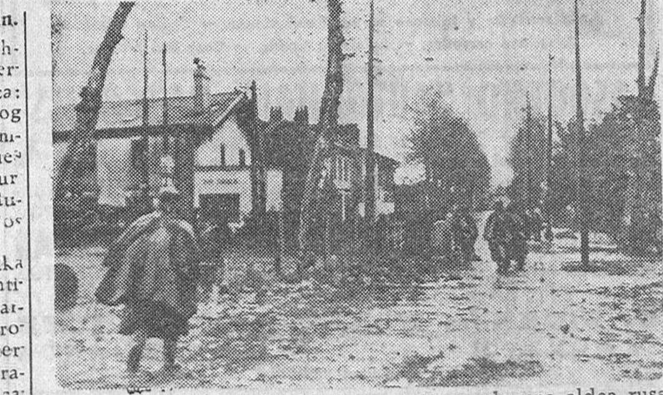
Soldados de infantería alemanes, atravesando una aldea rusa, camino de las líneas avanzadas.

En el extremo septentrional del frente los cazadores alpinos del ejército y de las S. S. armadas han rechazado varios ataques enemigos en el sector de Lubi. (Efe.)