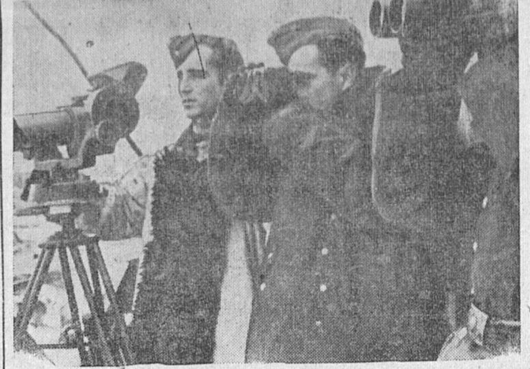
Artilleros y soldados de la defensa antiaérea alemanes, colaboran en la defensa de una ciudad.

Madrid.—El "Boletín Oficial del Estado" publica una orden del Ministerio de la Gobernación por la que se dispone la convocatoria por la Dirección General de Administración Local de Concursos para proveer en propiedad las plazas vacantes de Secretarios de Administración Local de tercera categoría.