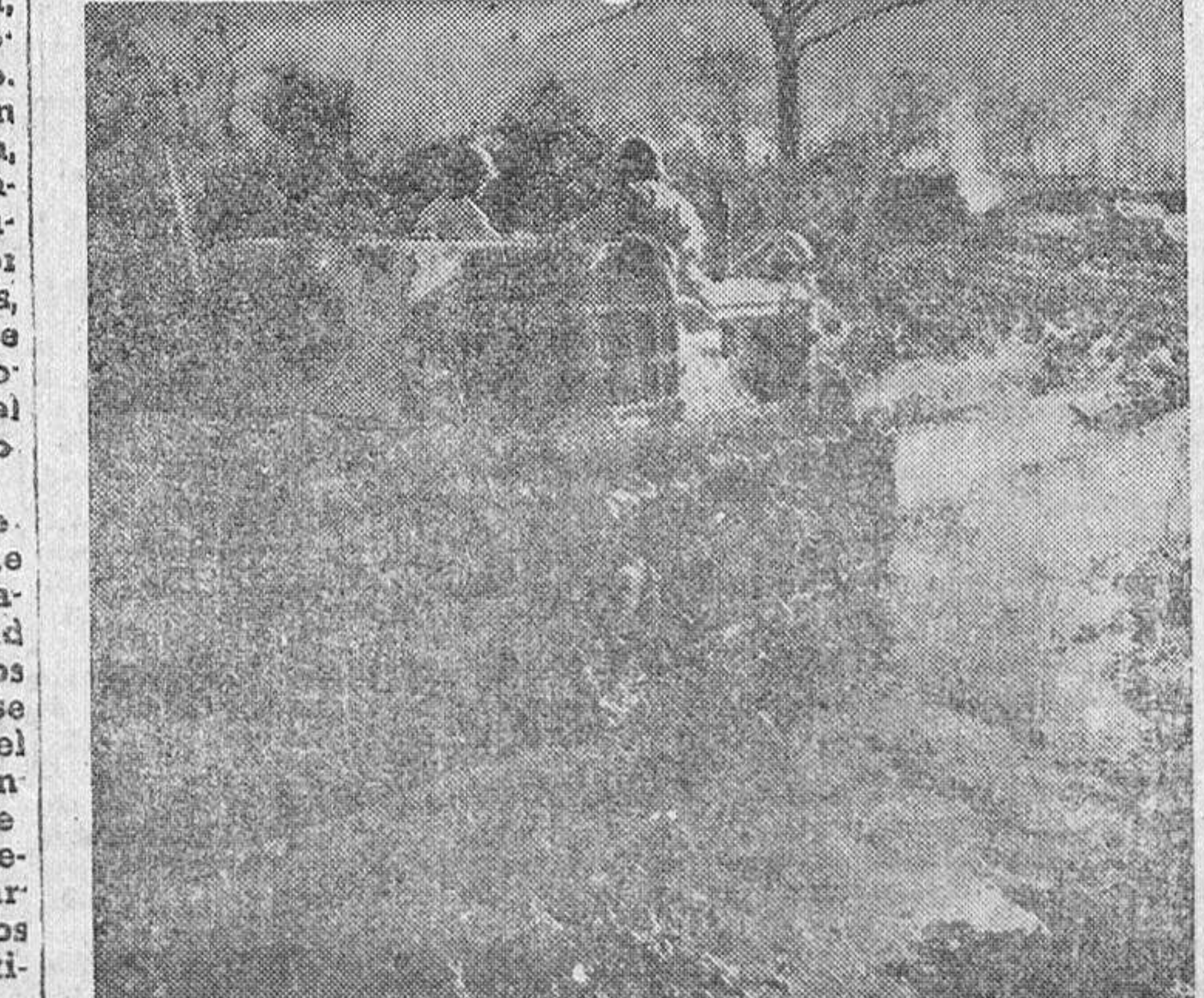
En un sector del frente italiano, autocamiones, como el que recoge la fotografía, se dedican a abrir rutas por las carreteras enlodadas, con motivo de los últimos temporales, a fin de que puedan seguir su marcha las tropas del quinto Ejército