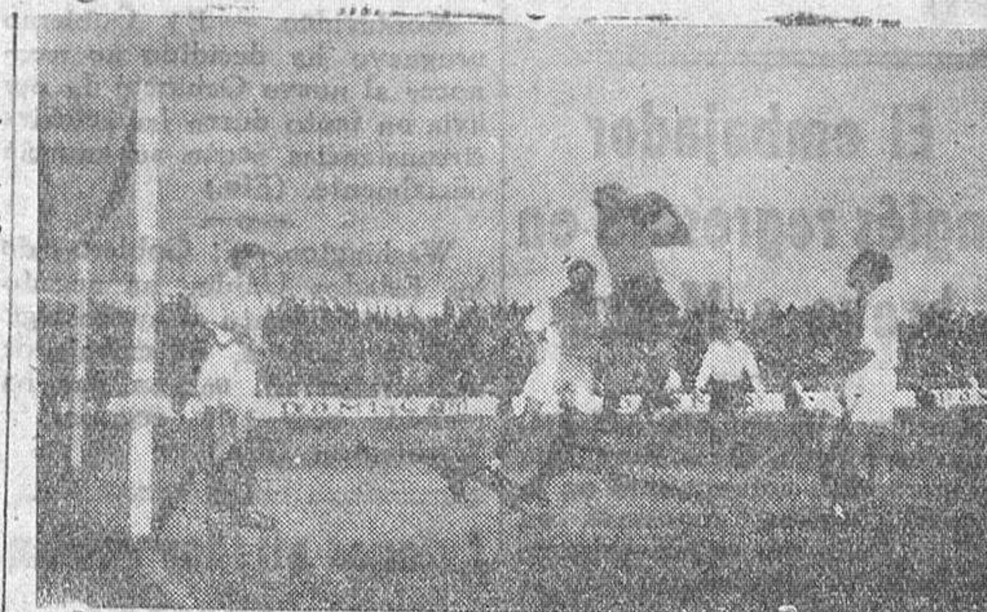
Bien respaldado por Sanz y Alonso, Rico bloca un balón alto, con excelente estilo

todo ginaba, Perete, y una de- lantera acopiada y eficaz. Pero Perete no había encontrado to- davía a Oruña, que no sólo le marcó y destrozó los mejores intentos de creación de juego, sino que llegó a alterar sus ner- vios, en aquellos momentos en que el partido degeneraba en re- fregia, al marcharse su dirección de lunas manos poco firmes.