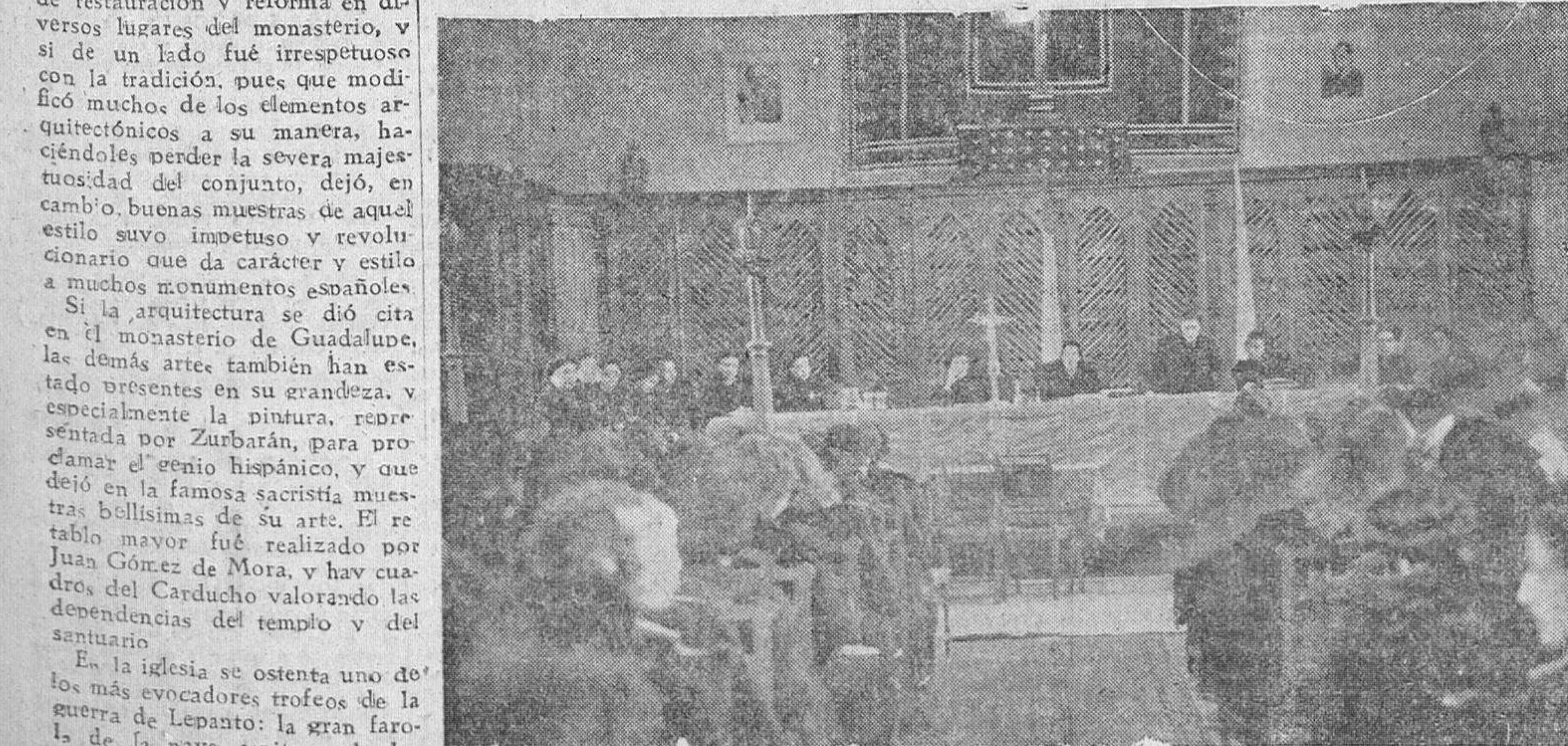
Una de las sesiones del Consejo que viene celebrándose en el Monasterio de Guadalupe, bajo la presidencia de la delegada nacional, Pilar Primo de Rivera