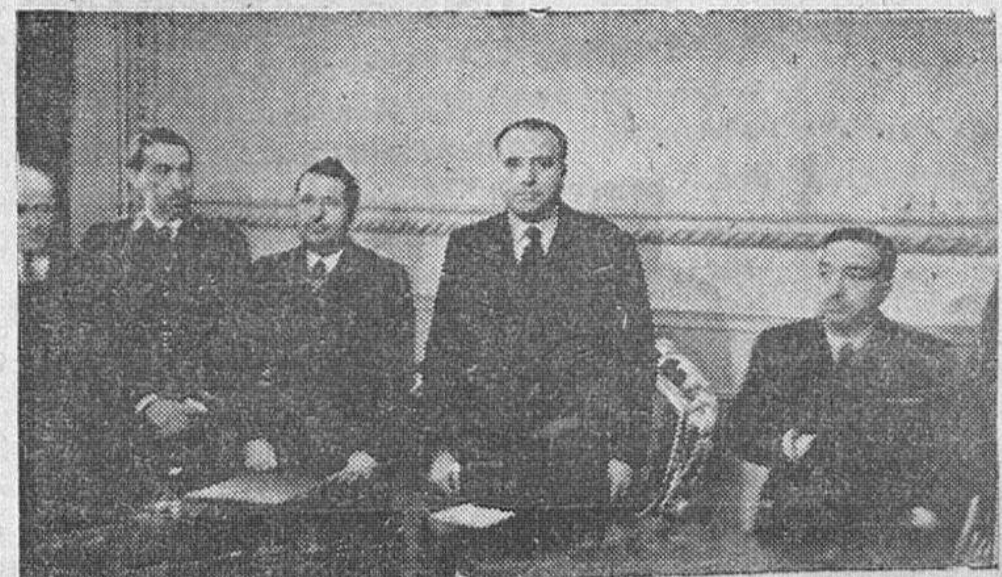
El ministro de Justicia en el momento de hacerse cargo de la presidencia del Patronato para la Redención de Penas por el Trabajo