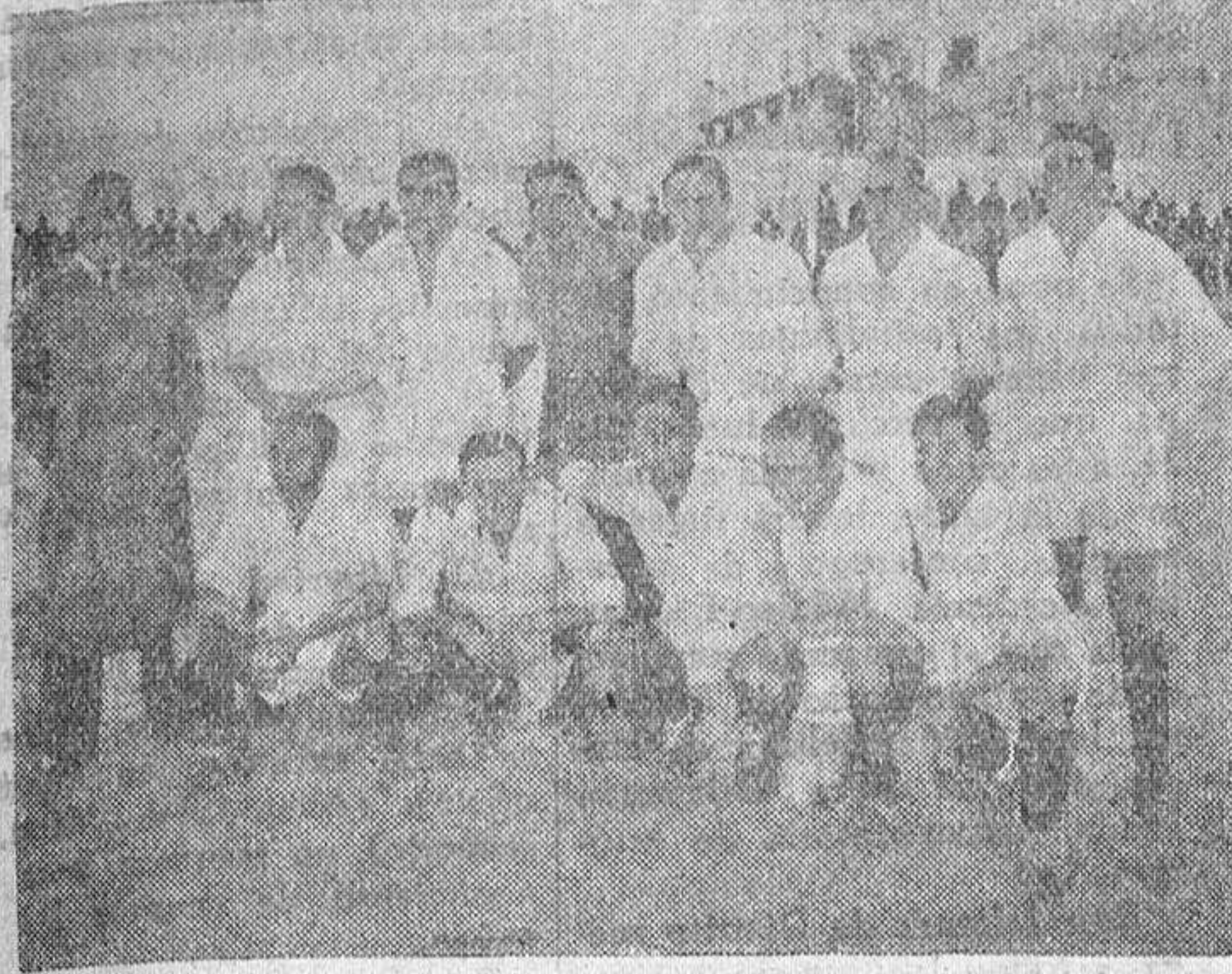
El C. D. Cacereño, que esta tarde se presenta en el campo del Calvario