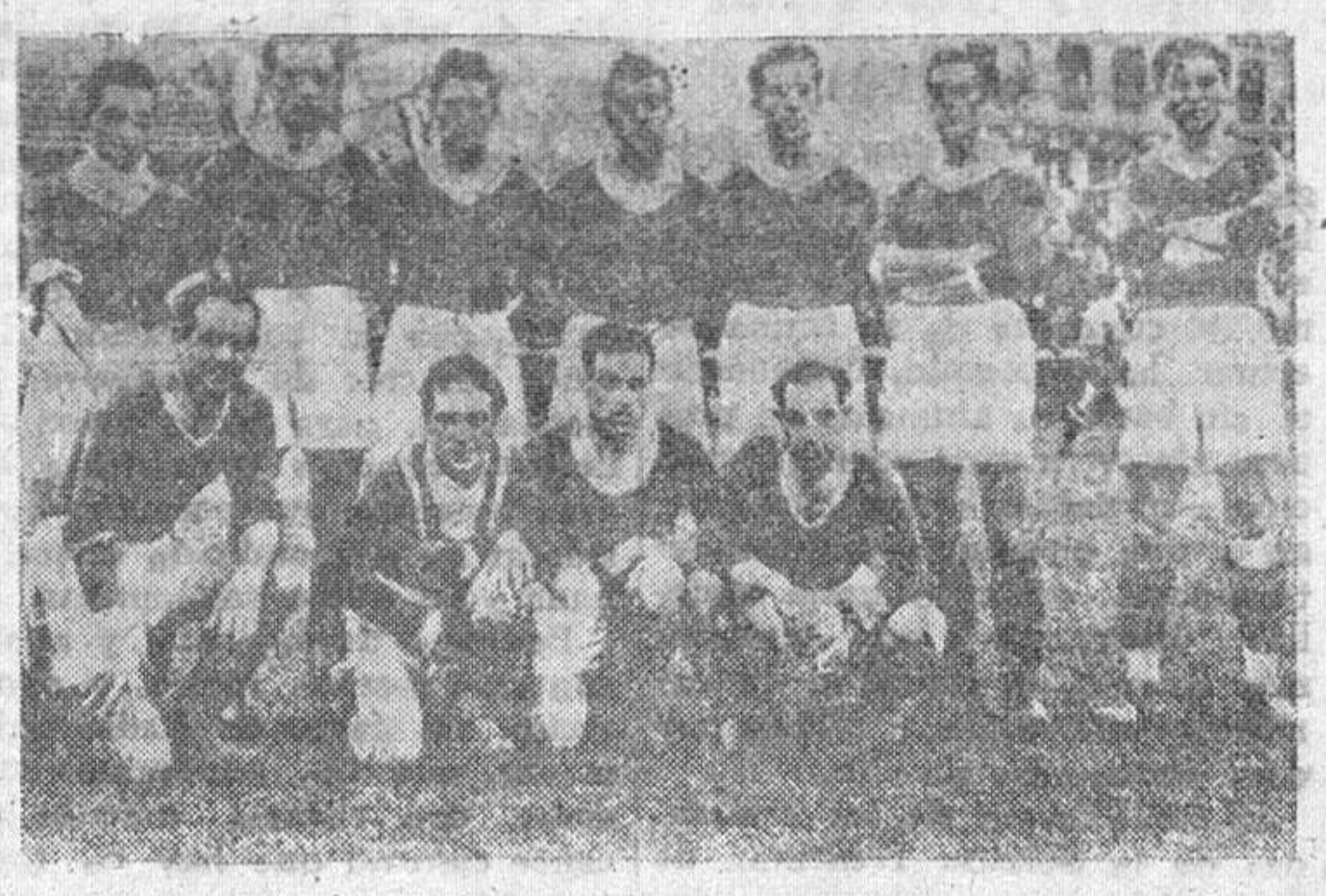
El conjunto de la Imperial Ciudad, que sucumbió por dos tantos a uno con el Imperio, de Madrid, en el encuentro disputado en la Ferroviaria

CLUB DEPORTIVO CLOSVIN.—Todos los jugadores fichados por este Club, deberán presentarse, mañana, domingo, a las nueve y cuarto de la mañana, en el campo del Arrabal, para jugar el partido correspondiente al Campeonato Comarcal, contra el Iberico. C. D. IBERICO.—Todos los jugadores fichados por este club, se presentarán, el próximo domingo, día 16, a las nueve en punto de la mañana, en el campo del Arrabal, para jugar el partido de campeonato contra el C. D. Ciosvin. La lista será sancionada.—La Directiva.