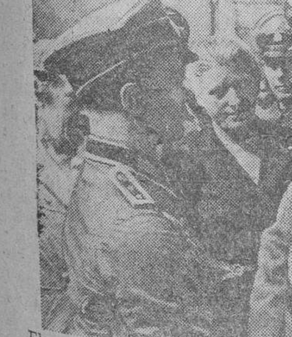
El mariscal Goering recibe a una comisión de oficiales alemanes que se encuentran en Berlín en disfrute de permiso.