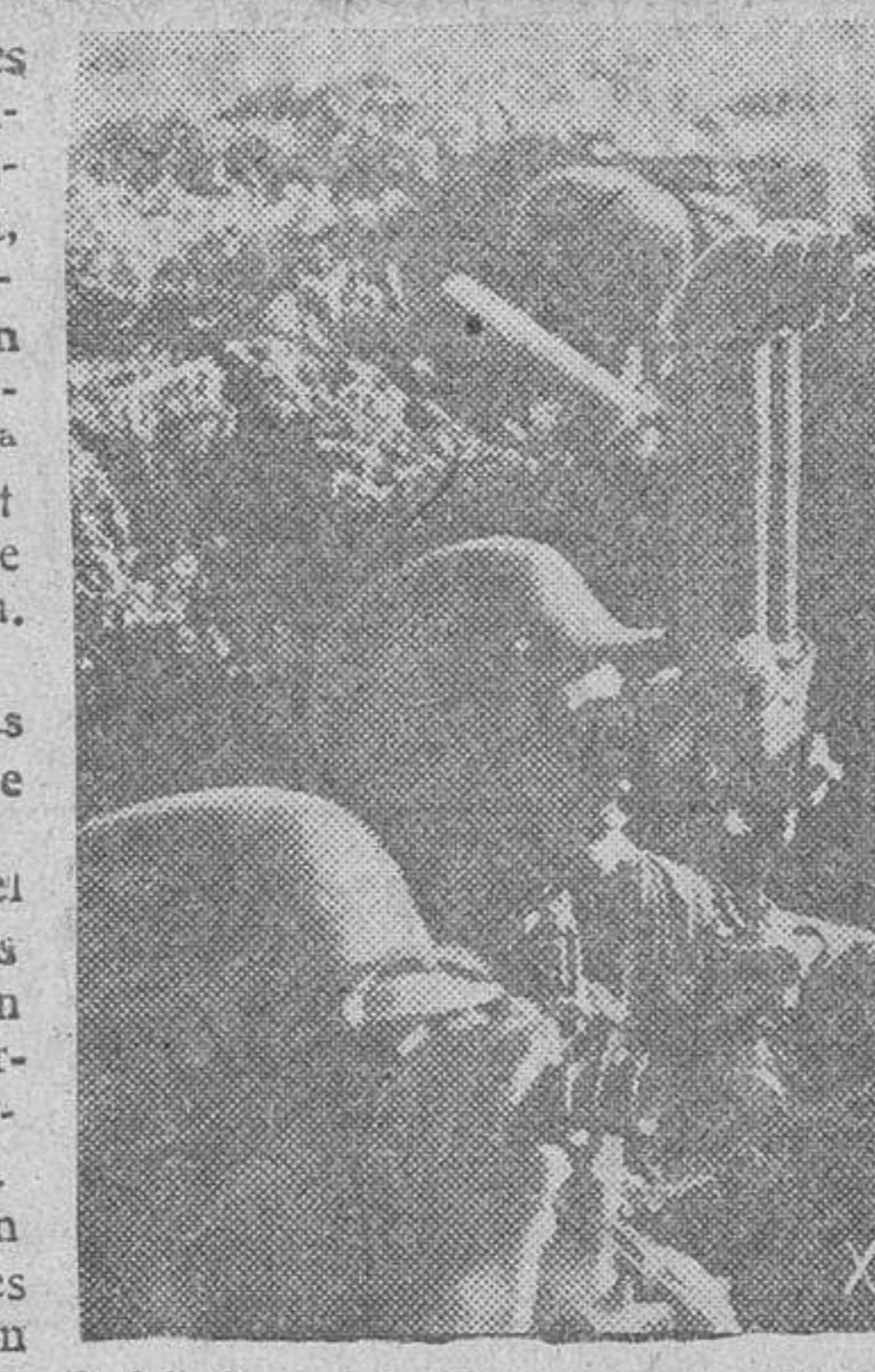
Soldados del Ejército del Reich observando por el telémetro los efectos de la artillería.