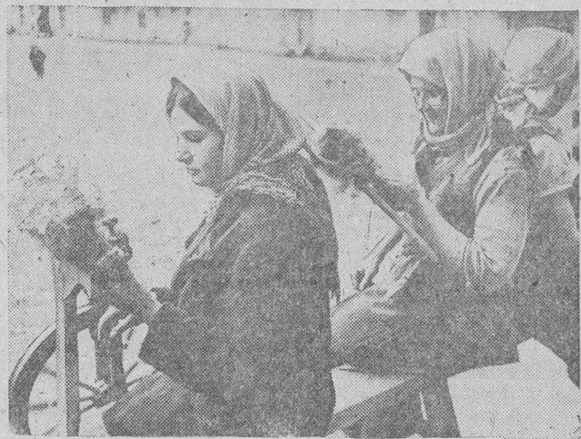
En los pueblos ucranianos se conserva la costumbre de la rueca

Los hombres entre dieciséis y sesenta años, están todos bajo las armas, si la organización del partido comunista no les declara insustituibles. Los soldados no reciben más que un período de instrucción que oscila entre cuatro