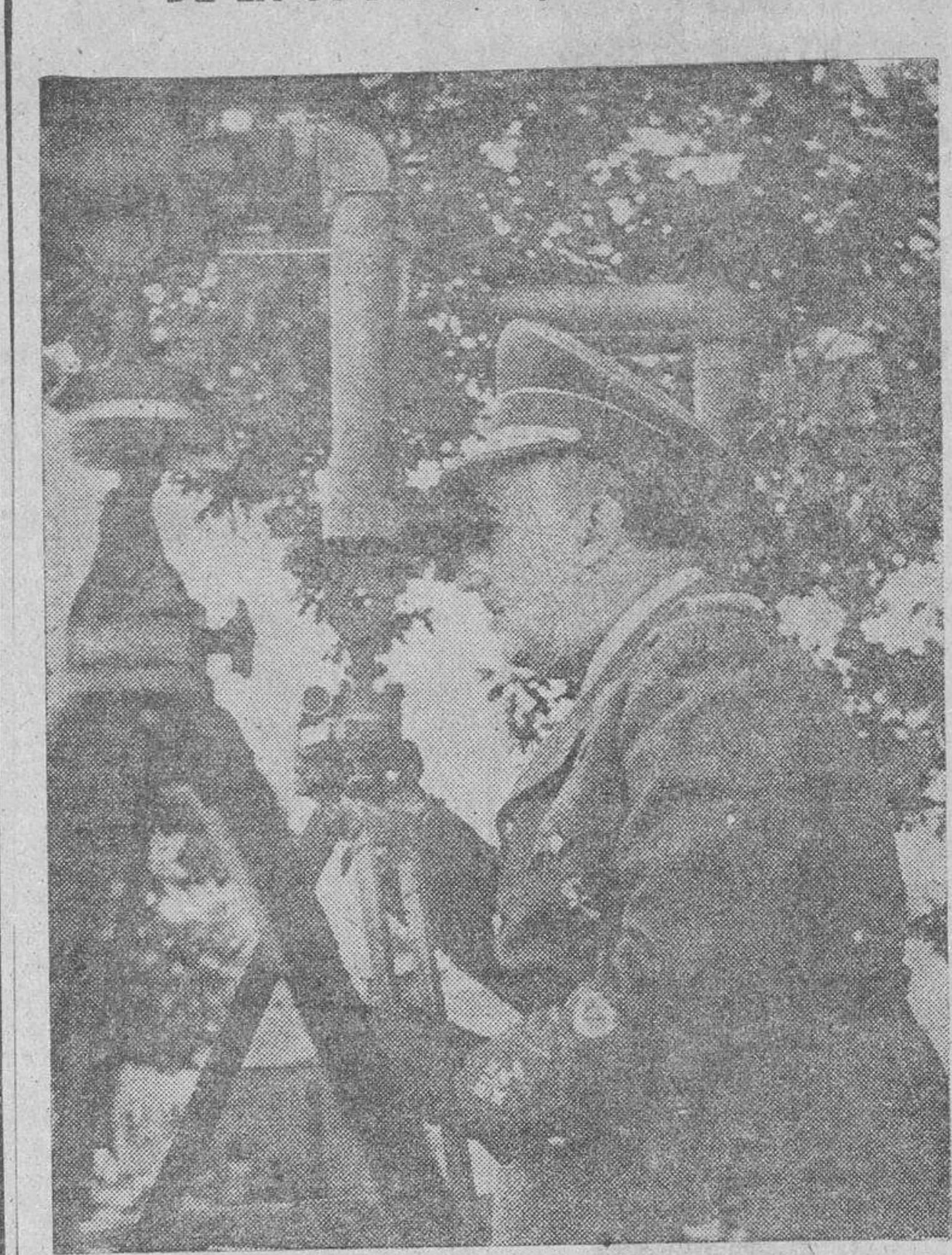
El Caudillo Franco sigue con todo interés, a través del telescopio, el desarrollo de las maniobras militares verificadas últimamente en Guitiriz