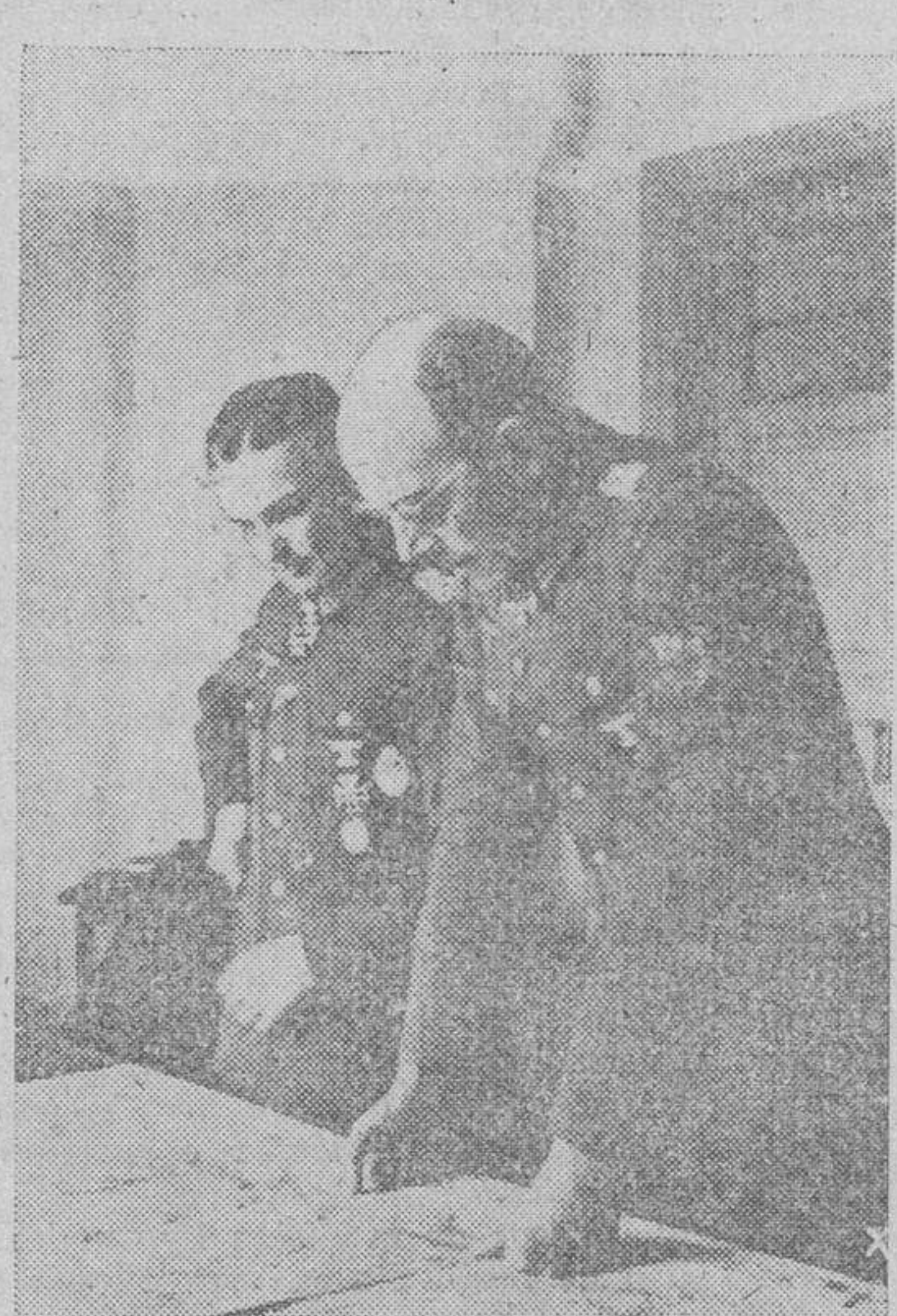
El general Karl Hollidt, poseedor de las Hojas de Roble de la Cruz de Caballero de la Cruz de Hierro, delibera sobre la situación de sus tropas con otro general alemán.