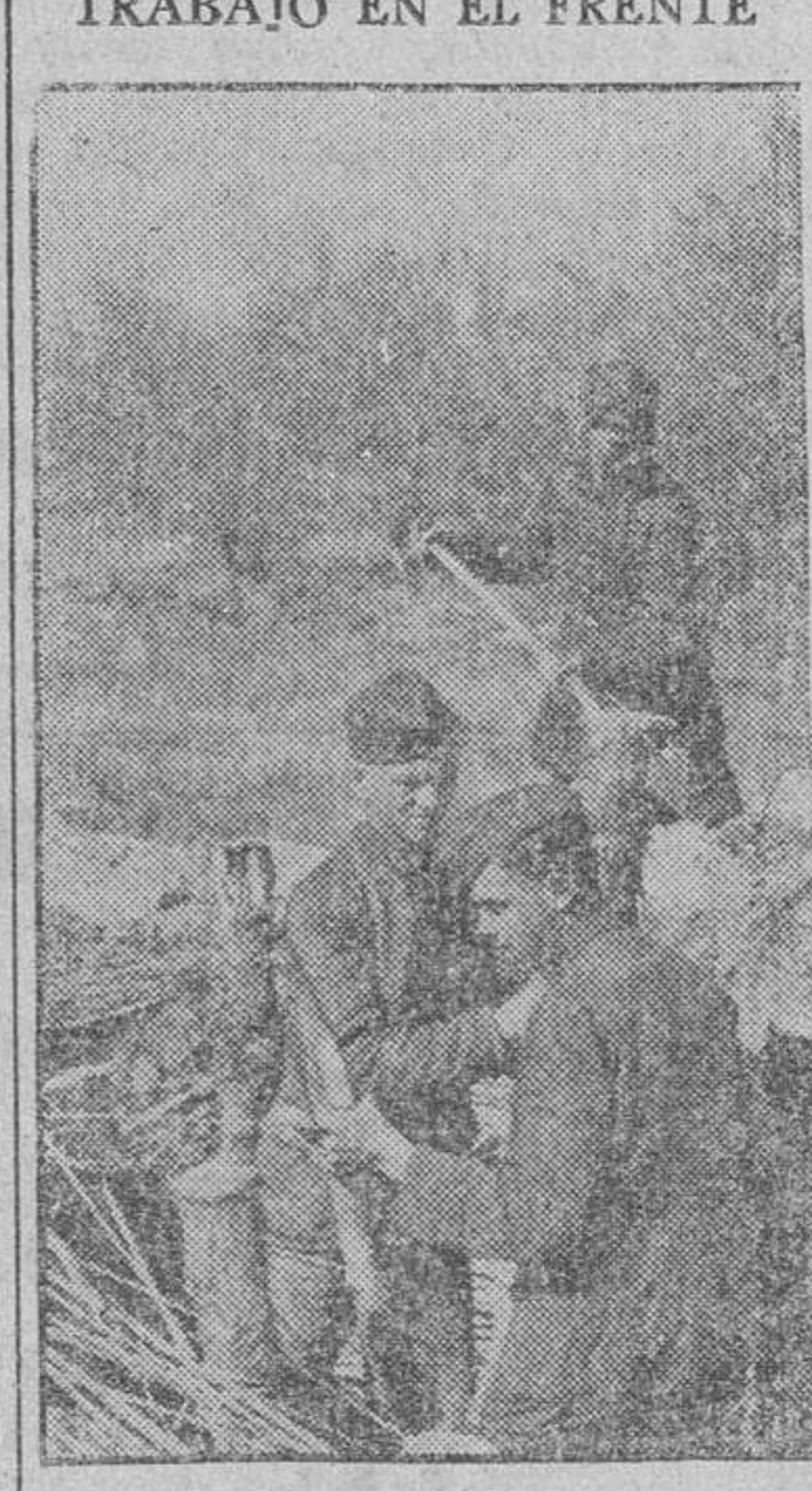
Grupo de soldados y obreros de la organización Todt haciendo trabajo para mejorar las trincheras.