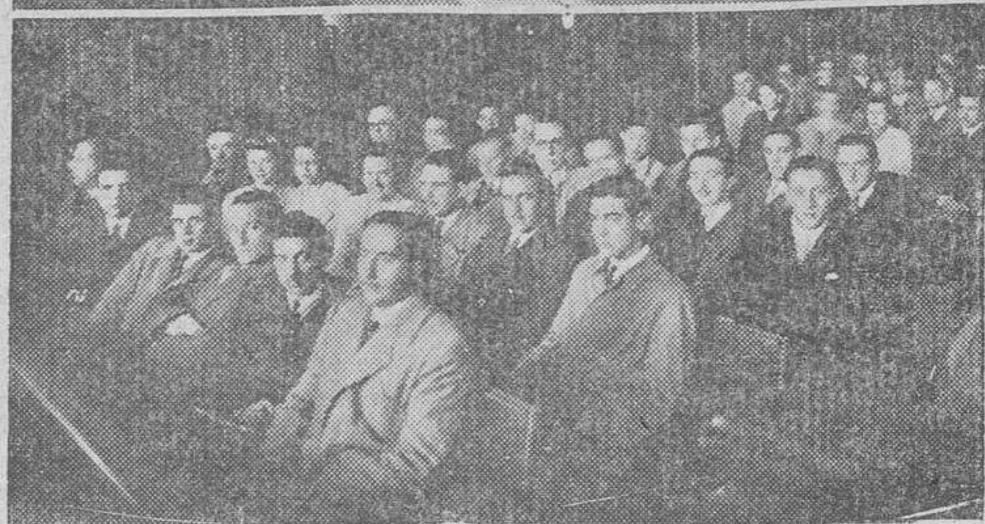
La presidencia del acto celebrado el domingo en el Paraninfo de la Universidad, con motivo de la despedida de los alumnos del último curso de la Facultad de Derecho, y un aspecto del salón.