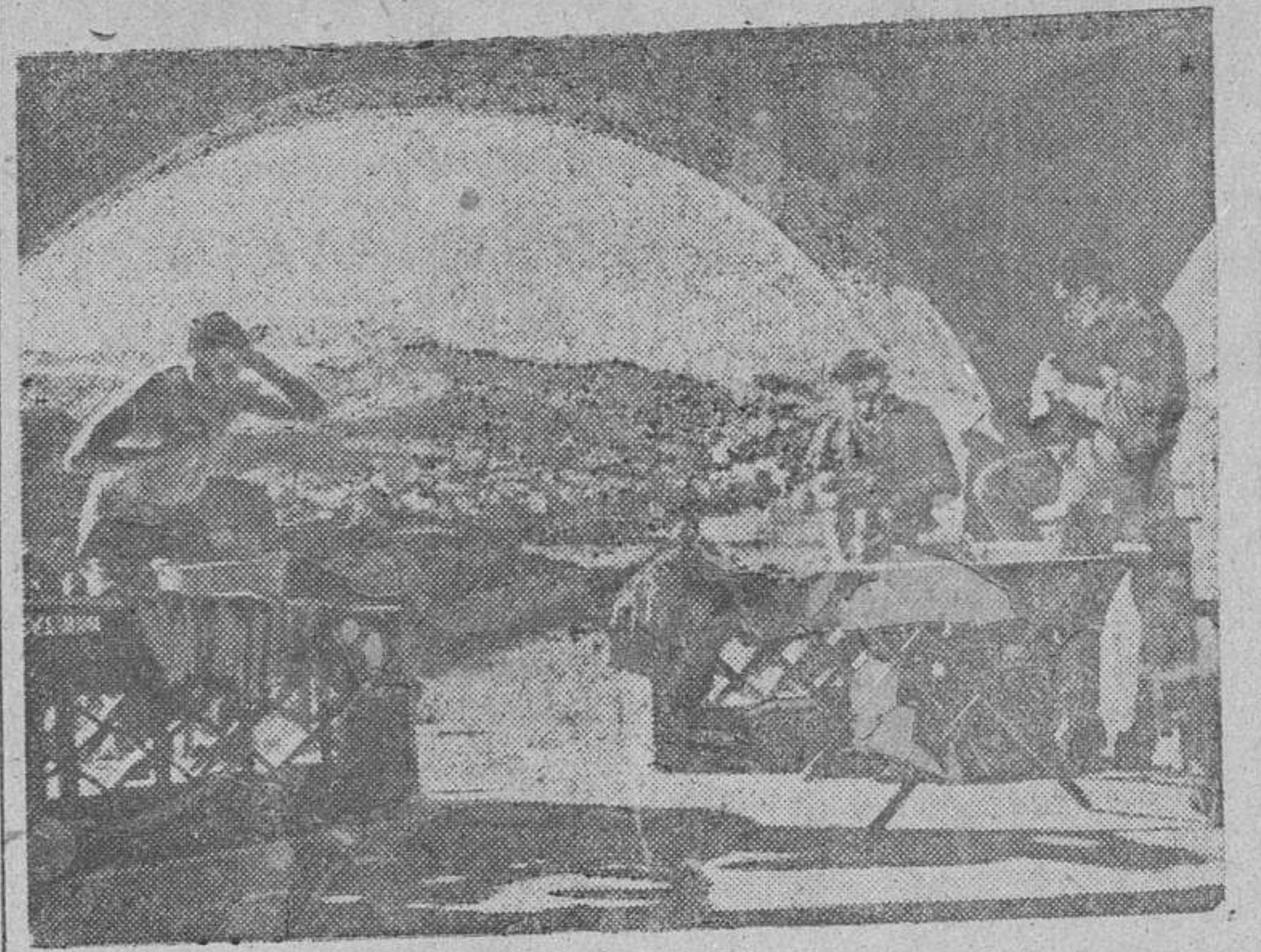
Rápidamente el Ejército alemán ha instalado sus nuevos alojamientos en la costa mediterránea, desde uno de los cuales se contempla el magnífico paisaje de los Pirineos