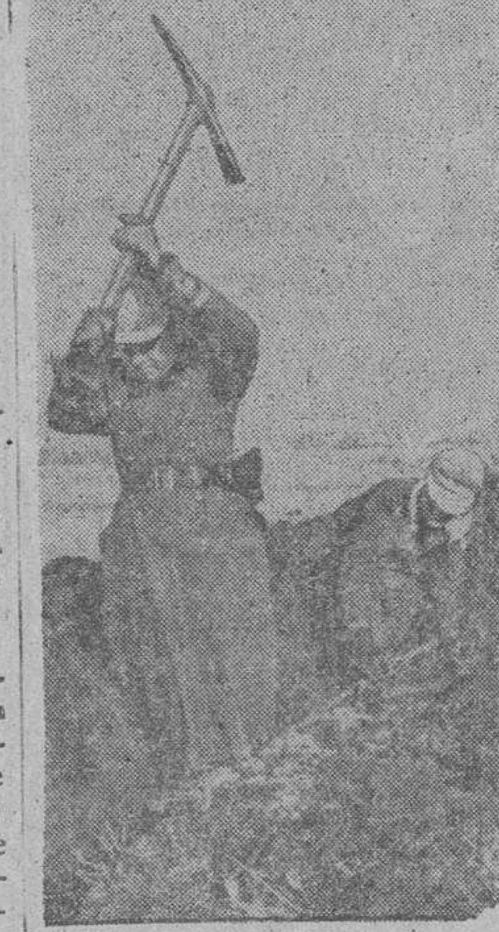
Detrás de la primera línea de combate, estos soldados alemanes construyen sus posiciones heladas