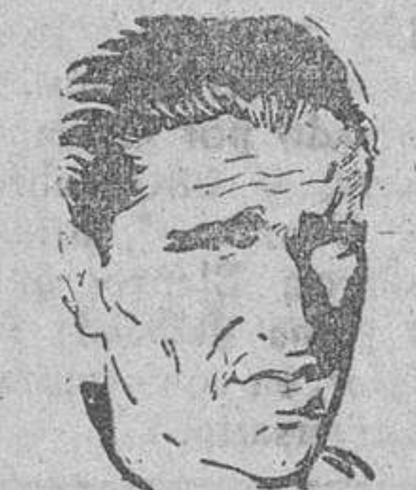
GARATE que obtuvo la victoria para los bilbaínos en Torrero