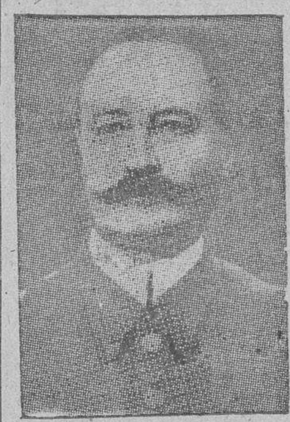
Argel.—Cuartel general aliado del norte de Africa: "El Consejo imperial francés ha designado, por unanimidad, al general Giraud para ejercer las funciones de alto comisario del norte de Africa francesa y de comandante

Asumirá también las funciones de Comandante en jefe de los ejércitos de tierra, mar y aire De Gaulle, en un discurso radiado, califica a Giraud de prestigioso militar