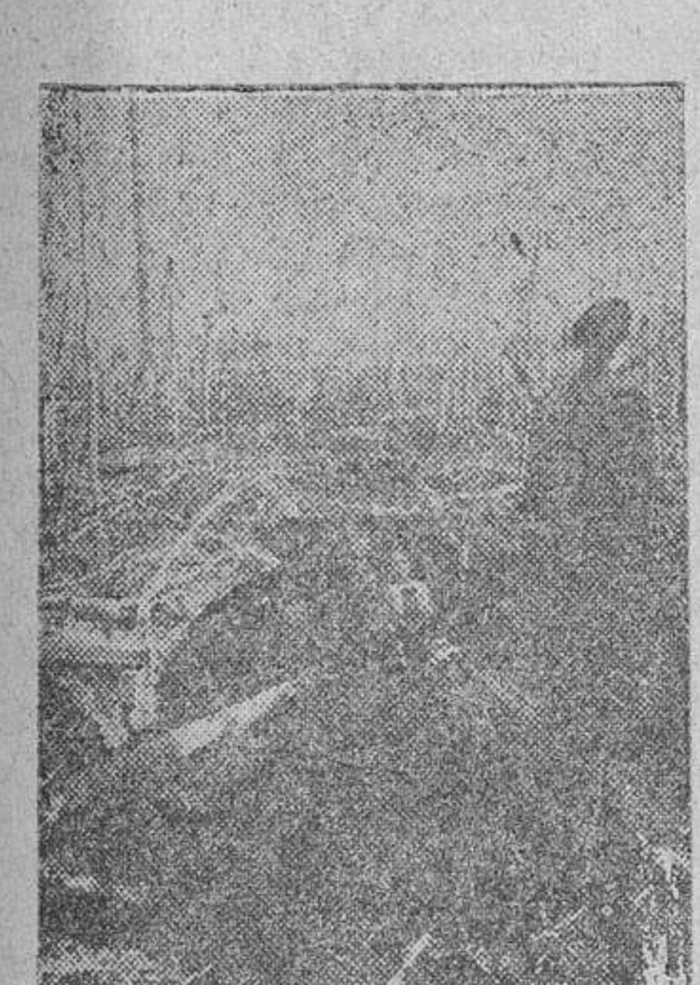
El primer servicio en este nido antitanque soviético, recientemente conquistado por los infantes del Reich

Veintidós de los veinticuatro barrios de Stalingrado están en poder de los alemanes