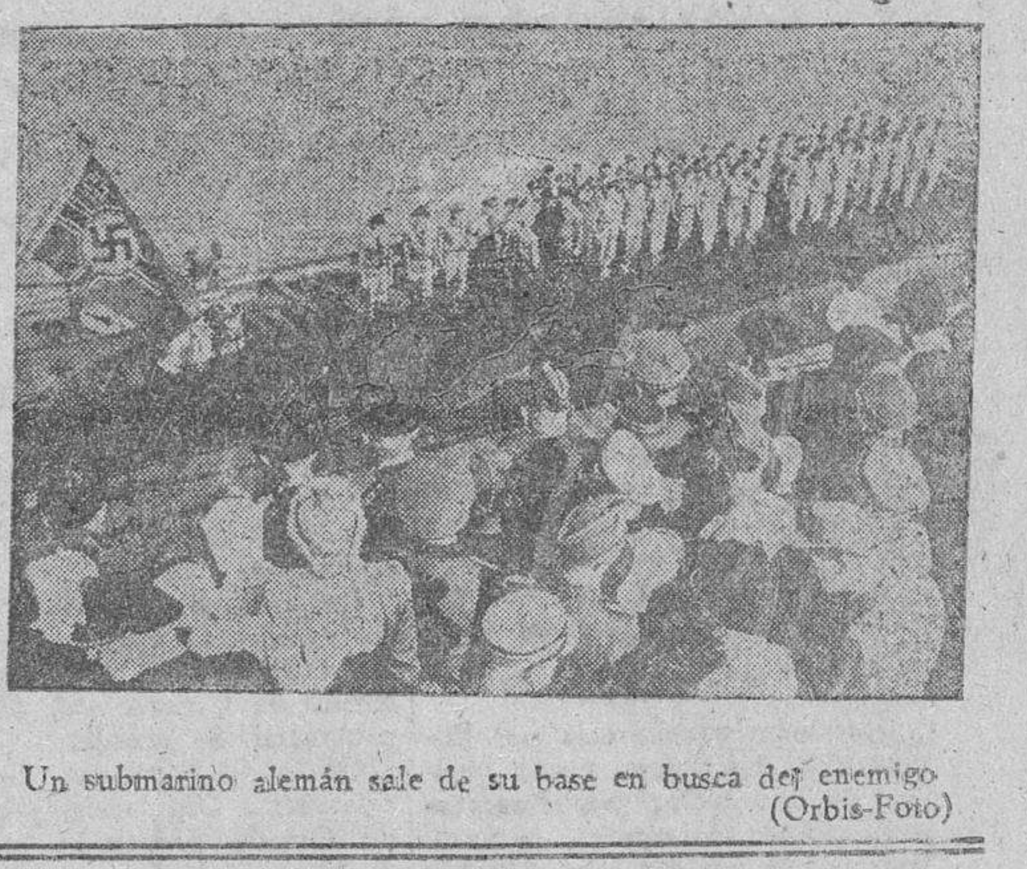
Un submarino alemán sale de su base en busca del enemigo