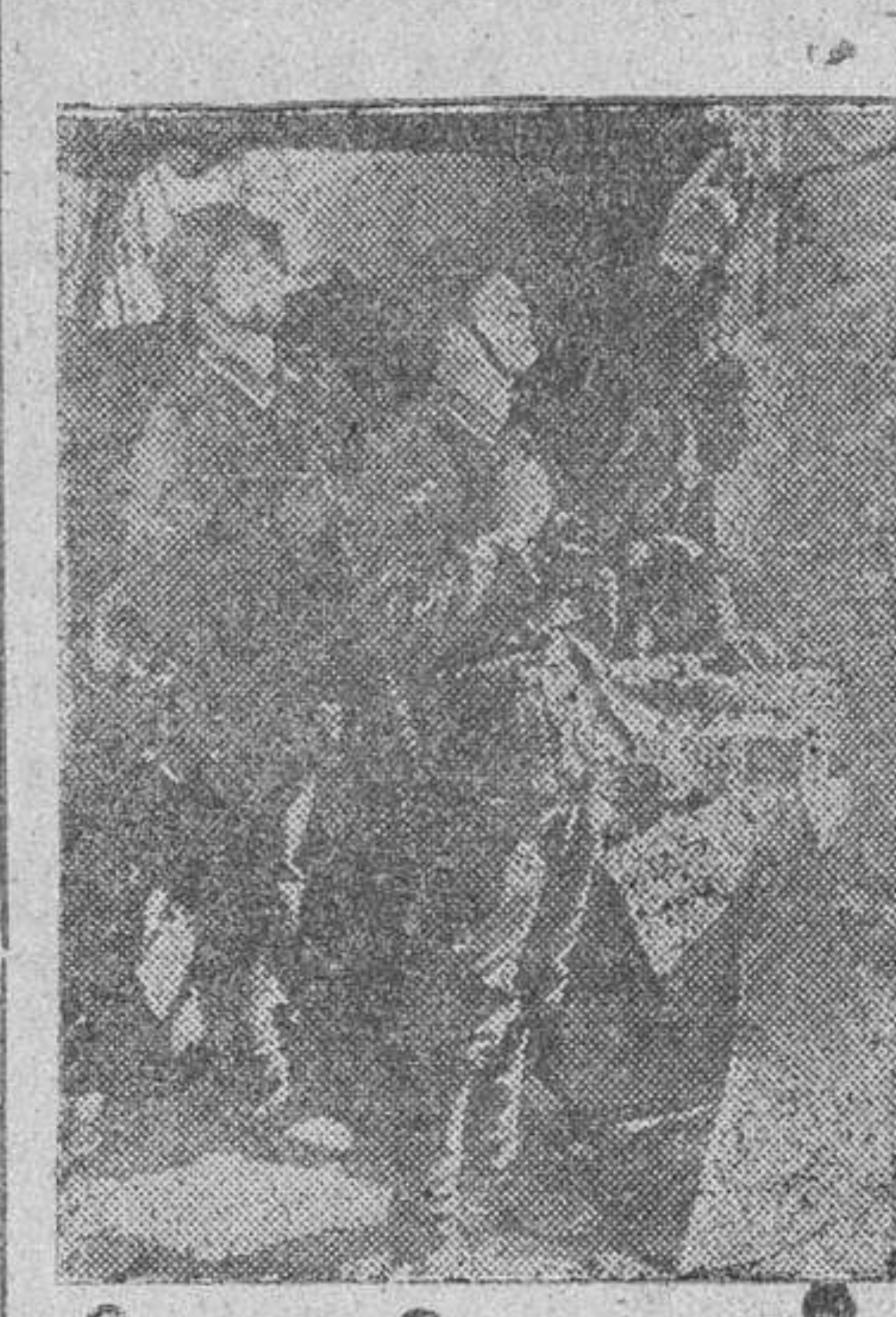
El ruido de los motores es reconocido por los soldados alemanes que observan desde sus trincheras el regreso de los camaradas del aire...