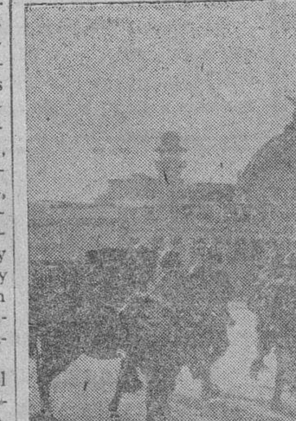
Al mismo tiempo que el Ejército del Reich ocupa la zona libre francesa, fuerzas italianas llegaban a Niza