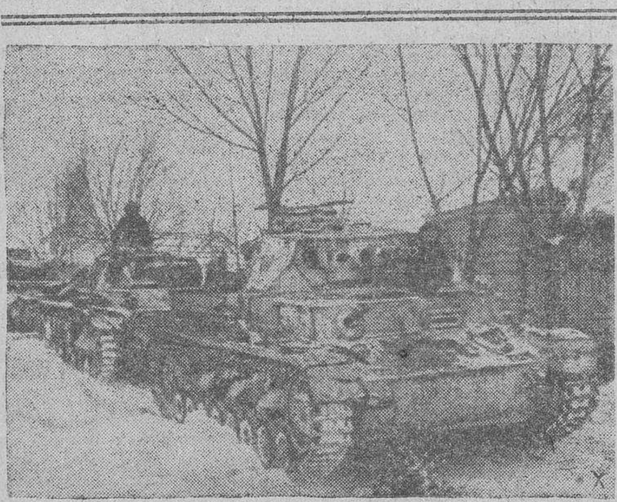
Una columna de tanques alemanes dirigiéndose a las primeras líneas del frente ruso

No te dejes dominar por la ambición de engrandecimiento y por el triste vicio del egoísmo. Redobla la caridad para con tus hermanos los pobres, ahora que se acercan las fiestas navideñas. La Congregación de Luises, que en sus diversos centros obreros da instrucción catequística a más de un millar de niños pobres, pide tu ayuda para llevarlos un día de alegría en su penosa vida de miseria.