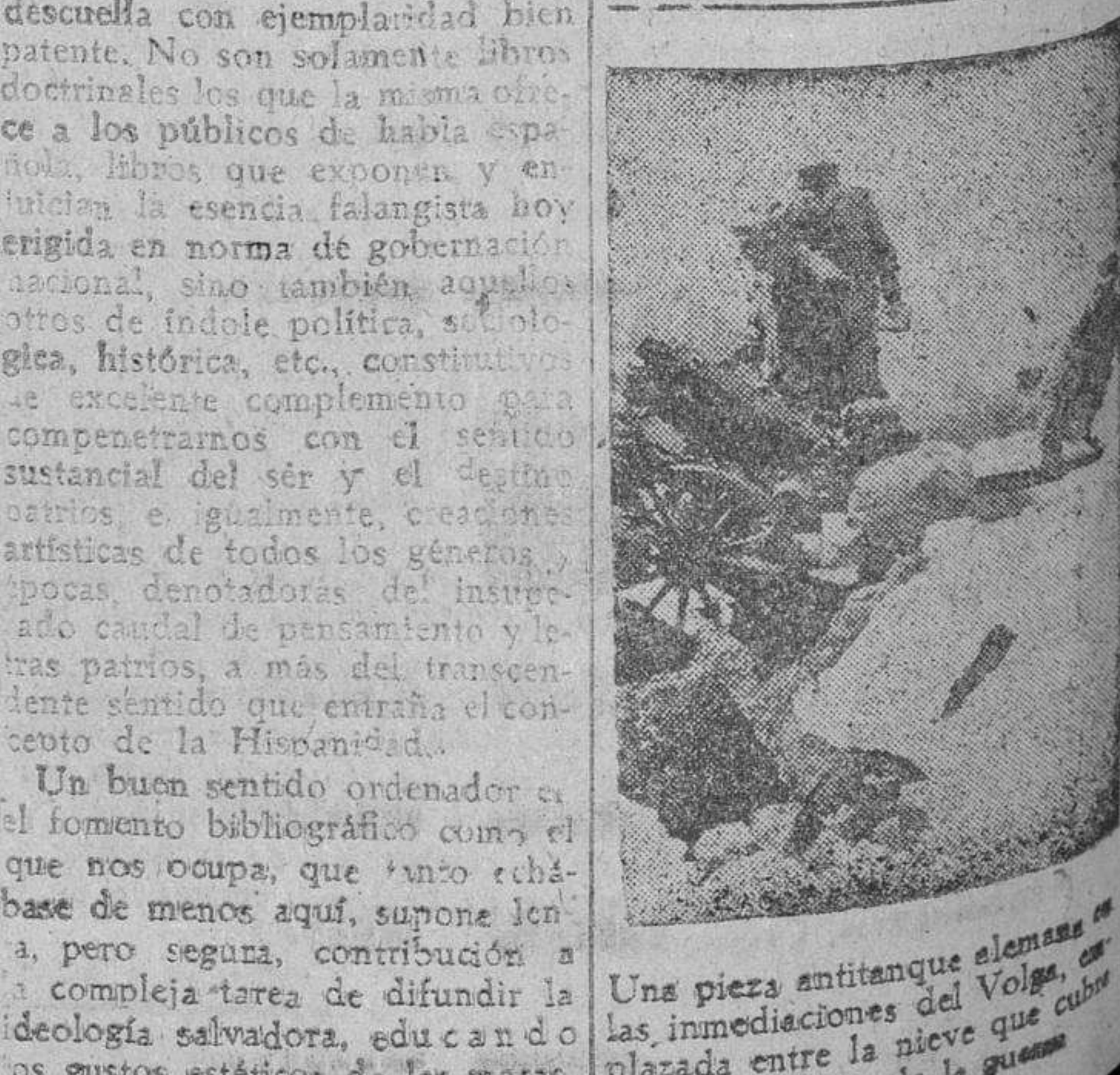
Una pieza antitanque alemana en las inmediaciones del Volga, en la plaza ante la nieve que cubre el escenario de la guerra

Regalos para bodas PAULINO Plaza Mayor, 19 Salamanca