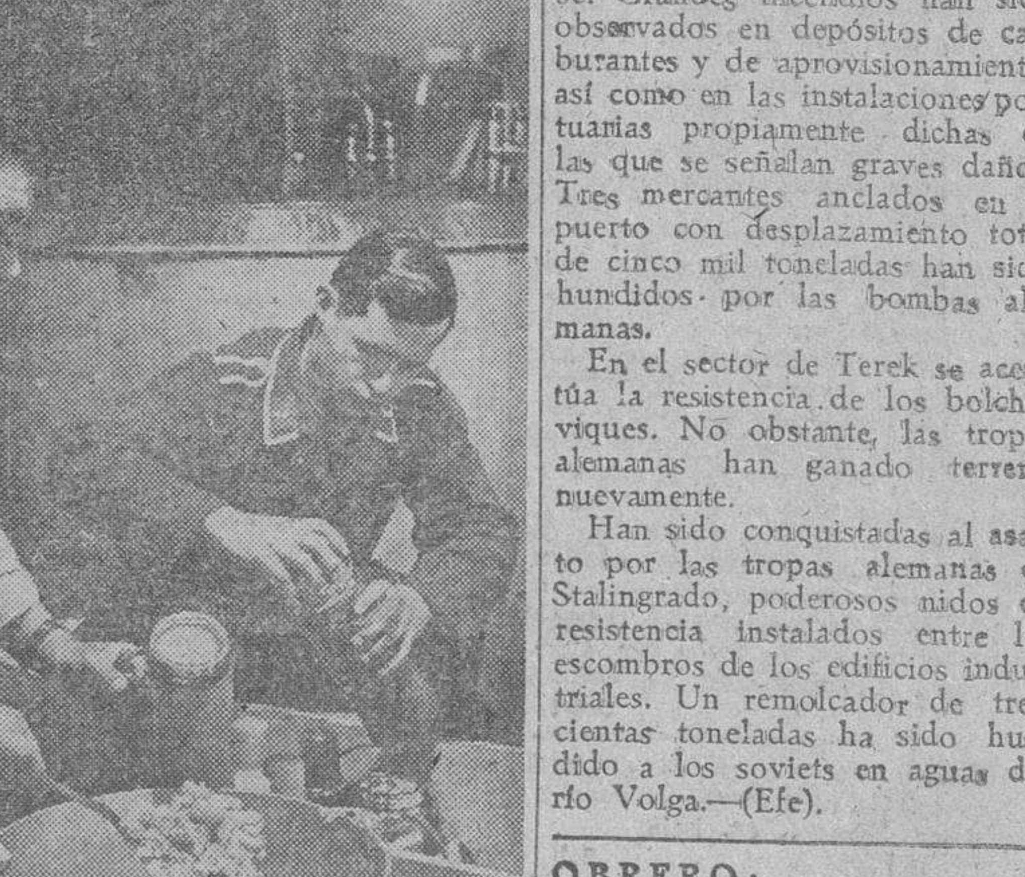
Los aviones alemanes "Condor", bombarderos a larga distancia, van perfectamente equipados para sus prolongadas misiones. La comida, muy concentrada y de gran poder nutritivo, es llevada en termos especiales, donde se conserva sin ninguna alteración