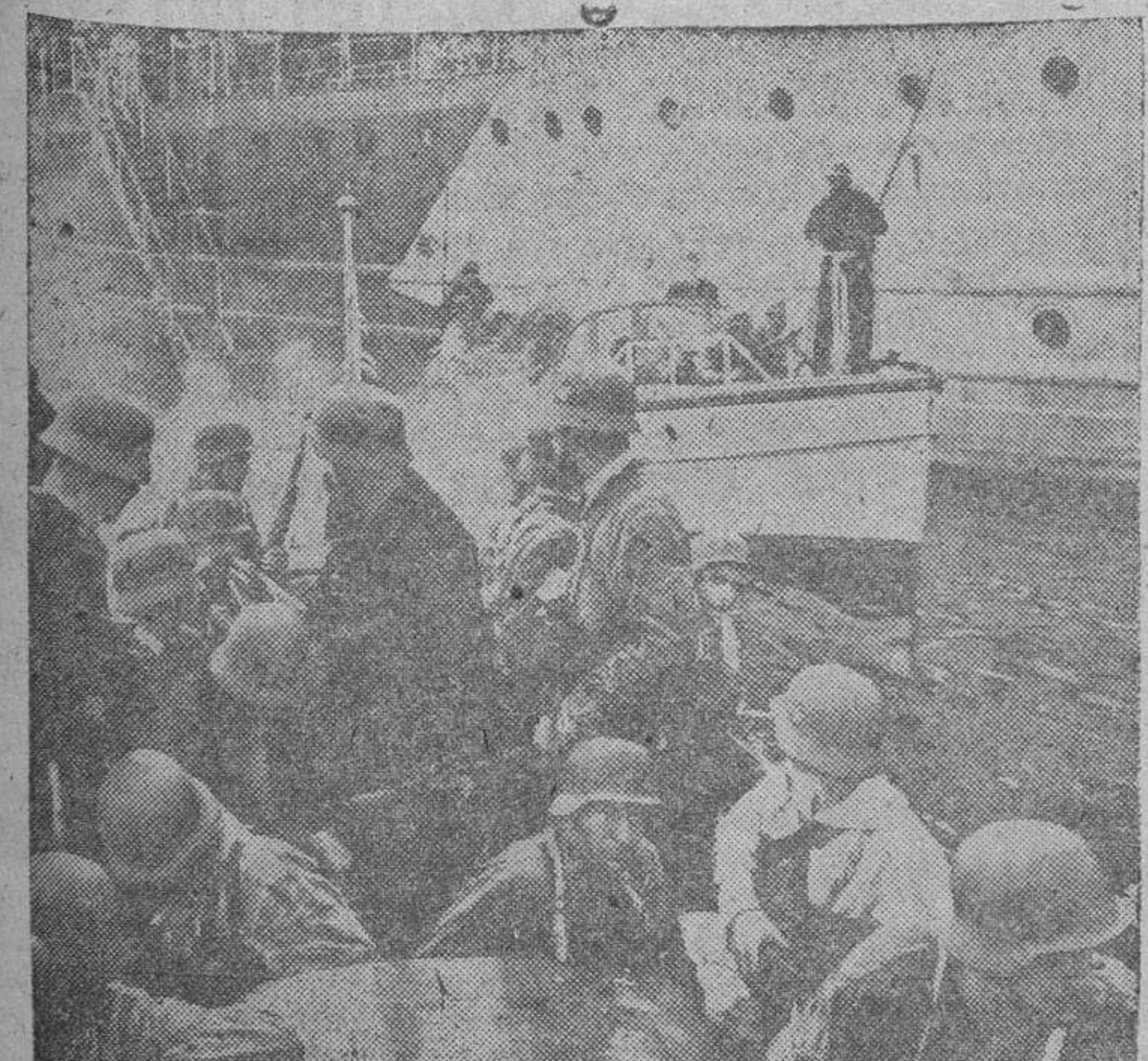
Desde una gran unidad de la marina alemana, los soldados embarcan en lanchas rápidas torpederas, para cumplir los objetivos asignados