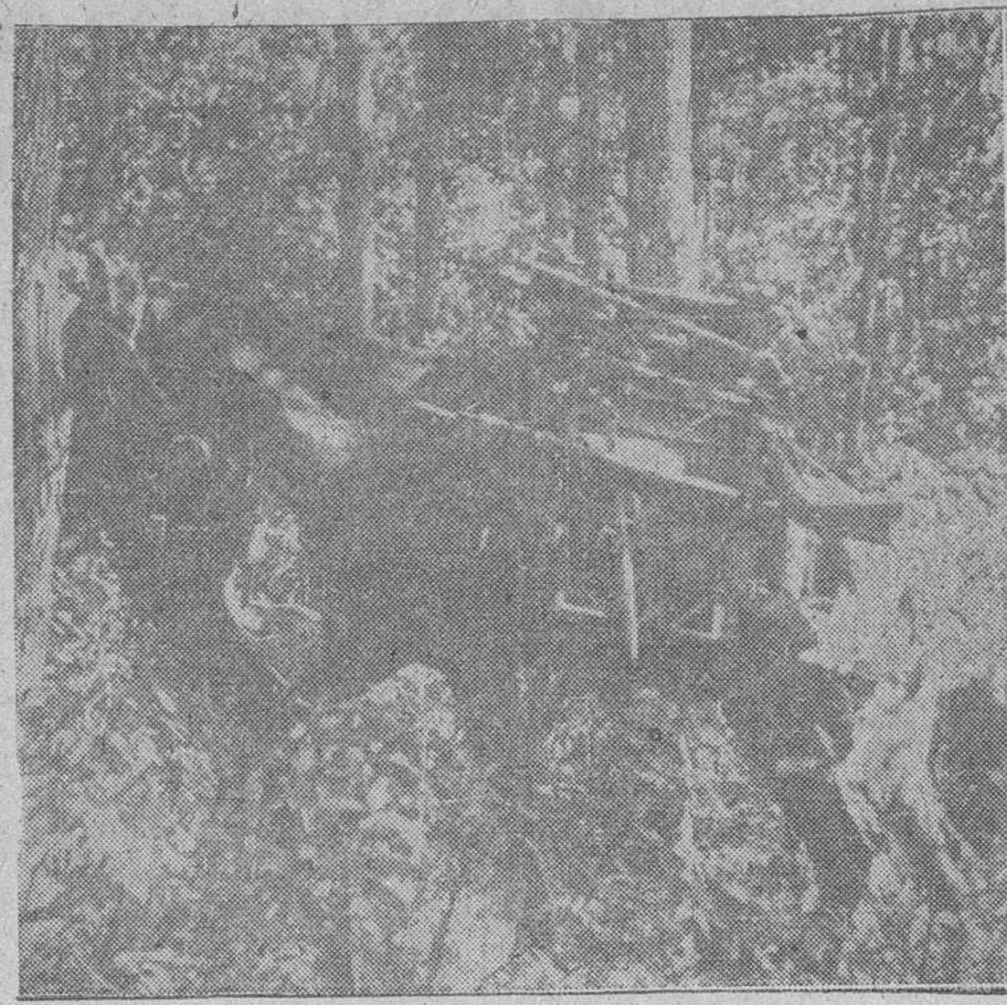
A través del bosque espeso como una selva virgen, conduce el estrecho sendero que con penoso trabajo, con cuchillos y hachas, hubo de ser abierto por los soldados alemanes.