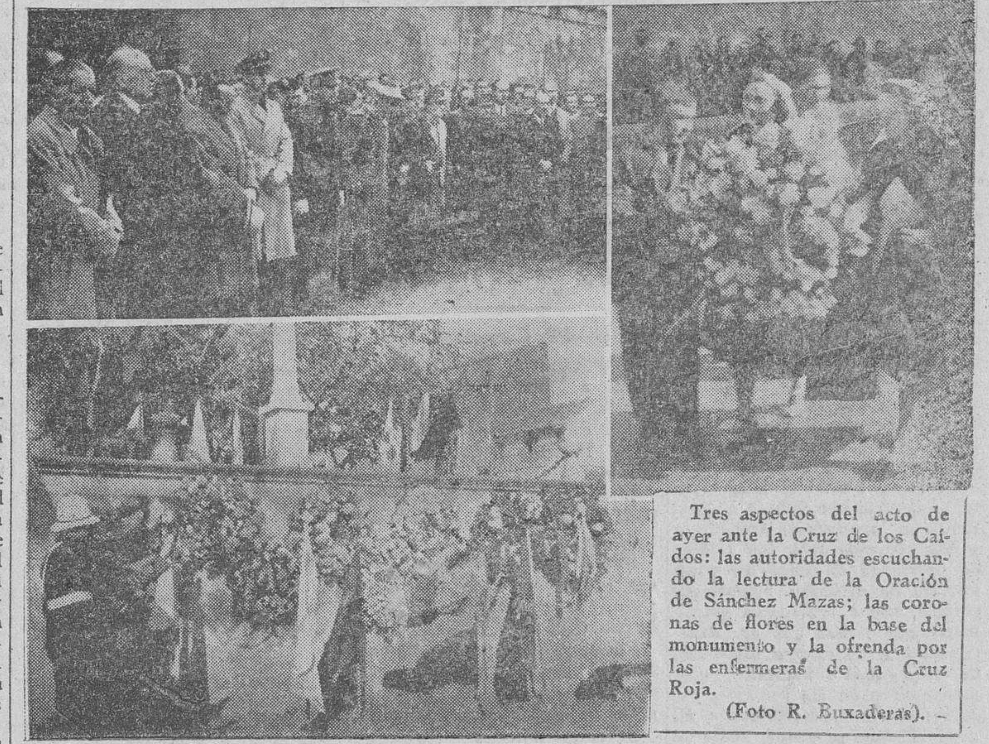
Tres aspectos del acto de ayer ante la Cruz de los Caídos: las autoridades escuchando la lectura de la Oración de Sánchez Mazas; las coronas de flores en la base del monumento y la ofrenda por las enfermeras de la Cruz Roja.

BRILLANTE DESFILE Terminado el acto, los ministros del Ejército y secretario general del Partido, abandonaron el teatro y se dirigieron a la tribuna levantada en la Plaza de Santa Ana, para presenciar el desfile. El General Asensio tenía a sus lados a los ministros de Agricultura y secretario general del Partido. Asimismo ocuparon sus respectivos puestos en la tribuna, los ministros que habían asistido al acto, jerarquías y autoridades. Inmediatamente comenzó el desfile. Abrió marcha la Banda de música de las fuerzas de la Casa Militar de S. E. el Jefe del Estado, que se situó al pie del teatro Español, dando frente a la tribuna. Aparecieron en primer término los camaradas de la Vieja Guardia, que fueron largamente ovacionados por el enorme público allí estacionado. Iban después los ex combatientes de la División Azul, que con su marcialidad hicieron desbordar el entusiasmo de la multitud. Prosiguió el desfile en el orden anteriormente señalado y el público aplaudió el paso de las distintas unidades. (Logos)