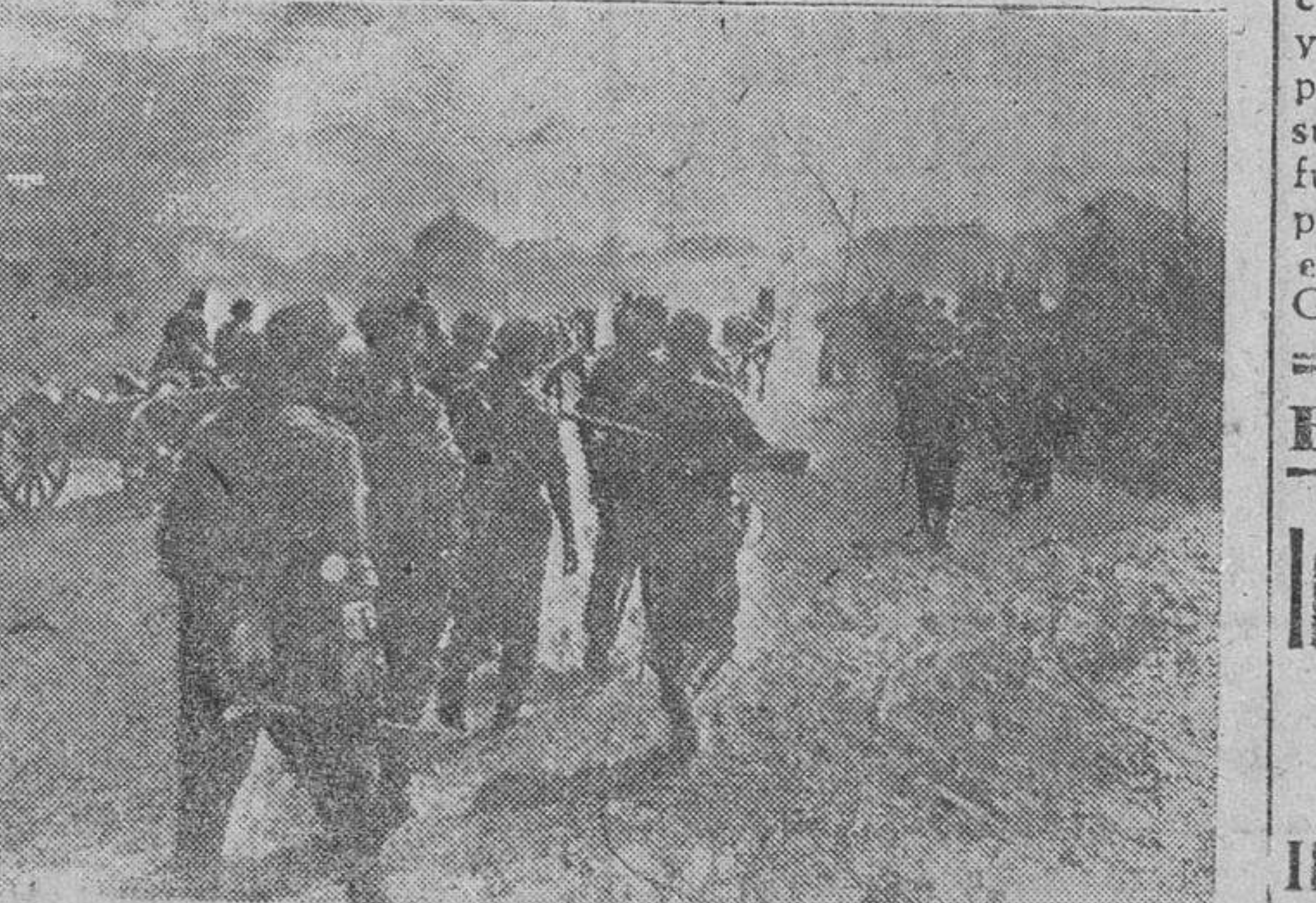
Infantes alemanes avanzando por el sector del Volga

En operaciones locales, nuestros aviones han destruido numerosas fortificaciones. Al sur del lago Ladoga, el enemigo ha sido desalojado de sus posiciones sólidamente establecidas. Los contraataques contra estas posiciones reconquistadas han fracasado. Los intentos del enemigo para