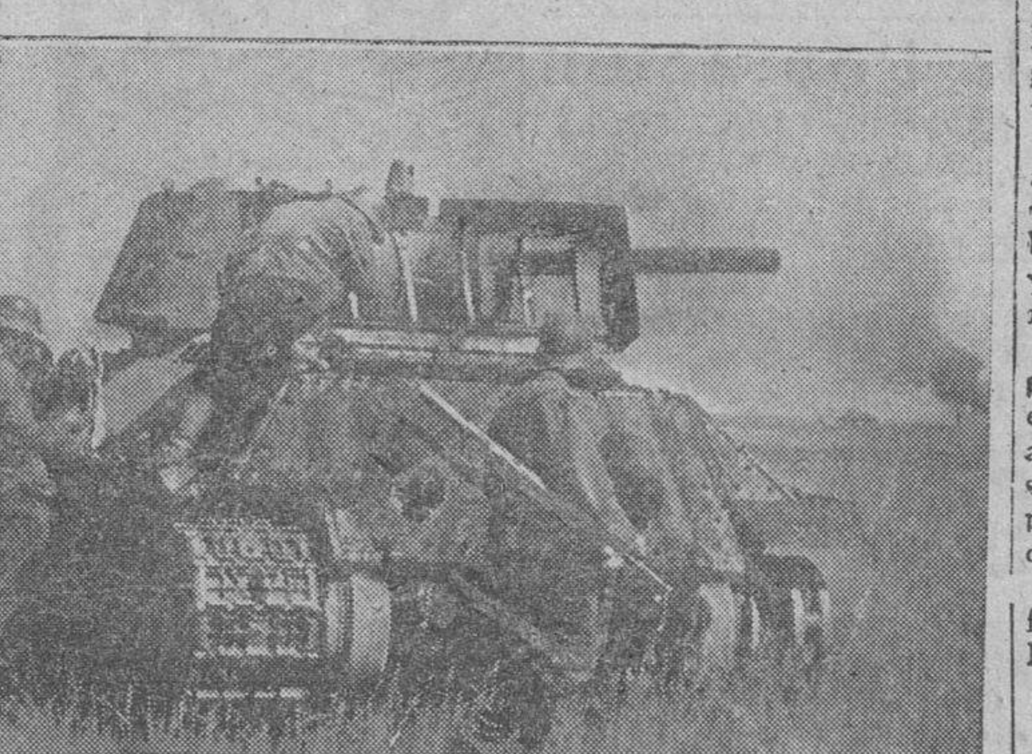
Un momento de una batalla de tanques en la conquista por los alemanes de un punto de acceso a la ciudad soviética