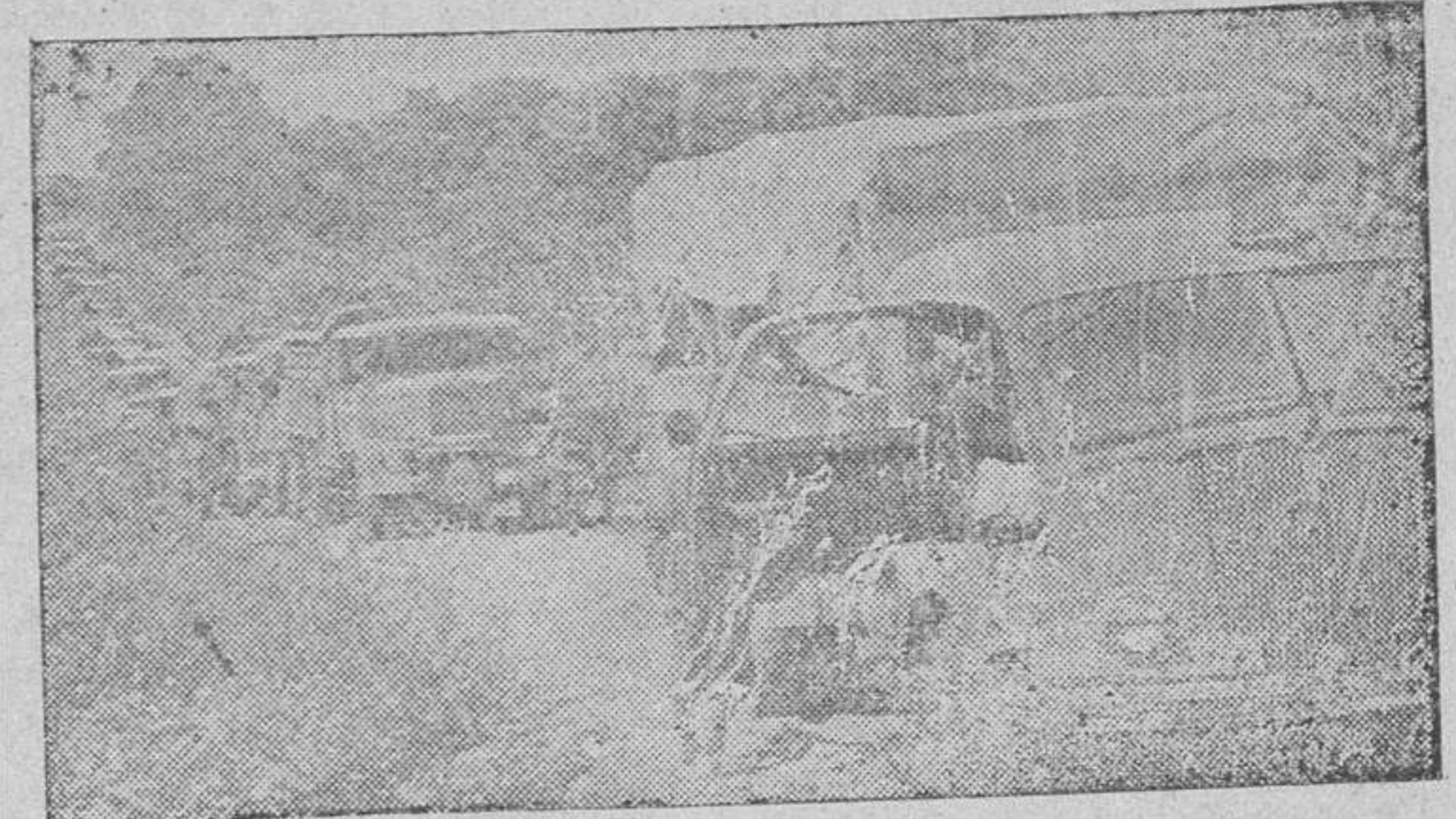
Una columna italiana de aprovisionamiento en marcha hacia las primeras líneas