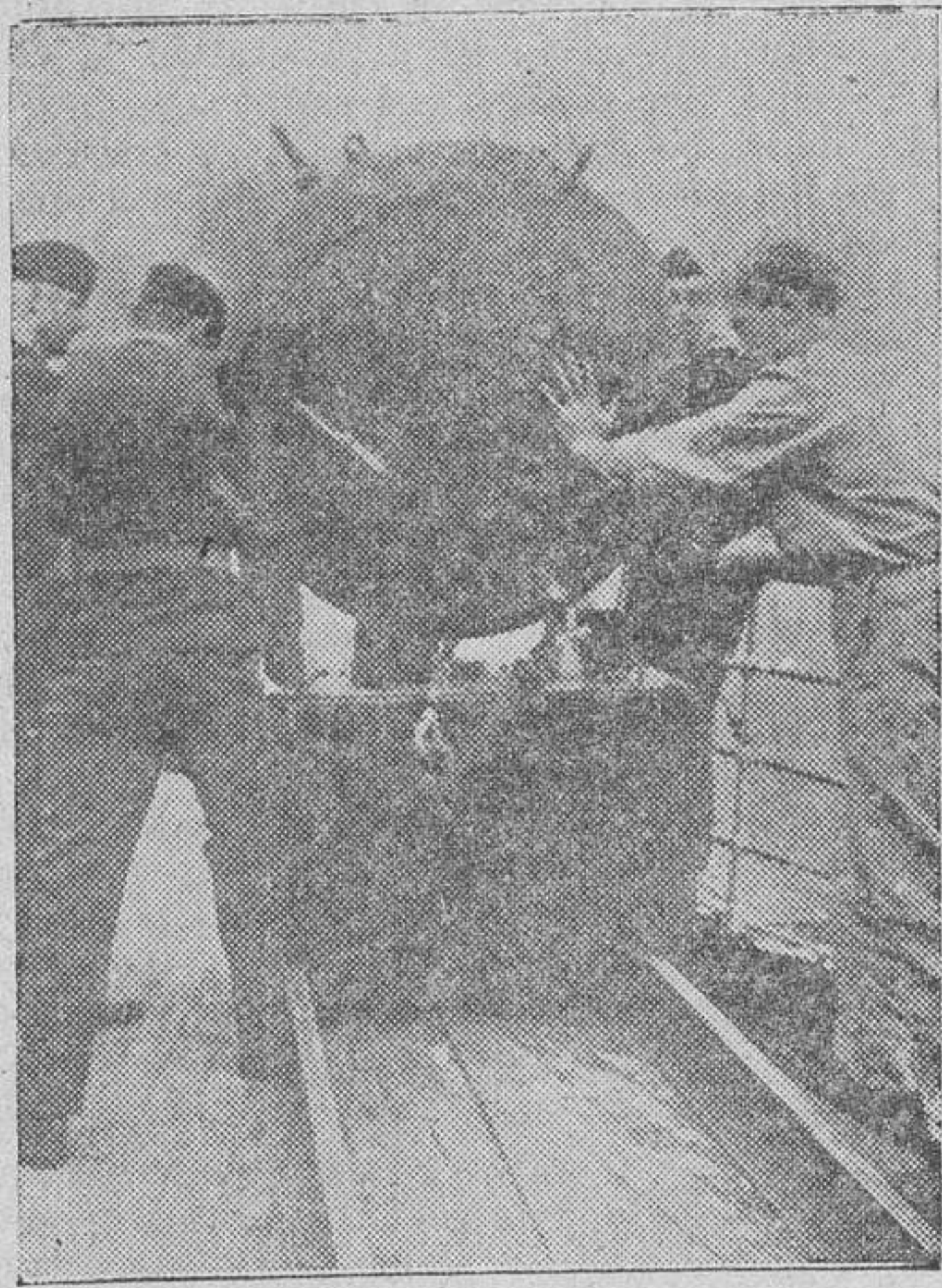
Momento en que los tripulantes de un minador alemán lanzan una mina para formar nuevas barreras ante los principales puertos de Inglaterra

Gran Cuartel General del Führer. Comunicado del Alto Mando de las fuerzas armadas alemanas: "En la parte noroeste del Cáucaso, las tropas alemanas y eslovacas han conquistado varias alturas tras librar fuertes combates. En la costa del Mar Negro, una lancha rápida alemana ha hundido un vapor soviético de 1.000 toneladas. En la batalla alrededor de Stalingrado, las tropas alemanas han avanzado ahora sobre los barrios septentrionales de la ciudad. El terreno conquistado hasta este momento en la ciudad ha quedado completamente limpio de enemigo. Estos ataques han sido eficazmente apoyados por el fuego de la artillería del Ejército y de las S. S. y por la acción de la aviación y de las fuerzas aéreas de combate a corta distancia, tanto alemanas como rumanas y croatas. Los ataques emprendidos por el enemigo al norte y al sur de la ciudad han fracasado de nuevo.