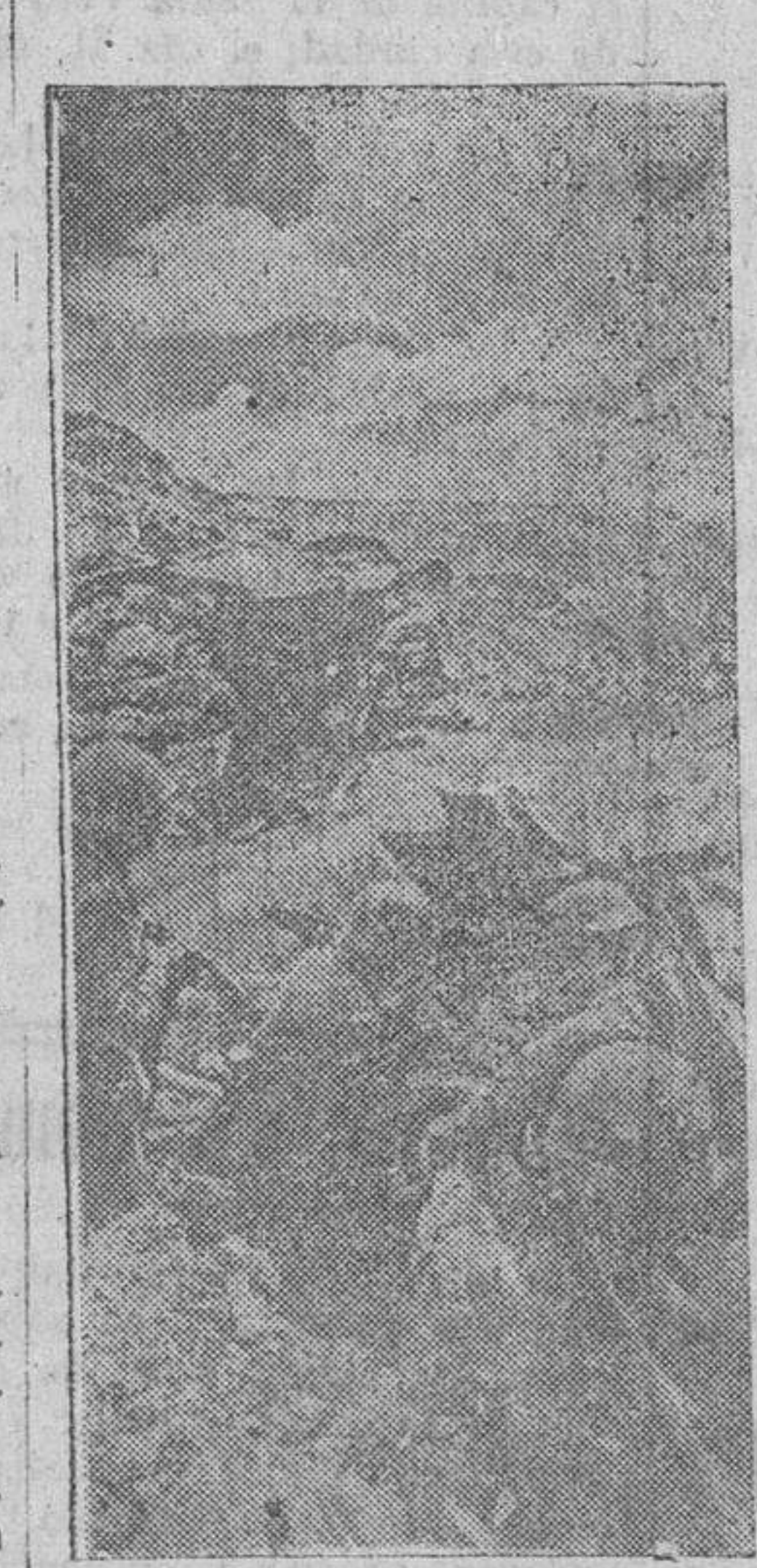
De la batalla del Don. — Un cañón antitanque alemán en acción.