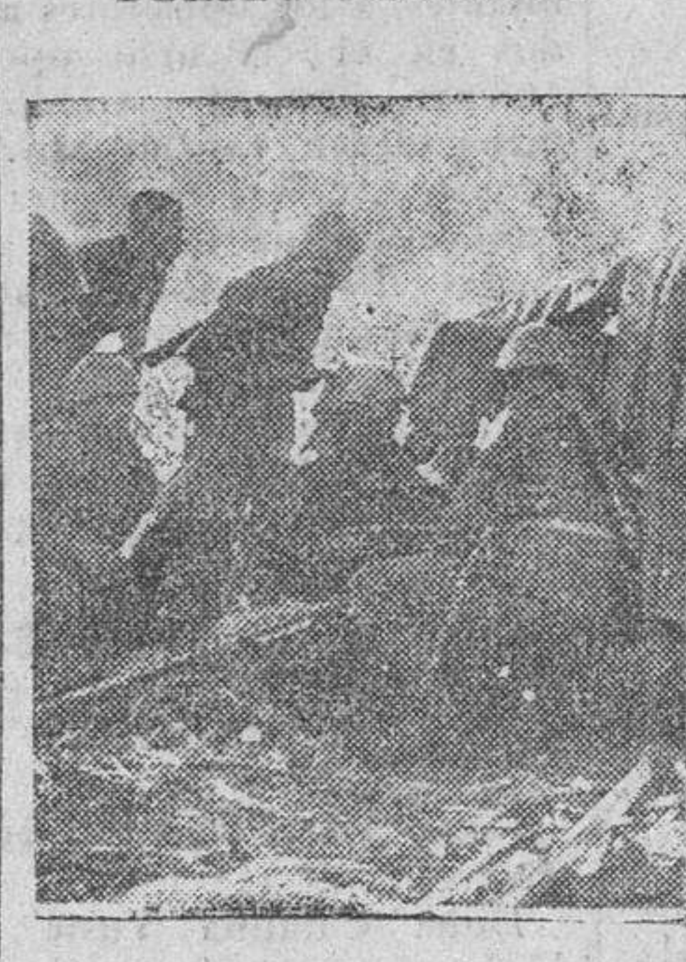
Artillería de campaña del Ejército expedicionario italiano en Rusia.