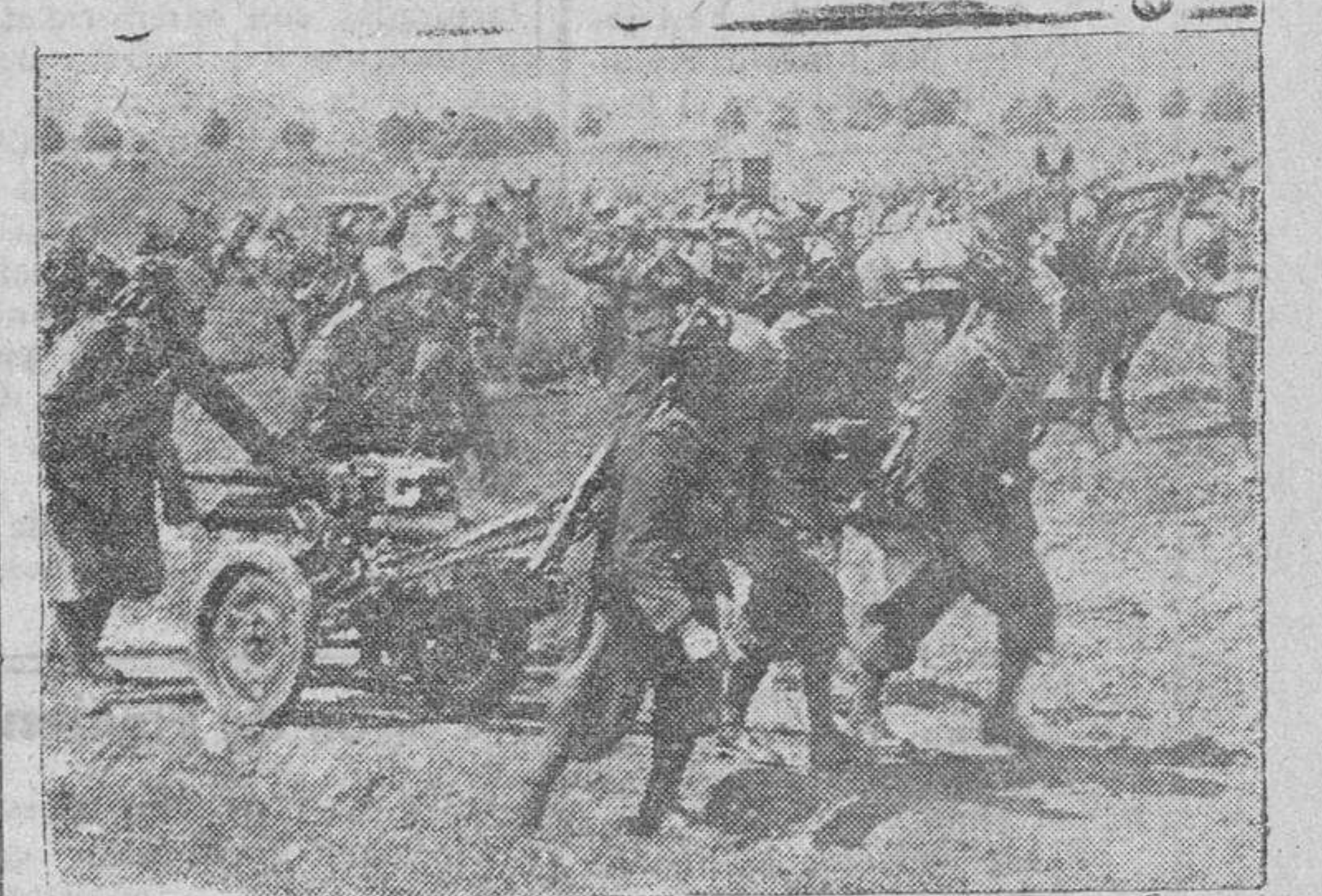
Fuerzas del Cuerpo expedicionario italiano en Rusia en su avance por una de las zonas recientemente conquistadas