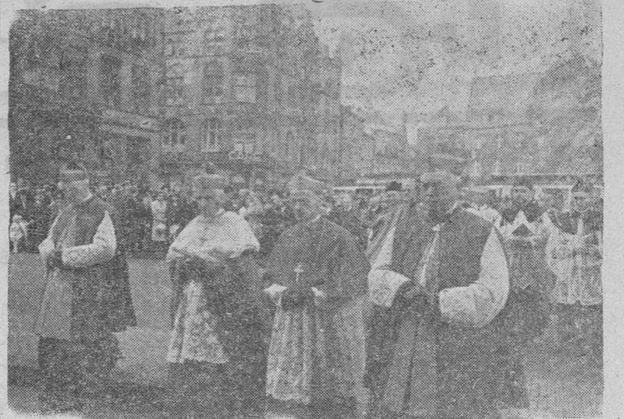
Recientemente ha tomado posesión de la Archidiócesis de Colonia, el doctor Frings. La foto recoge la procesión, después de la ceremonia, dirigiéndose al Palacio del nuevo Arzobispo