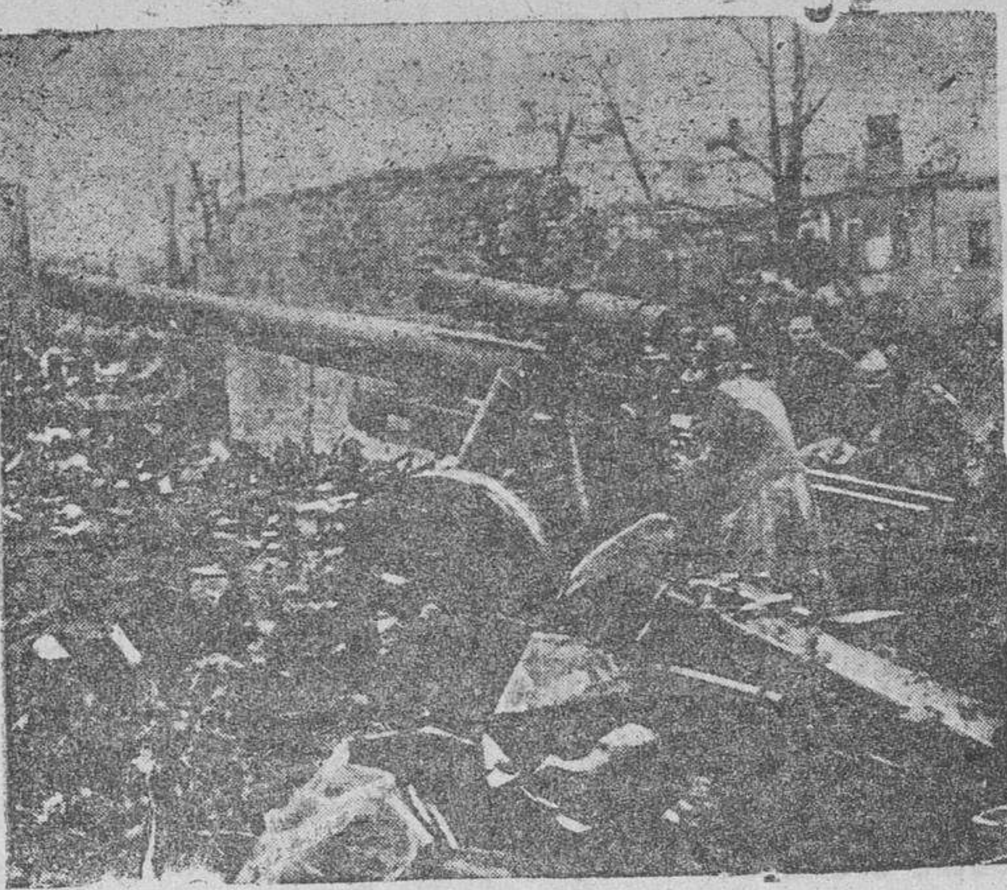
Batería de artillería alemana empleada en una localidad rusa recientemente conquistada

Grupos Electro-Bomba Entregas en el acto VALLE Gran Capitán, 20 Teléfono 2040