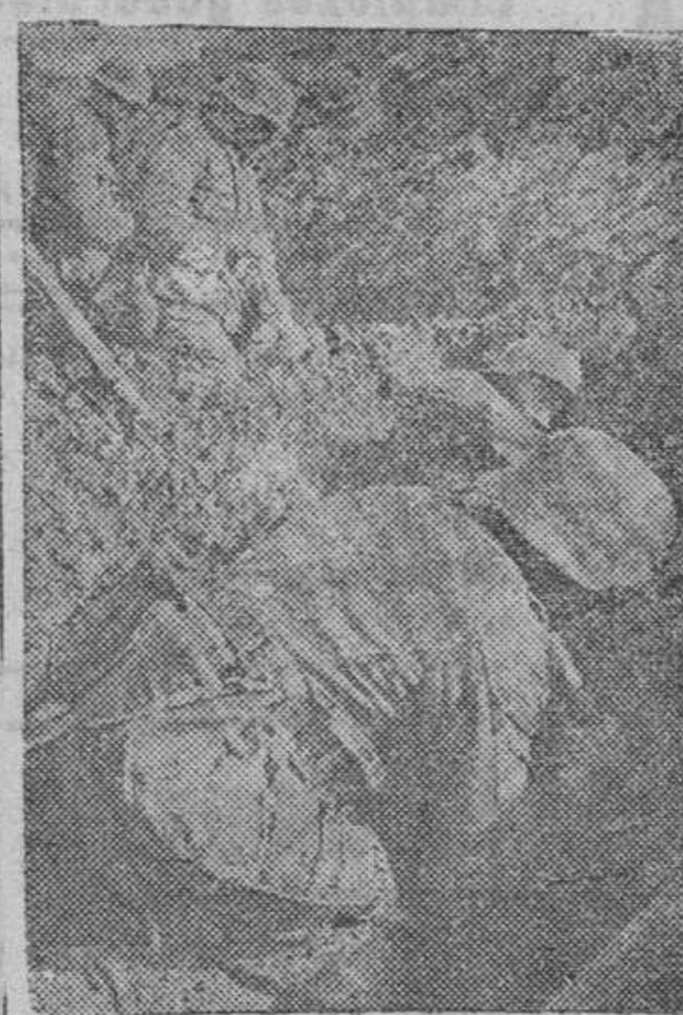
Soldados alemanos cargando una trinchera de dinamita para realizar una voladura, en el frente ruso.

"CUANDO SE TRATA DE REHACER UNA PATRIA, CUANDO LA VIDA DE UN PUEBLO SE MUEVE ENTRE EL SER O EL NO SER, LAS OPOSICIONES, AUNQUE TENGAN UN APARENTE DESEO DE SUPERACION ENCIERRAN TAL GERMIN DISOLVENTE QUE YA NO SON OPOSICIONES, SON TRAICIONES". (Arrese).