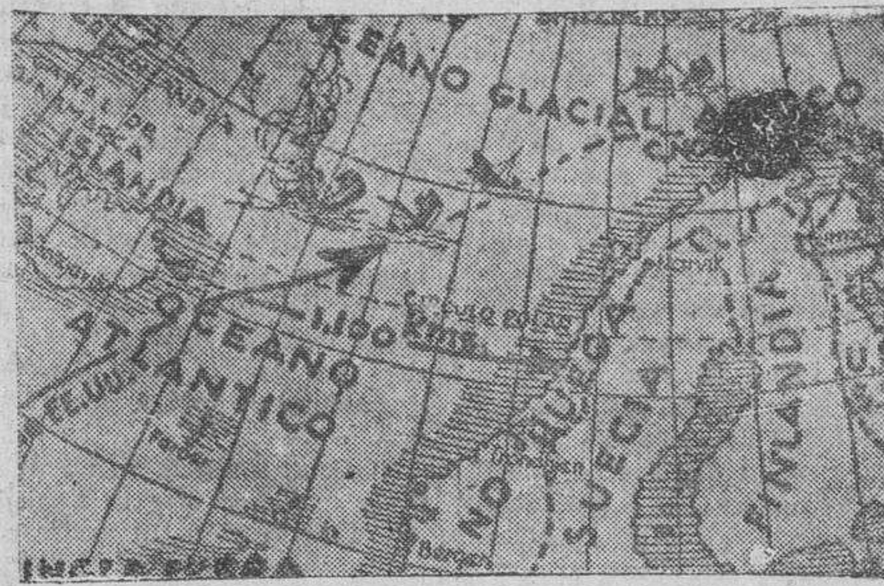
Un gráfico del escenario, donde fueron hundidos los barcos de un convoy norteamericano

Se han rechazado todos los ataques bolcheviques en la región de OREL