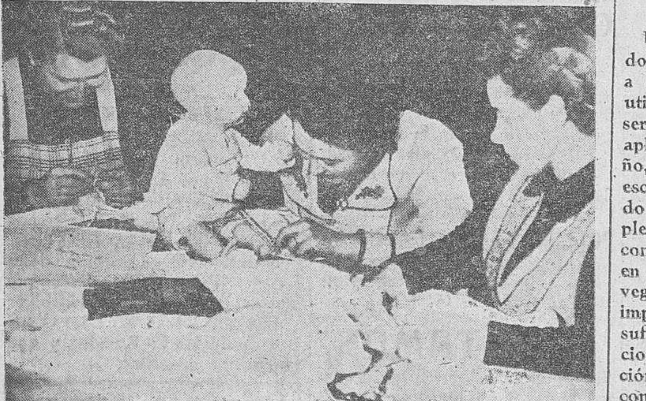
Cómo preparan sus vestiditos

Los cursillos son de 30 lecciones, en las que, utilizando bellos muñecos, en representación de los niños de pecho, las profesoras enseñan, con demostraciones prácticas, cómo se debe vestirlos y desnudarlos, cómo acostarlos y bañarlos, cómo preparar sus alimentos de acuerdo