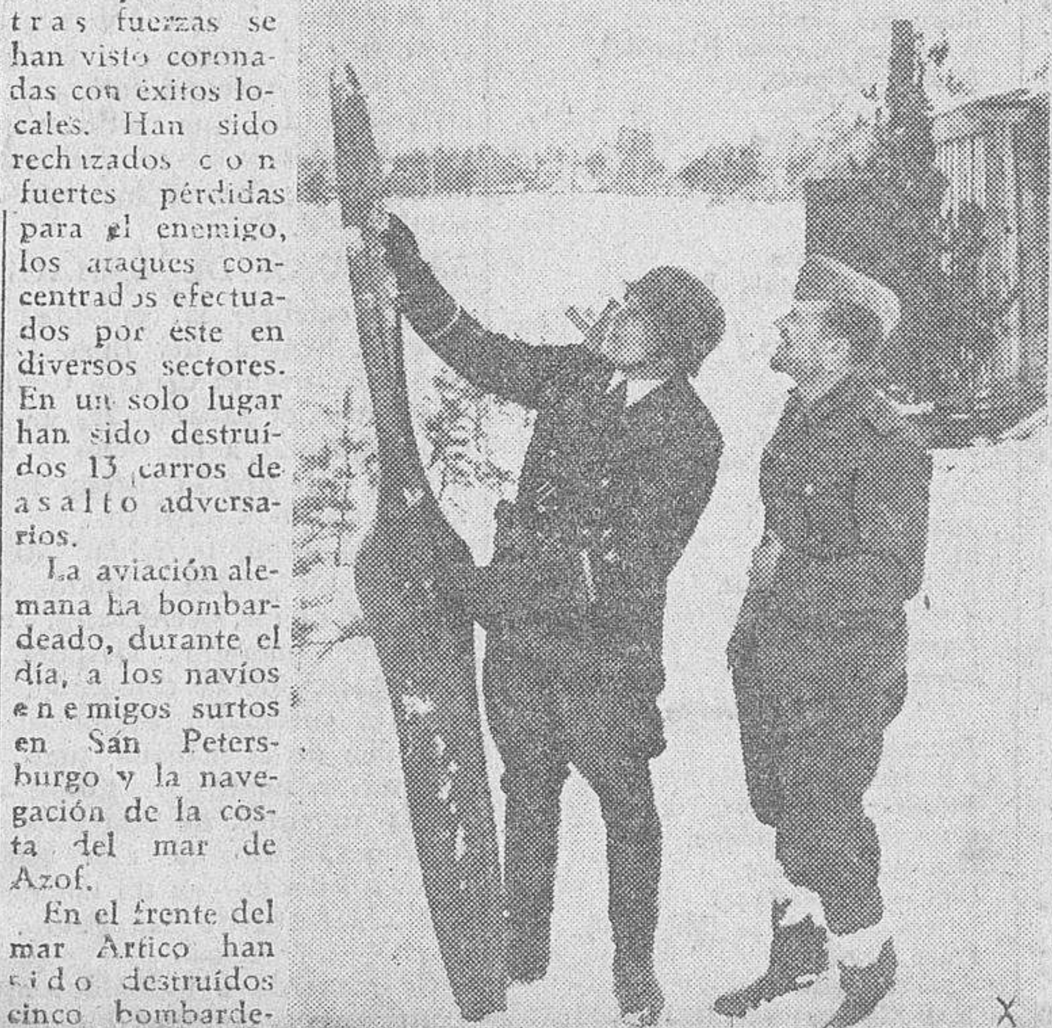
La hélice de un "rata" soviético derribado por un antiaéreo alemán es examinada por dos soldados del Reich.

Los muelles de Dunquerque y los aeródromos y territorios ocupados por el enemigo fueron igualmente bombardeados. Se sembraron minas en aguas adversarias.