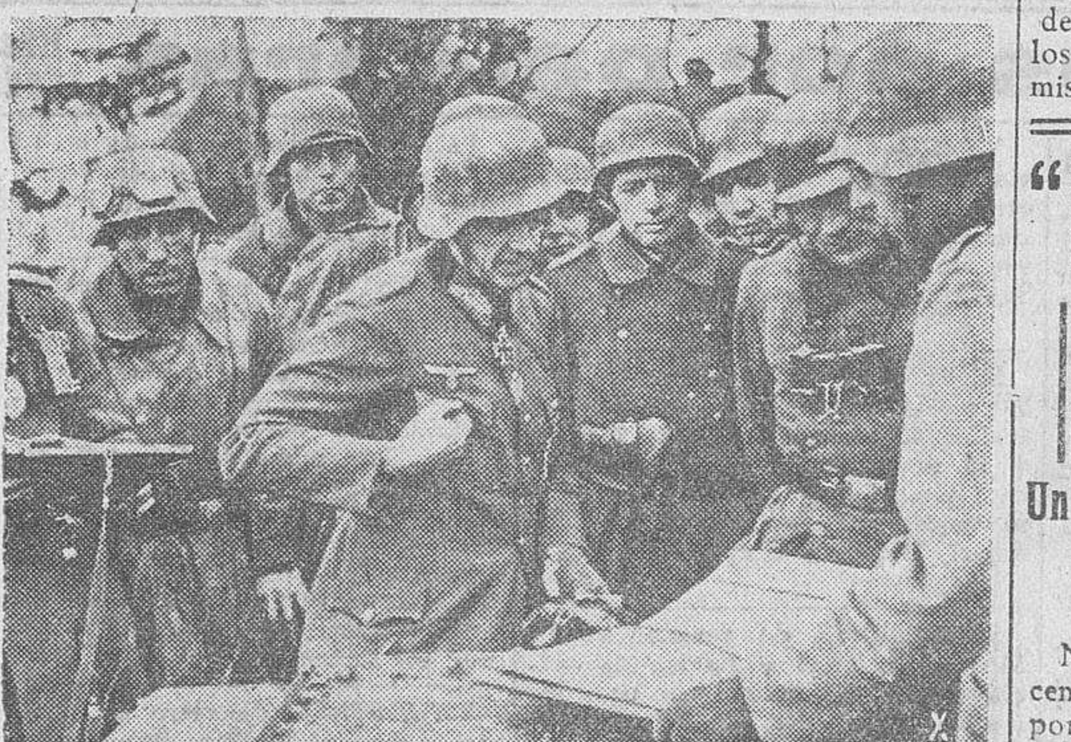
Actividad en el frente ruso.—Los jefes del Alto Mando alemán estudian los planes de la próxima campaña.

En Carelia las tropas germano-finlandesas que operan en el frente del sur han infligido al adversario elevadas pérdidas en varios días de combates defensivos. En el Océano Glacial Ártico los submarinos alemanes, apoyados por la aviación, han hundido a dos barcos enemigos con un desplazamiento total de 12.000 toneladas, entre ellos un petrolero. Estas unidades formaban parte de un convoy escoltado. Tres buques más resultaron averiados, y