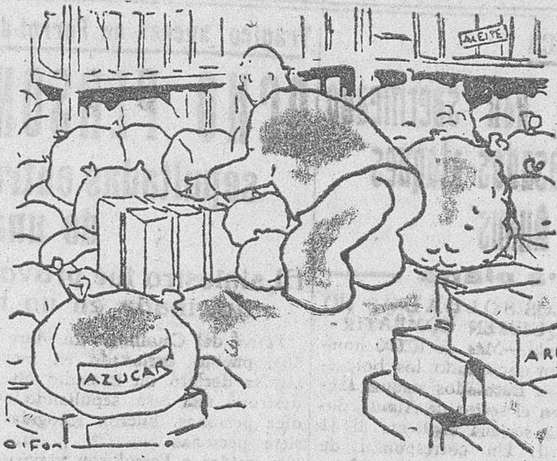
Que conste que estas líneas no constituyen el "pie". Cada lector ya sabe dónde debe ponerlo...