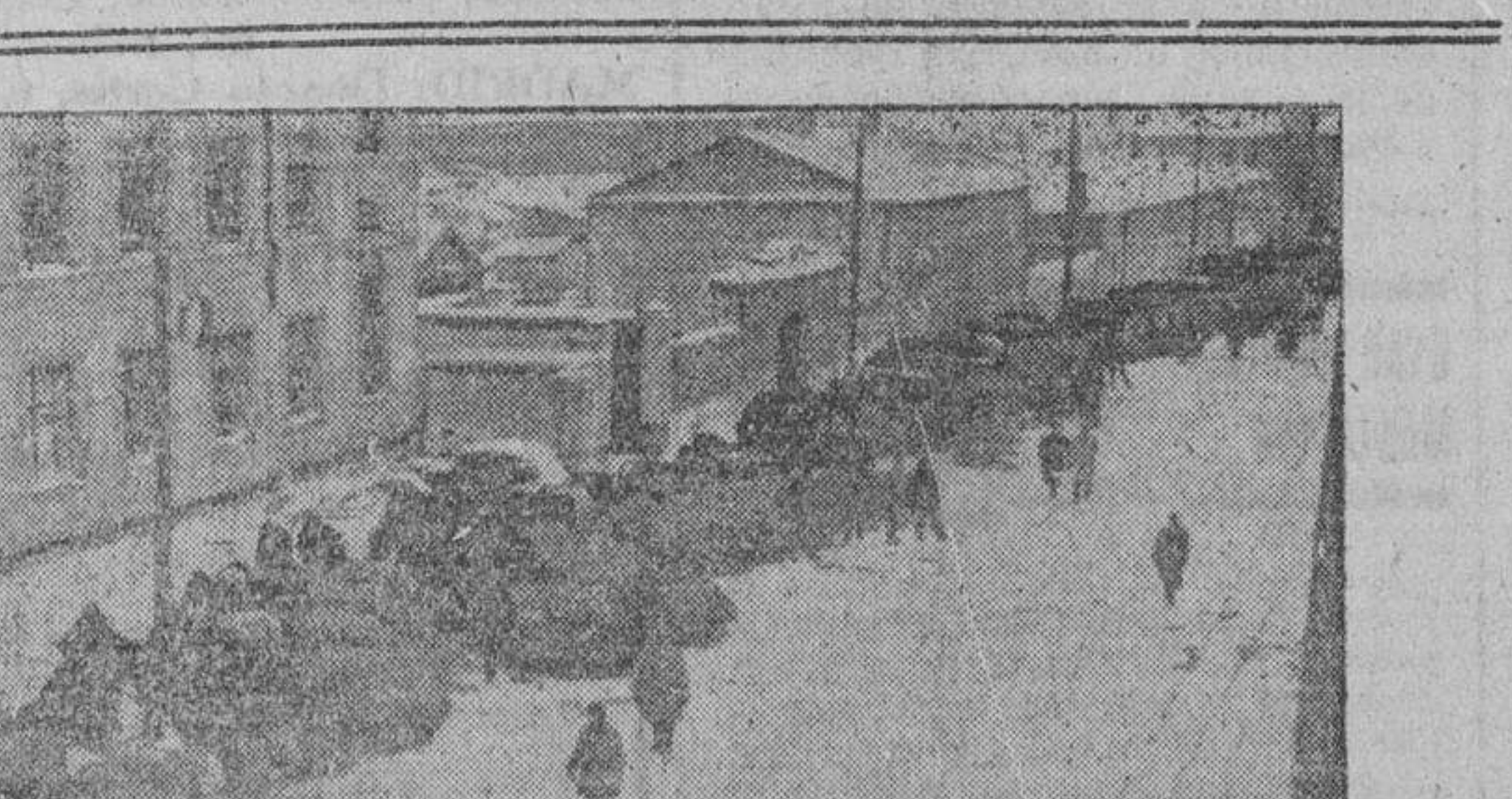
Columnas alemanas de abastecimientos para el frente, compuesta de ríncos arrastrados por caballos.

Roma.—El Gran Cuartel General de las fuerzas armadas italianas comunica: "Actividad de patrullas en el sector de Mechili. La aviación alemana e italiana atacó ayer en varias ocasiones importantes objetivos enemigos en Libia y en la isla de Malta..."