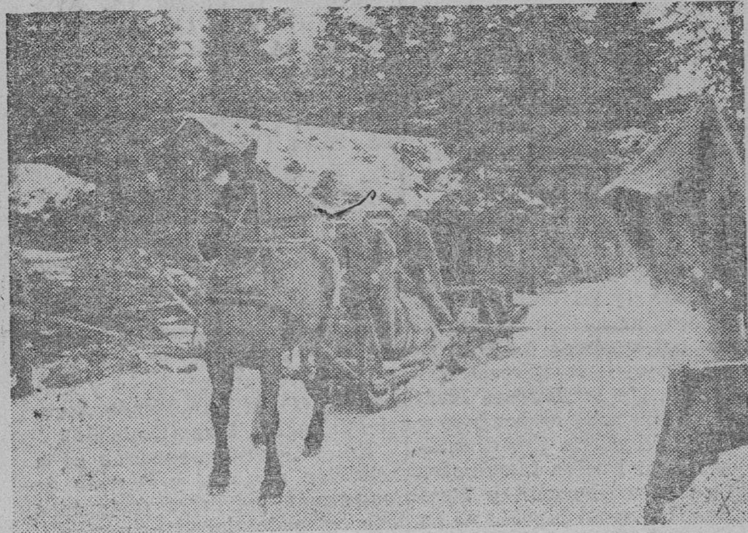
Para el transporte de víveres y municiones en el frente de San Petróburgo las tropas alemanas usan trineos arrastrados por caballos.

Recuerda la inefable alegría que, al despertar, experimentabas de niño, en la mañana de Reyes, y no niegues a la infancia de hoy el mismo gozo y la dicha inmensa de aquellos días felices.