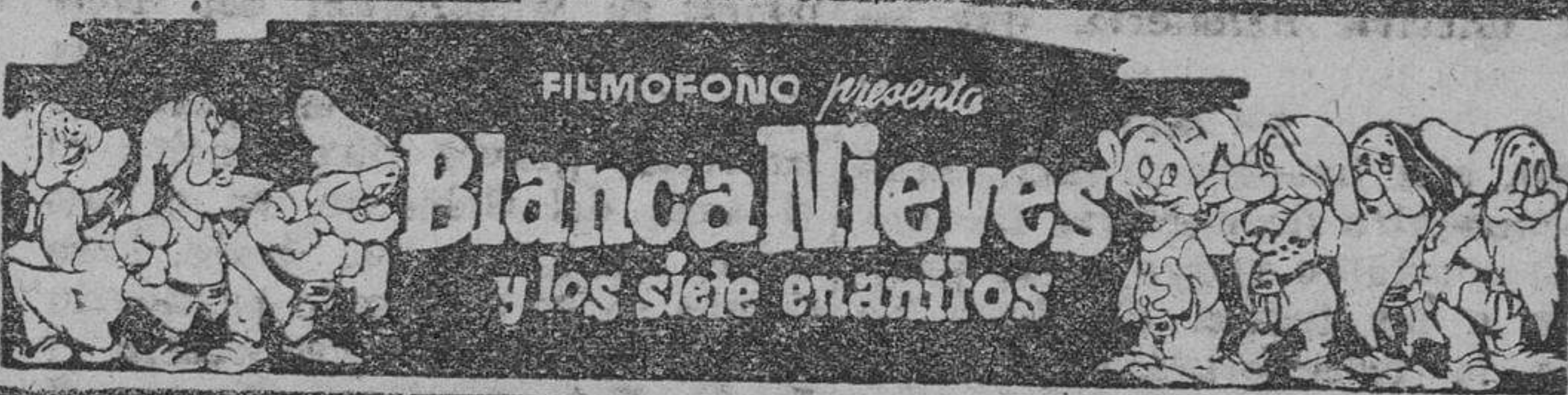
FILMOFONO presenta Blanca Nieves y los siete enanitos Publicidad AVIL

Aprobar la propuesta del seleccionador sobre celebración de dos