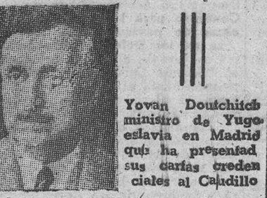
Yovan Douchitch, ministro de Yugoslavia, que ha presentado sus cartas credenciales al Caudillo