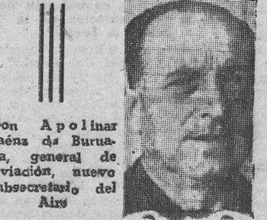
Don Apolinario Saenz de Buruaga, general de Aviación, nuevo subsecretario del Aire