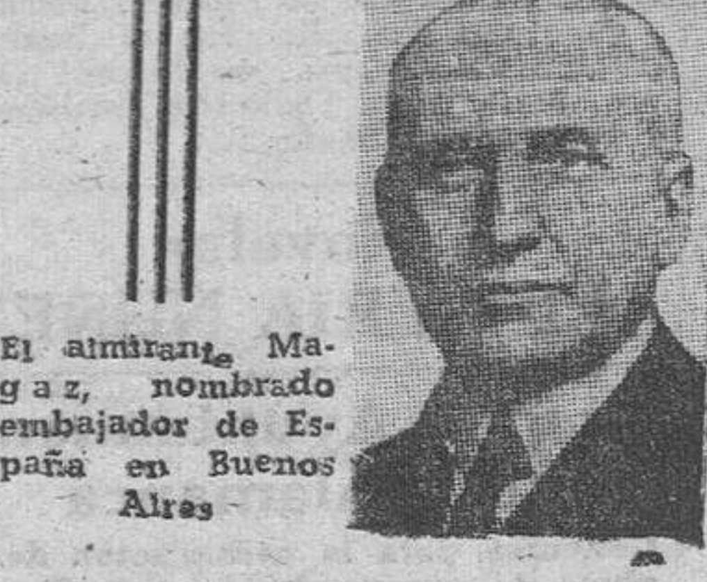
El almirante Magaz, nombrado embajador de España en Buenos Aires