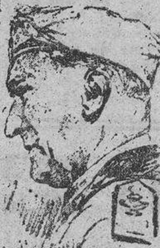
El mariscal Graziani

Roma. - "Relazioni Internazionali" escribe hoy en su artículo de fondo: "El último acto del drama europeo empieza ahora. Ha sonado la hora de Inglaterra. Las potencias del eje van a emprender el ataque contra el Imperio británico, tanto en la Metrópoli como en África. En esta batalla, el Mediterráneo desempeña un papel preponderante. La desintegración del mariscal Graziani para sustituir a Balbo, indica que Italia está preparada para la lucha y se dispone a combatir bajo la dirección expertísima de un militar de extraordinaria competencia. Diga lo que diga Churchill, una vez conquistado Londres, la Gran Bretaña habrá dejado de existir, y con ella, su hegemonía tiránica. En cuanto se haya derribado el poderío financiero y económico inglés se habrá disuelto el Imperio. Aun cuando Churchill pretenda otra cosa para levantar la moral de los ingleses, sabe que es cierto y que sucederá.