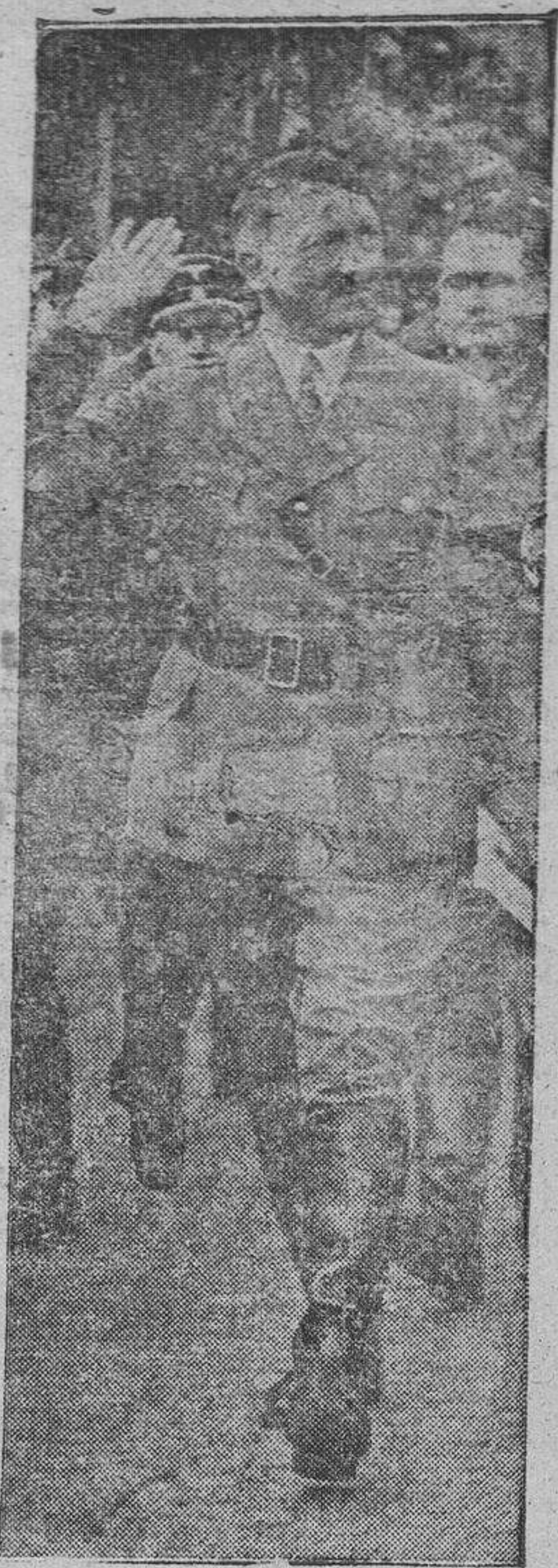
formada la compañía de honor, integrada por la guardia personal del Führer.

El Führer prodigaba sus saludos en todas direcciones, especialmente a los heridos que ocupaban un lugar de honor. El Führer subió a continuación a su automóvil y atravesó lentamente la Saarland Strasse, materialmente sembrada de flores. La entrada del Führer en Berlín ha sido verdaderamente triunfal, y puede afirmarse que toda la población berlinesa se encontraba en las calles para dar la bienvenida al vencedor. Ante la Cancillería del Reich estaba formada la compañía de honor, integrada por la guardia personal del Führer.