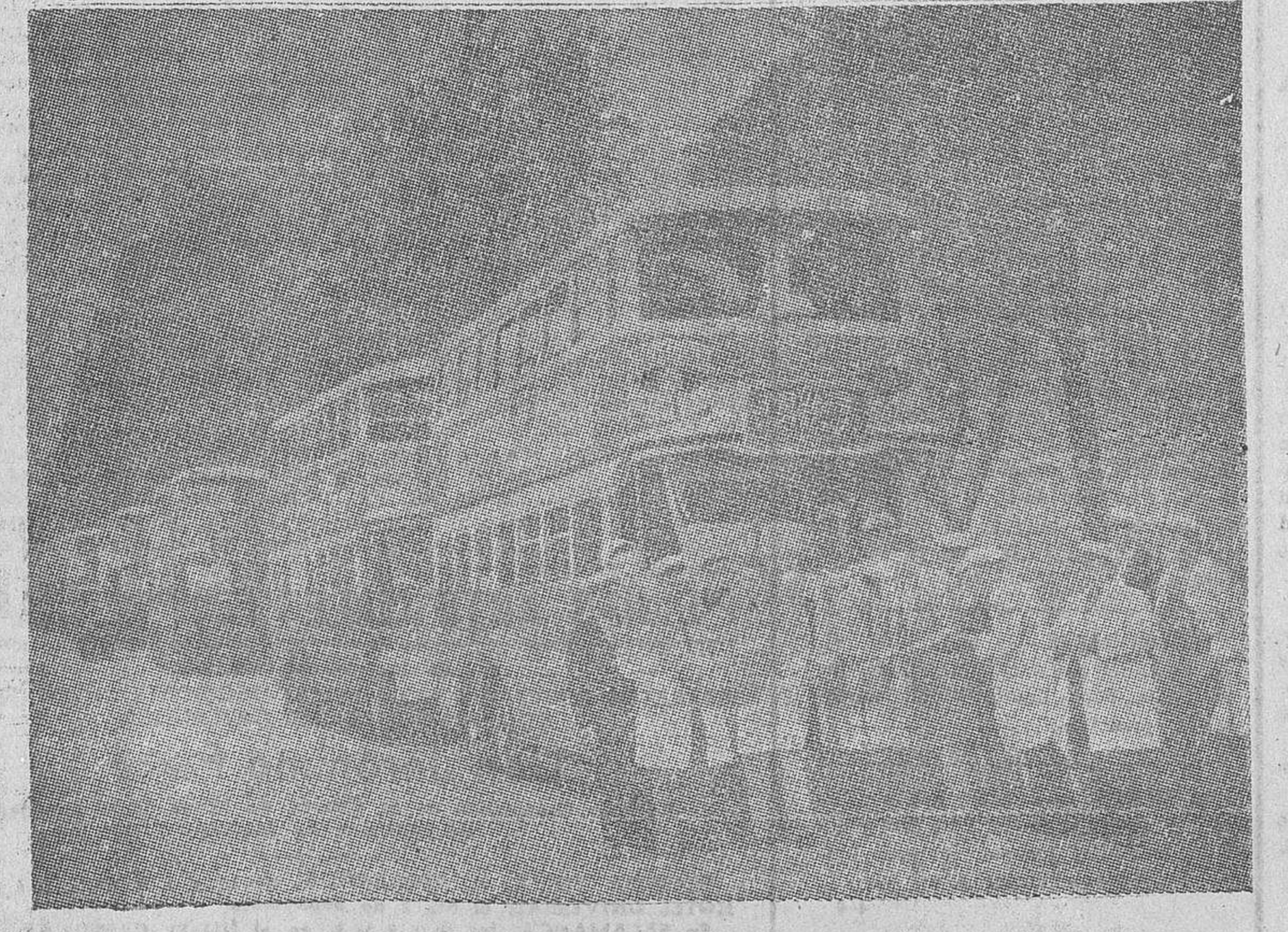
Ordenada por el Gobierno británico la requisita de vehículos, éstos se han estacionado frente al Ministerio de la Guerra en espera de órdenes para el traslado de tropas

(Continúa esta información en la página siguiente.)