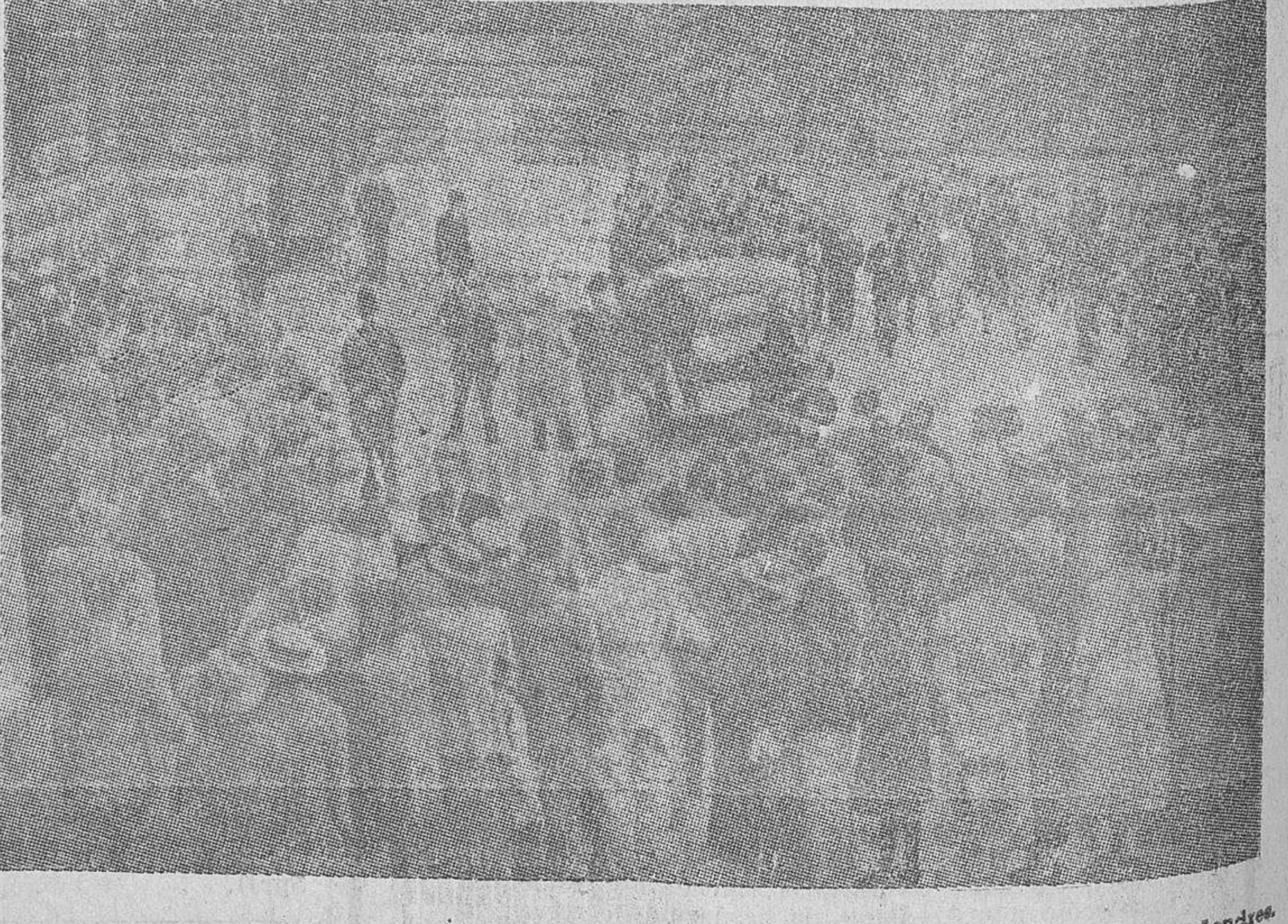
Durante los últimos días el espectáculo que recoge la fotografía se ha presenciado constantemente en Londres. La multitud ha permanecido estacionada frente al Foreign Office en espera de noticias