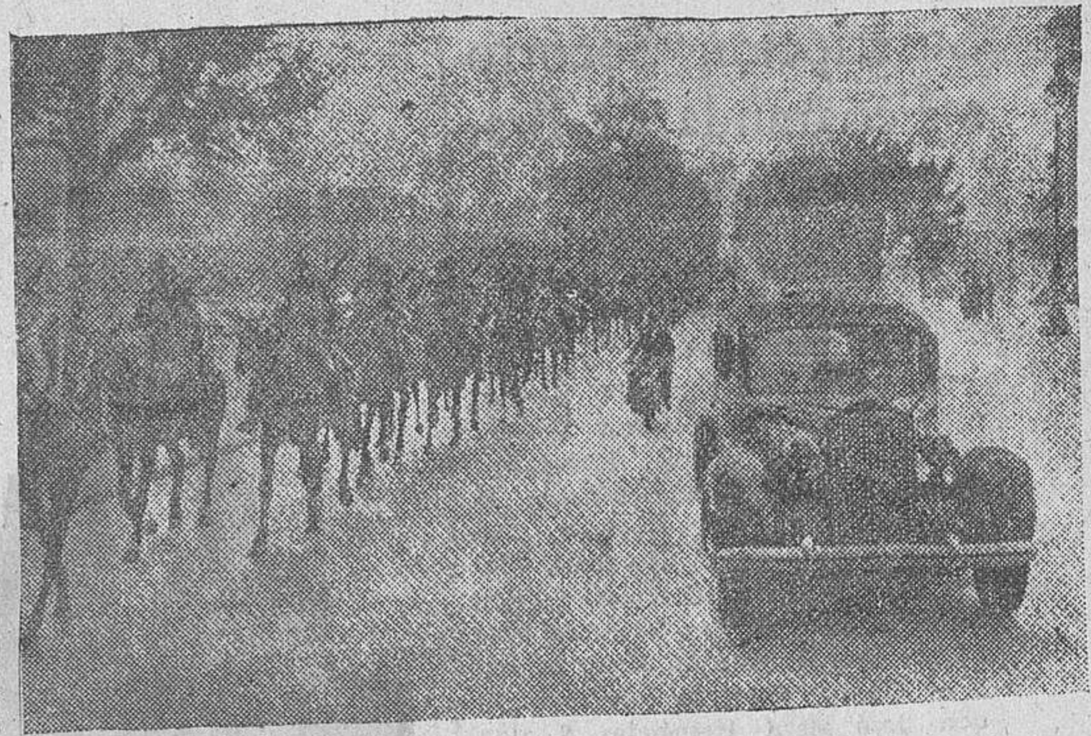
Un destacamento de caballería francesa atravesando las calles de París

SE VENDEN colchones y dos lunas. Informarán en Corrijo, 18, portería.