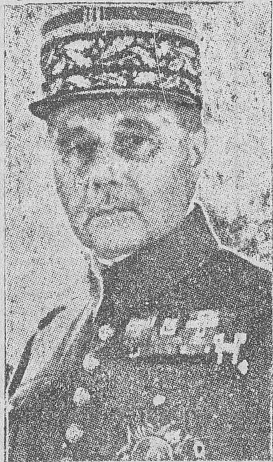
GAMELIN Generalísimo francés

el presidente Daladier conferenció con el generalísimo Gamelin. El ministro de Marina recibió al almirante Darlan, comandante en jefe de la flota francesa.