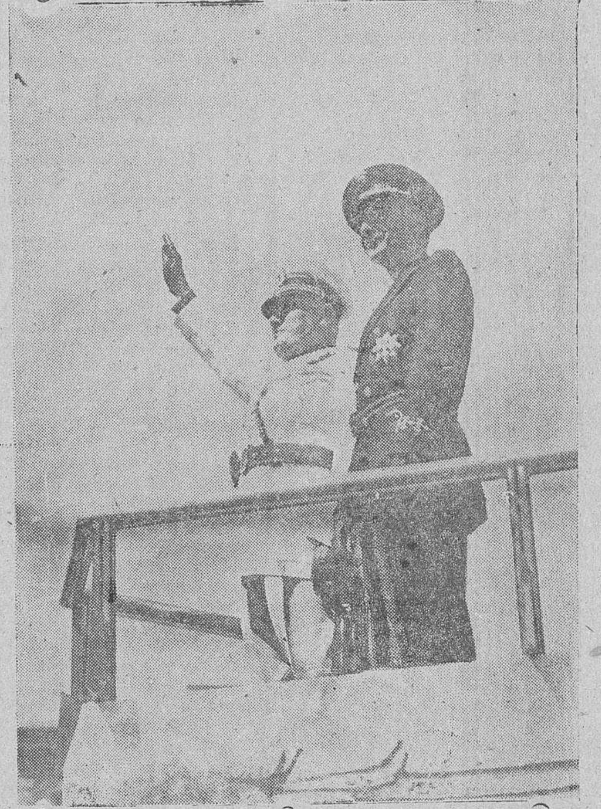
El Duce y el ministro es, año de la Gobernación, señor Serrano Suñer, presenciando el desfile de los legionarios por la Vía Nacional, de Roma