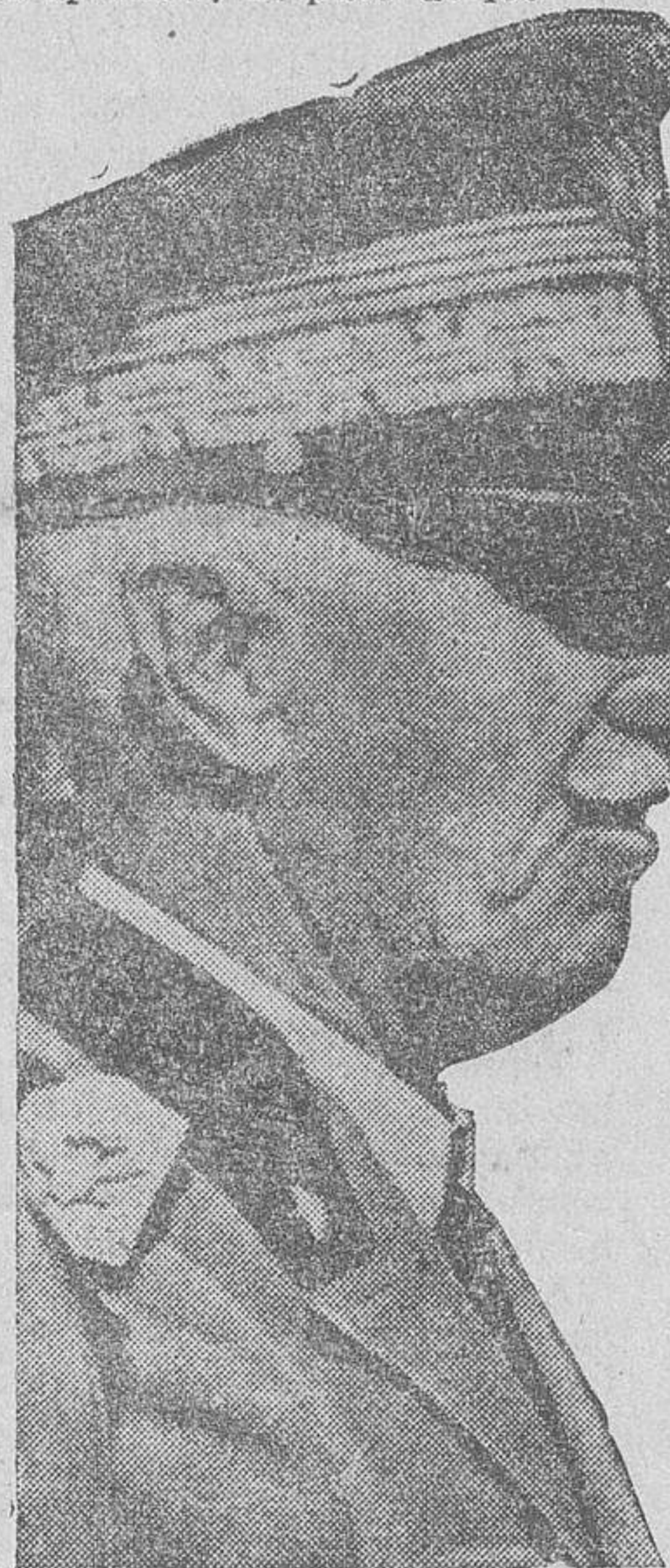
VICTOR MANUEL III