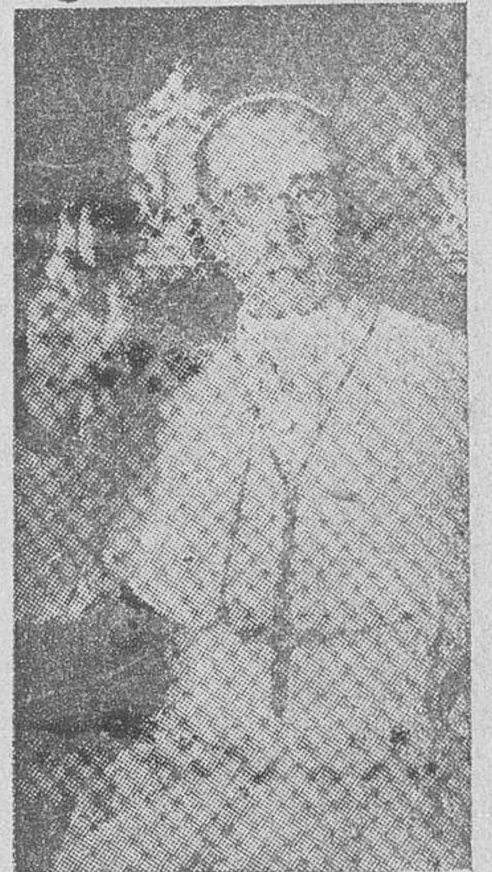
S. S. EL PAPA