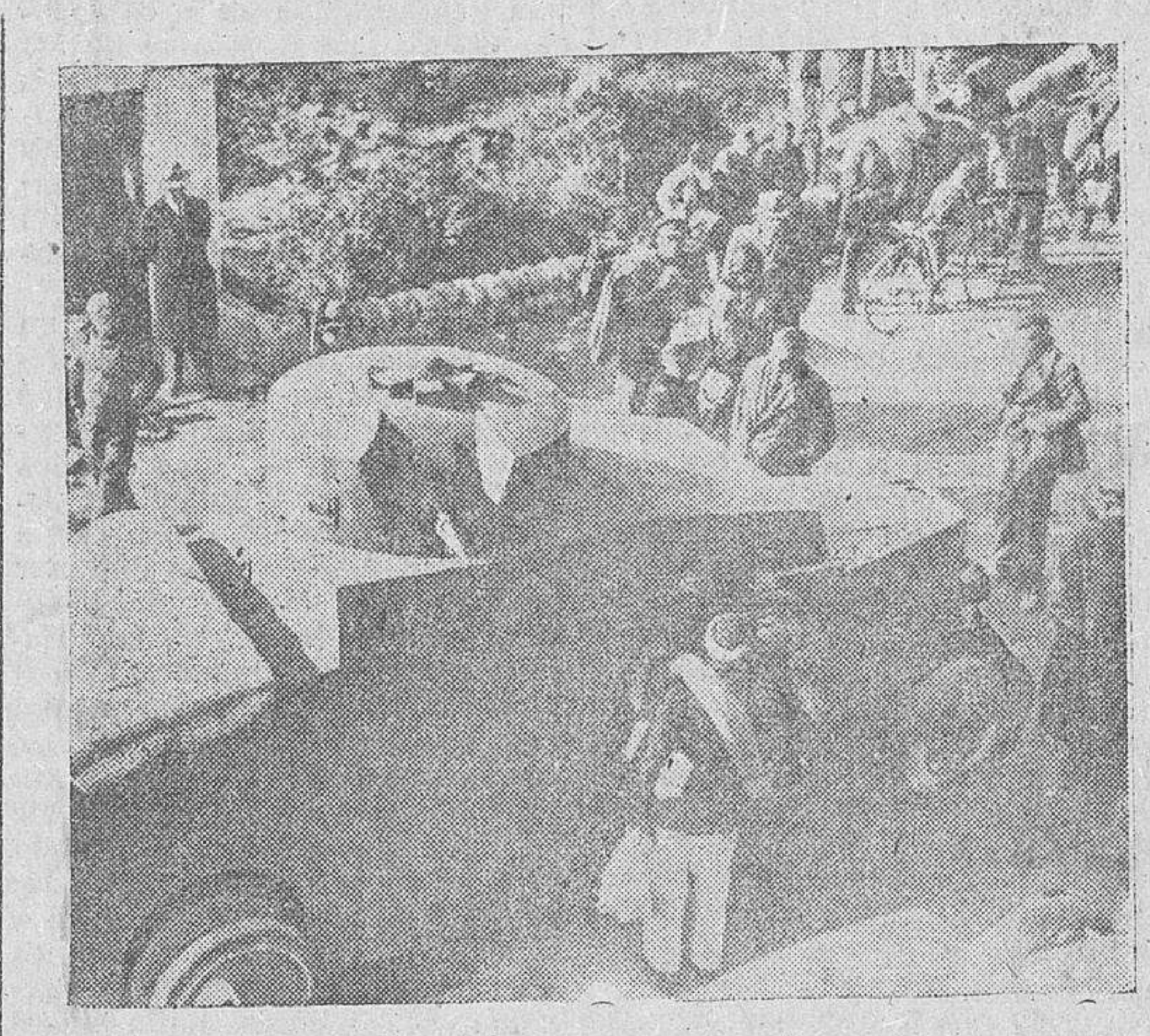
En virtud de lo estipulado entre los Gobiernos de España y Francia, todo el material de guerra llevado por los rojos a la nación vecina será devuelto al Ejército Nacional, único dueño de todo el armamento por legítimo derecho de conquista

Burgos.—El ministro de Asuntos Exteriores, general conde de Jordana, ha enviado al nuevo secretario de Estado de Su Santidad, su eminenencia el cardenal Maglione, su afectuosa felicitación por su designación para la dirección de la Cancillería diplomática de la Santa Sede.