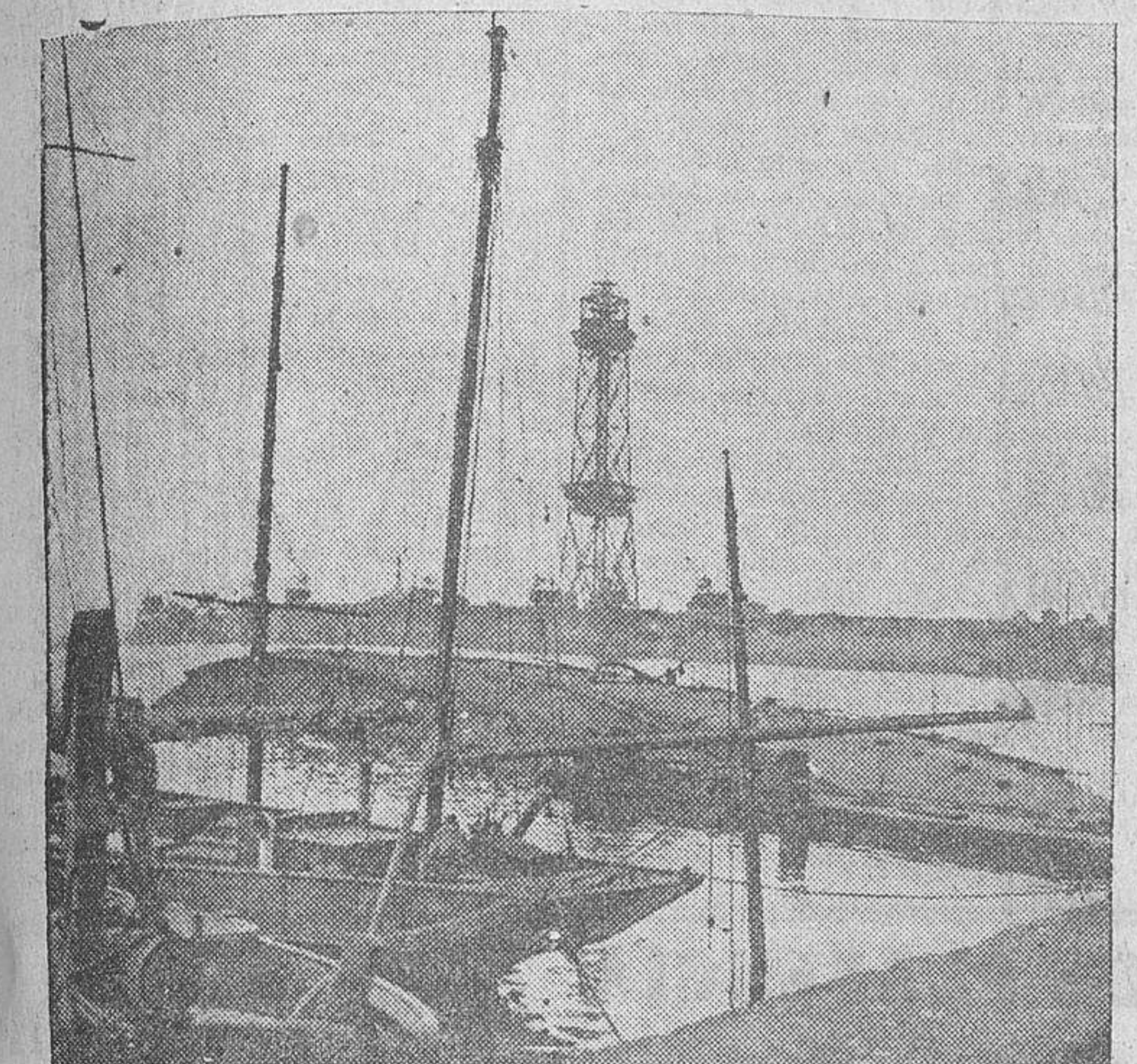
El puerto de Barcelona, lleno de barcos rojos hundidos por nuestra aviación, ha quedado expedito para el tráfico normal y para admitir junto a sus muelles a los grandes trasatlánticos

Burgos.—El ministro de Asuntos Exteriores, general conde de Jordana, ha enviado al nuevo secretario de Estado de Su Santidad, su eminenencia el cardenal Maglione, su afectuosa felicitación por su designación para la dirección de la Cancillería diplomática de la Santa Sede.