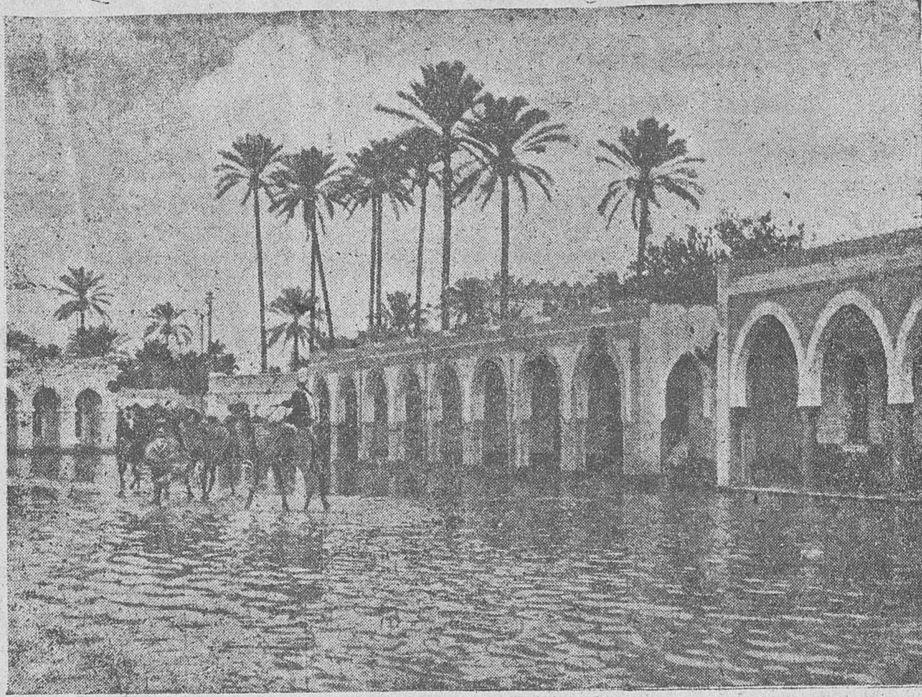
Recientemente han descargado sobre Tripoli abundantísimas y beneficiosas lluvias. He aquí un pintoresco aspecto de la inundación de Suk-el-Giuma, cerca de la capital tripolitana