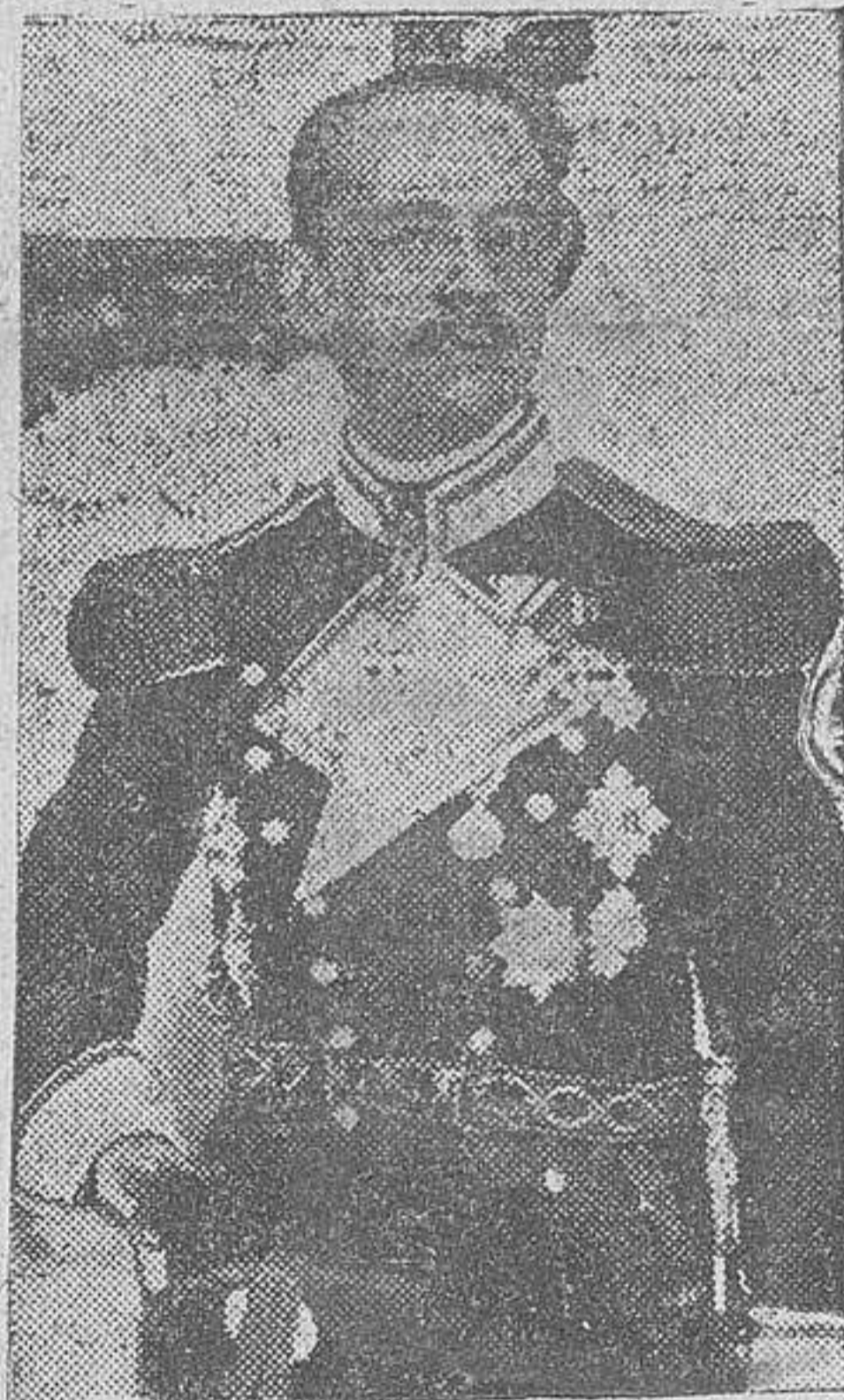
Ministro de Negocios Extranjeros del nuevo Gobierno húngaro, que es esperado en Berlín uno de estos días