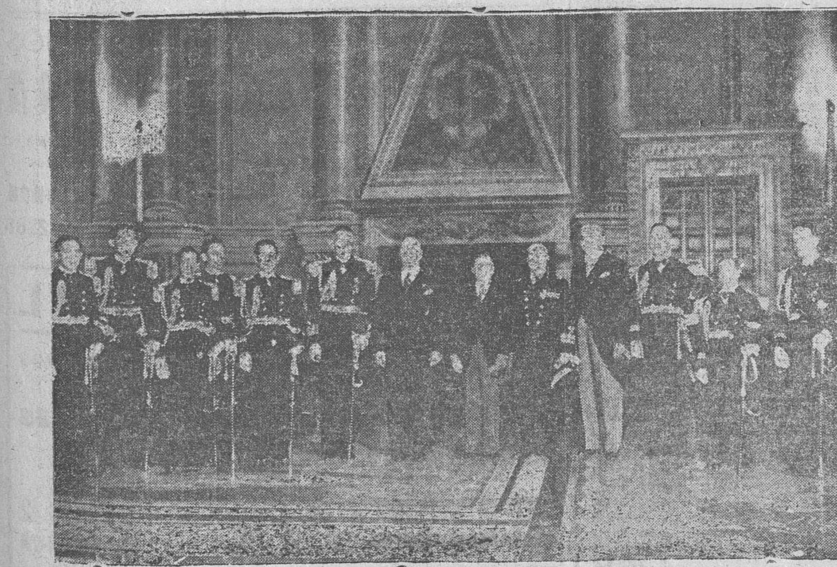
El Duce recibe en el Palacio Venecia la Misión Militar Venezolana

Y para terminar, vamos a recoger lo que dice el sentido periódico inglés "The Times": "Es incomprensible cómo el nuevo Ejército republicano, del que tanto se esperaba hace poco tiempo, está retrocediendo en desesperadas derrotas." Pero esto que no comprende el sentido "Times", nosotros se lo vamos a explicar: El Ejército republicano nunca ha sido potente; el Ejército de que alardeaba hace poco la propaganda marxista, el Ejército republicano, siempre ha sido un poco la carabina de Indalecio, mucho peor, indudablemente, que la carabina de Ambrosio.