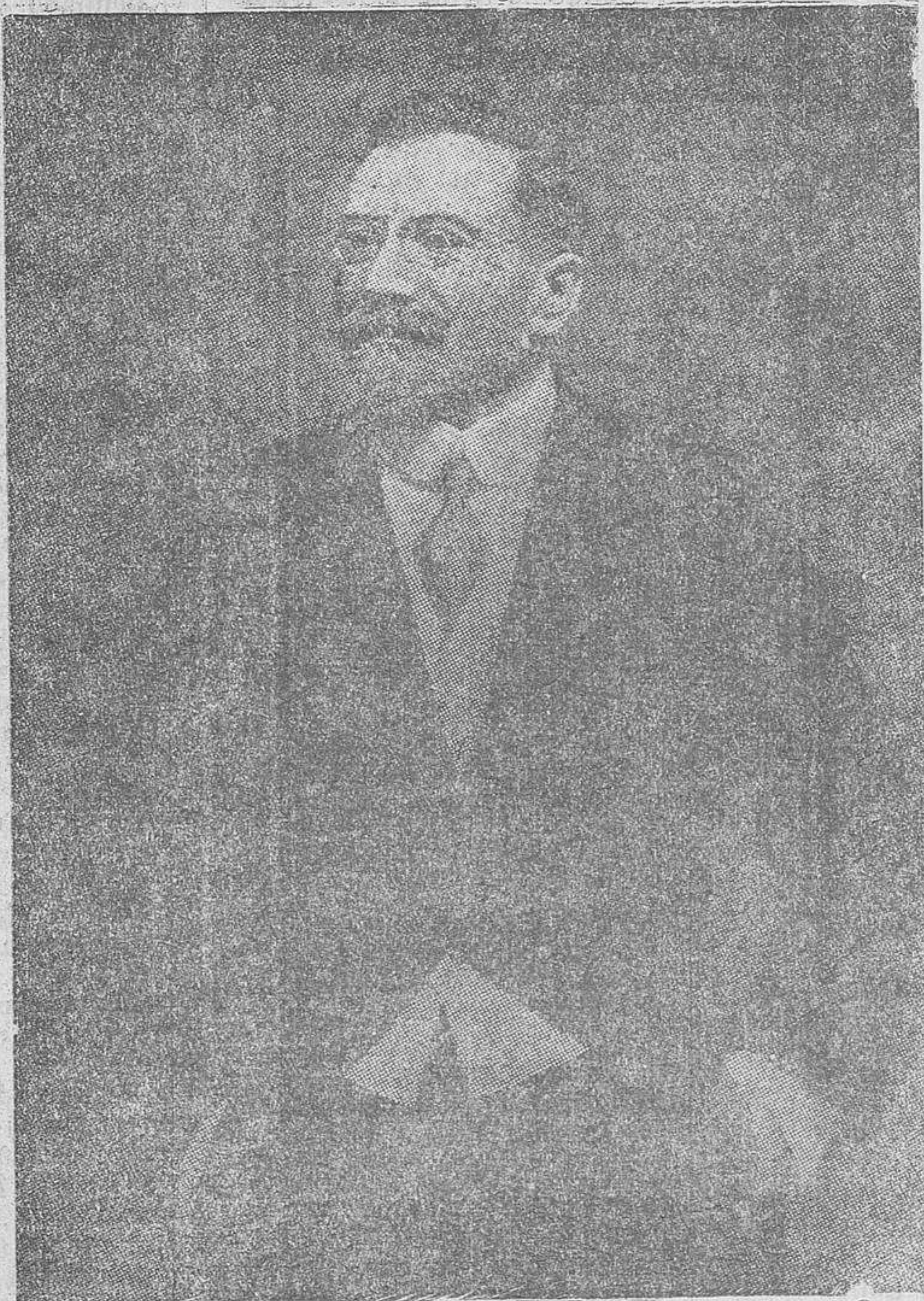
"Las ruinas humeantes de una sociedad deshecha aparecerán ante los ojos del creyente como un inmenso incensario, roto por la catástrofe, y que, en vez de haber levantado el humo como una plegaria al Dios de las misericordias, tiene que hacerlo, después de la tragedia sangrienta, como una ofrenda a su Justicia" (VAZQUEZ DE MELLA)