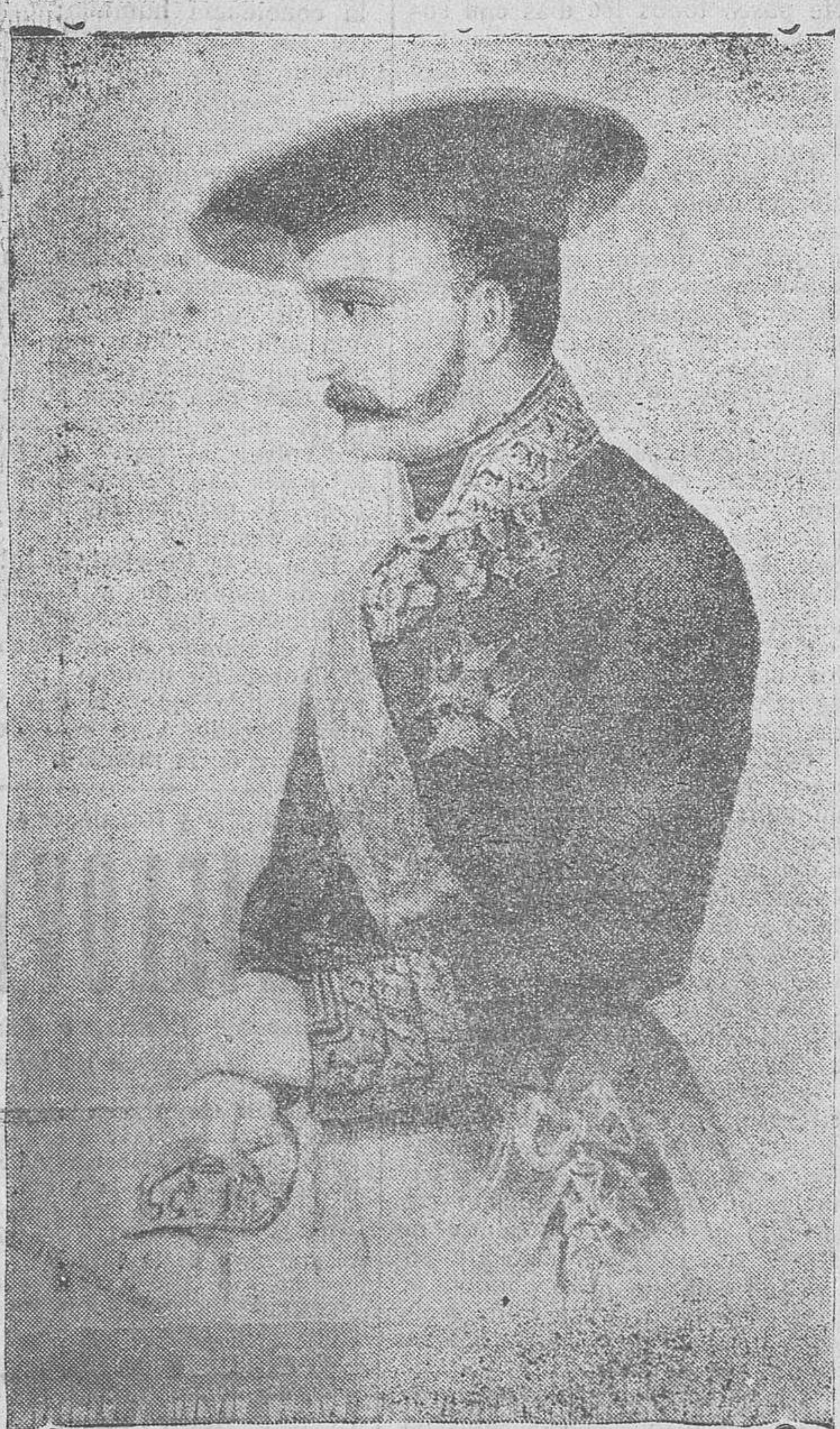
DON TOMAS ZUMALACARRÉ Cerebro y nervio de los Ejércitos Carlistas en el siglo XIX

La república puede, muy fácilmente y en muy poco tiempo, ser arrollada por la avalancha del comunismo internacional, destructor de la religión, de la patria, de la familia y de la propiedad. Si así fuera, lo juro, sacrificaría hasta la última gota de mi sangre en la lucha contra el comunismo antihumano, poniéndome al frente de todos los patriotas para oponerme a la implantación de una tiranía de origen extranjero (28 Abril 1931) [Palabras del manifiesto de don Jaime al proclamar la república.]