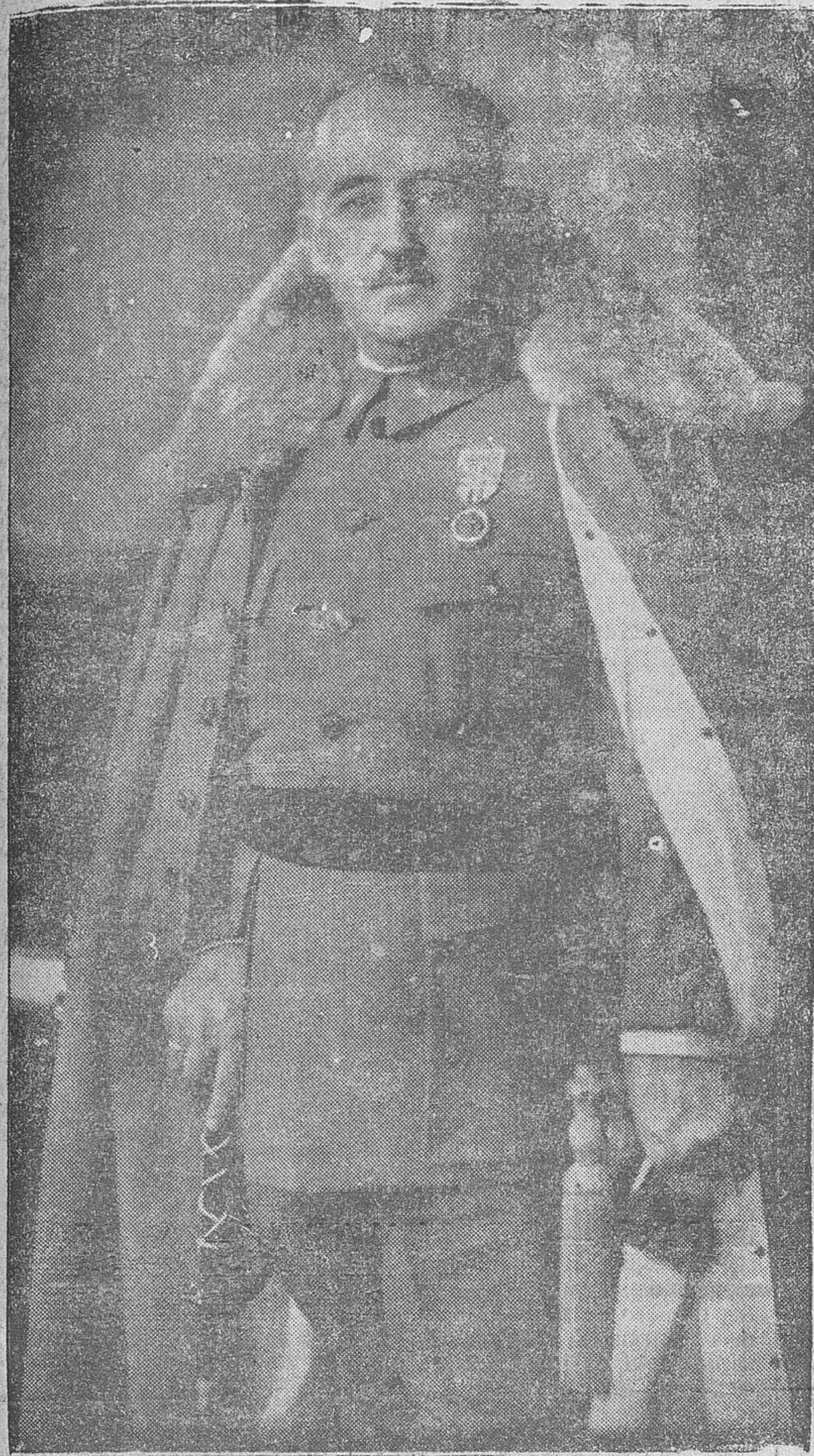
FRANCO, Jefe del Estado y Generalísimo de los Ejércitos, atiende a la vez, con su portentosa capacidad, a la dirección de la guerra y a la gobernación del Estado, al que él dió el ser. Su mano sabia, tranquila y firme, conduce al nuevo Estado hacia donde su cerebro y el país desean, por el camino imperial de nuestros destinos gloriosos

La producción española, en la hermandad de todos sus elementos, será una unidad que sirva a la fortaleza de la Patria y sostenga los instrumentos de su poder