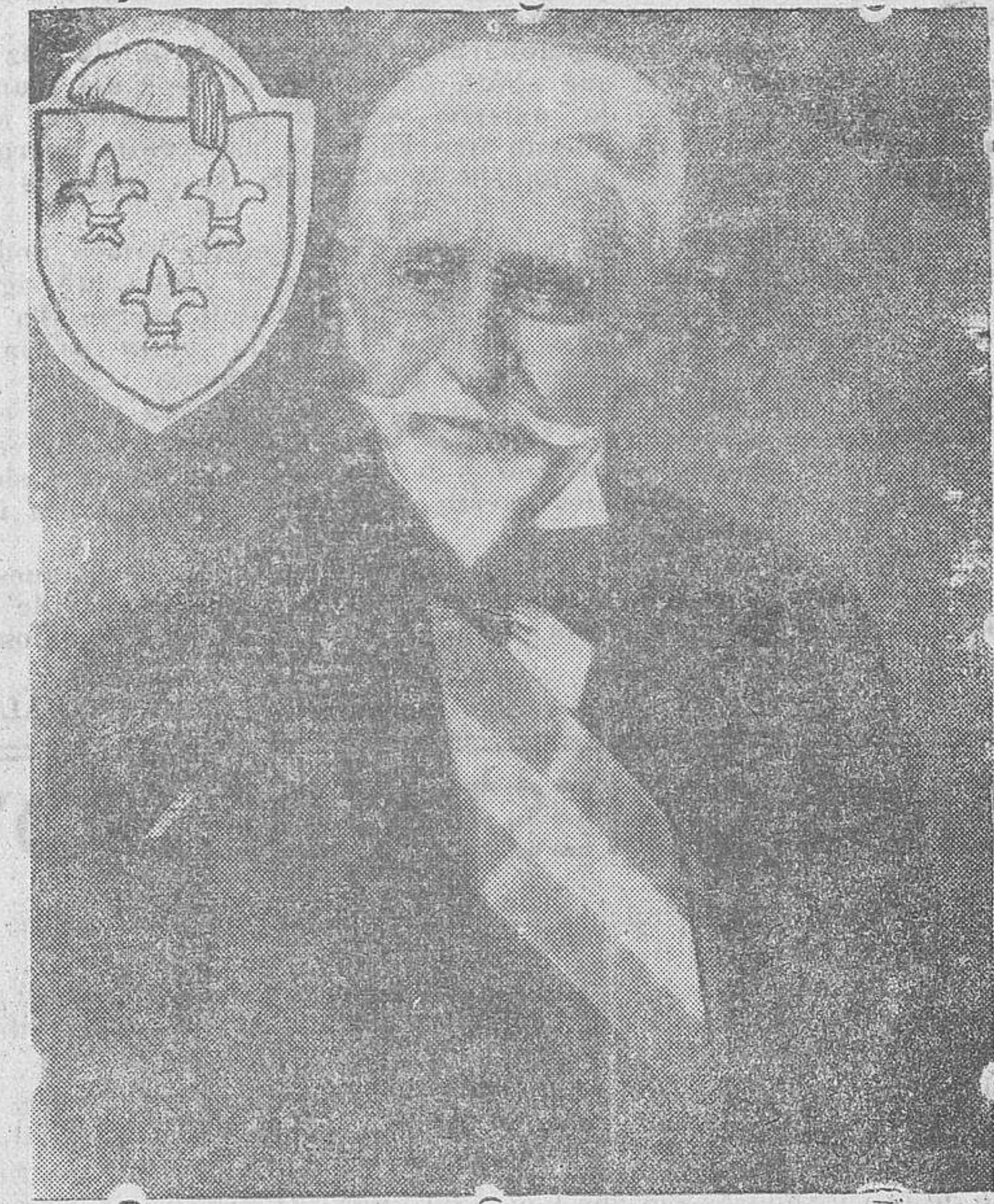
Don Alfonso Carlos de Borbón, General en Jefe de las tropas carlistas de Cataluña y Valencia, conquistador de Cuenca, quien en sus últimos días pudo presenciar los albores de este amanecer español