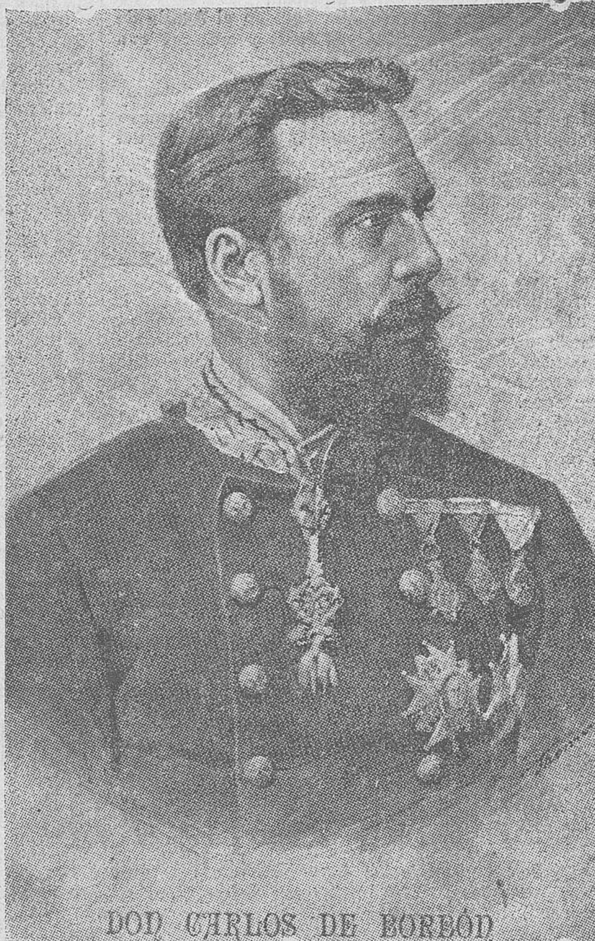
DON CARLOS DE BORBÓN

¡Cuántas veces encerrado en mi despacho en las largas horas de mi destierro, fijos los ojos en el estandarte de Carlos V, rodeado de otras cincuenta banderas tintas en sangre nobilísima, que representan el heroísmo de un gran pueblo, evoca la memoria de los que han caído bajo la bandera de Dios, Patria y Rey! Con este objeto de honrar su memoria propongo se instituya una fiesta nacional en honor de los mártires que desde el principio del siglo XIX han perecido en las cárceles, en el campo de batalla o en el destierro y designo para celebrarla el día 10 de Marzo de cada año, fecha en que se conmemora la muerte de mi abuelo Carlos V (Carlos VII en su carta al marqués de Cerralbo).