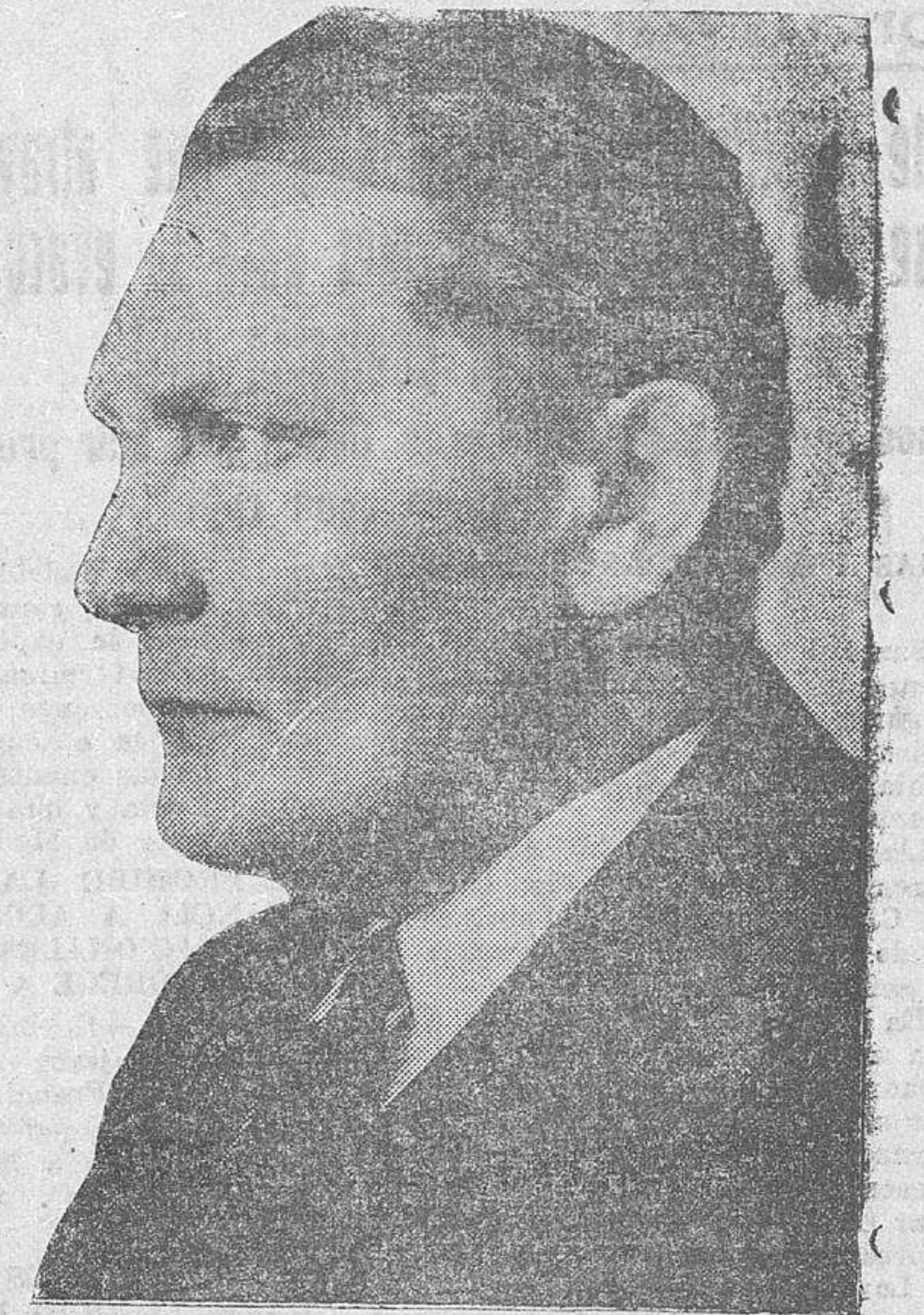
Fuehrer, Alfredo Rosenberg, igualmente en las primeras filas del partido nacionalsocialista desde los primeros días de su existencia.

También en el día de ayer ha celebrado su cumpleaños, cumpliendo los mismos que el general Goering, otro de los principales colaboradores del