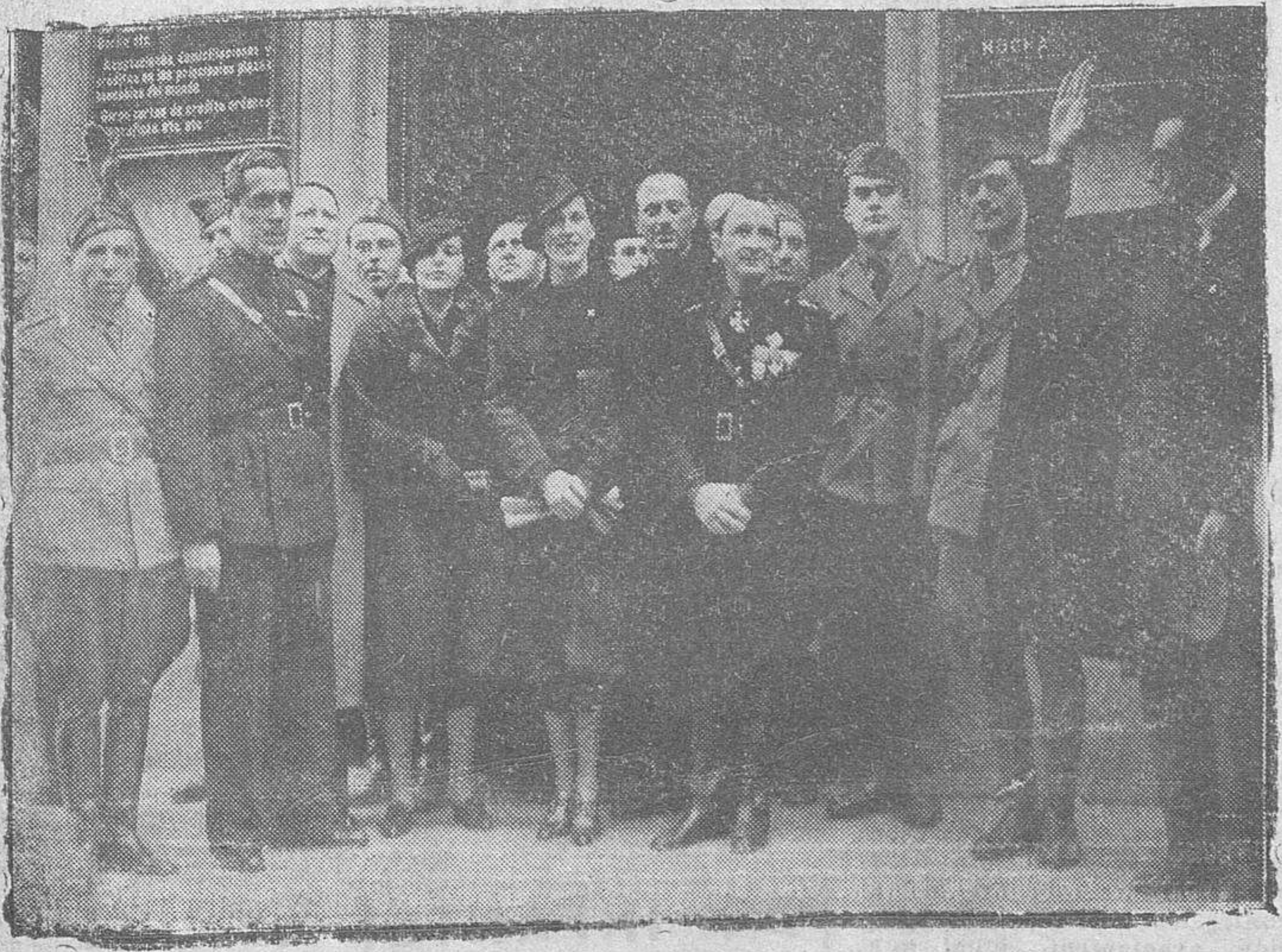
En ocasión del aniversario de la marcha sobre Roma, ha sido inaugurada la Casa del Fascio Italiano en Salamanca. He aquí a las autoridades delante de la nueva residencia

Es estúpida esa intención—digna de cerebros alucinados por el terror—que nos basta con denunciarla a la opinión pública, para, sin argumentos en su contra, por parte nuestra, aplastarla y cerrarle el camino de sus tristes deseos. La España Nacional conoce el hondo afecto de su hermana y vecina, el ansia con que sigue su gesta heroica y sólo puede pagarle con el mismo amor fraternal y duradero. La España de Franco quiere ser Una, Grande y Libre; pero UNA en la unidad histórica, la de Isabel y Fernando; GRANDE, pero con su augusta grandeza interior de raza y espíritu hispano; LIBRE de todo yugo y con respeto para la libertad de los pueblos todos y especialmente de aquellos que, como Portugal, son dignos de los más altos destinos históricos y están gobernados por cerebros y corazones cuyas ideas y sentimientos son hermanos gemelos de los nuestros.