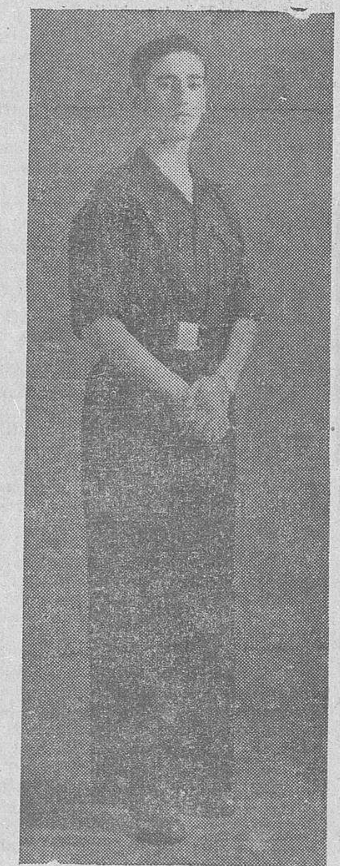
Uno de los intérpretes de "Forjadores de España", que se estrenará hoy en el Liceo