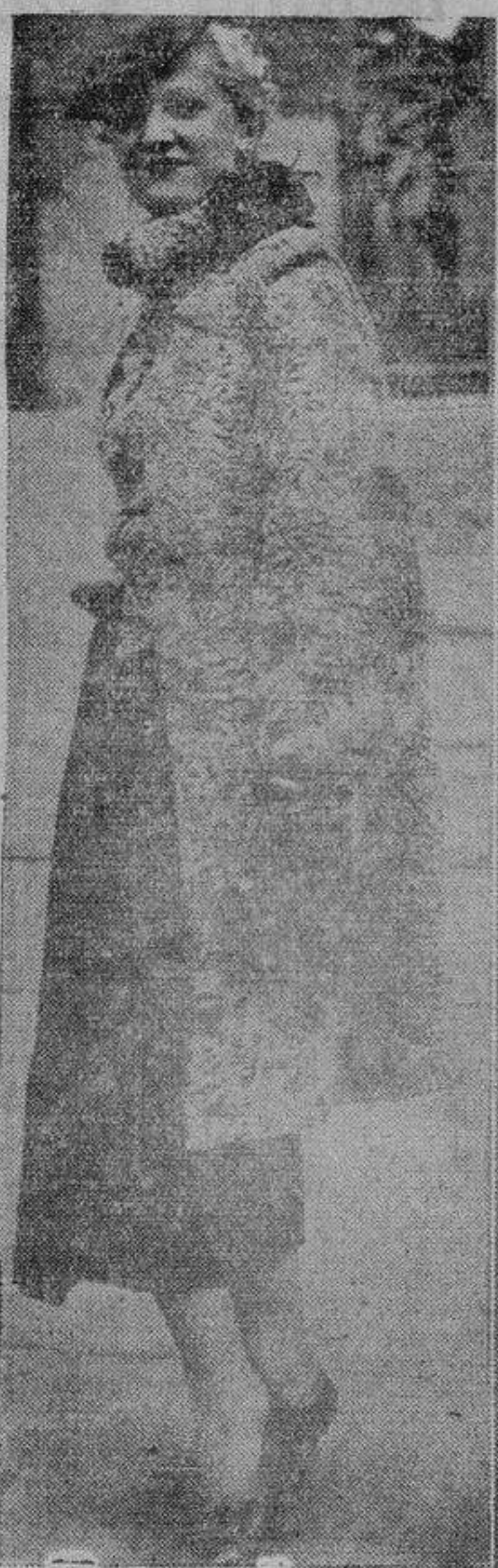
Larga chaqueta con chaleco de «agneau rasé» gris. Falda y blusa negras

Una nota característica de la moda actual es la combinación de telidos diversos en un mismo modelo. Así, por ejemplo, se combina el bordado inglés so-