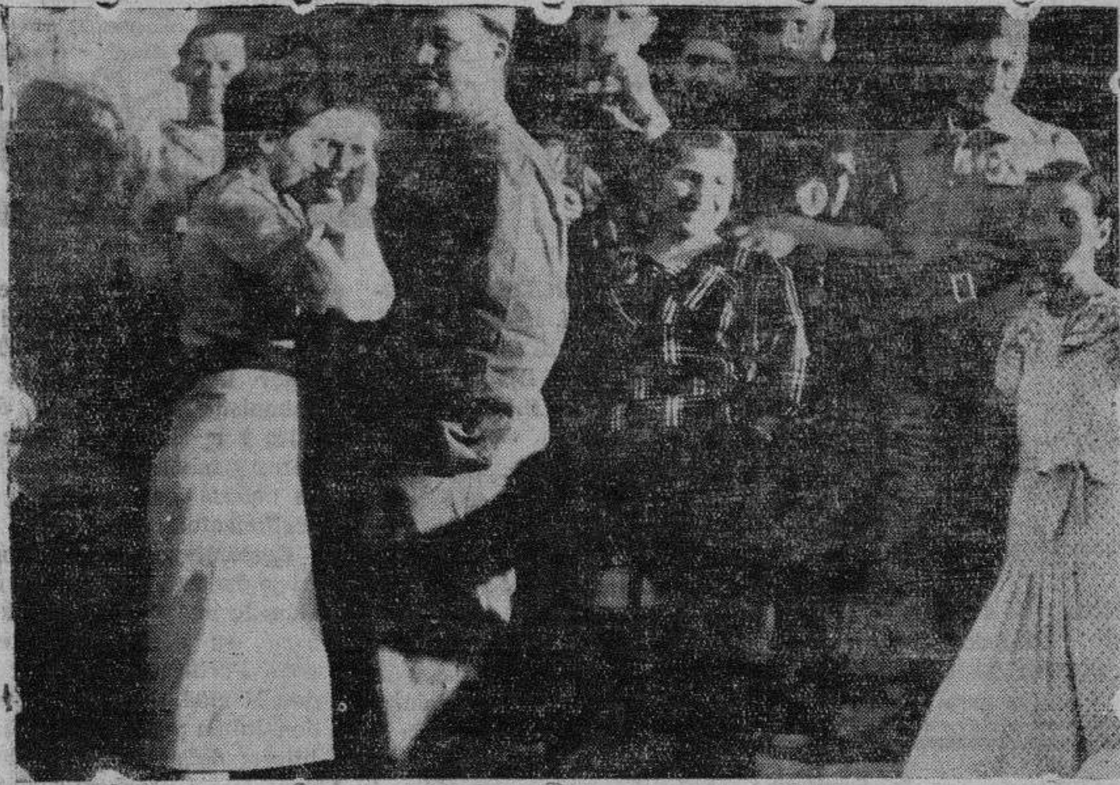
Una señorita imponiendo una medalla a un oficial que salió ayer al frente.