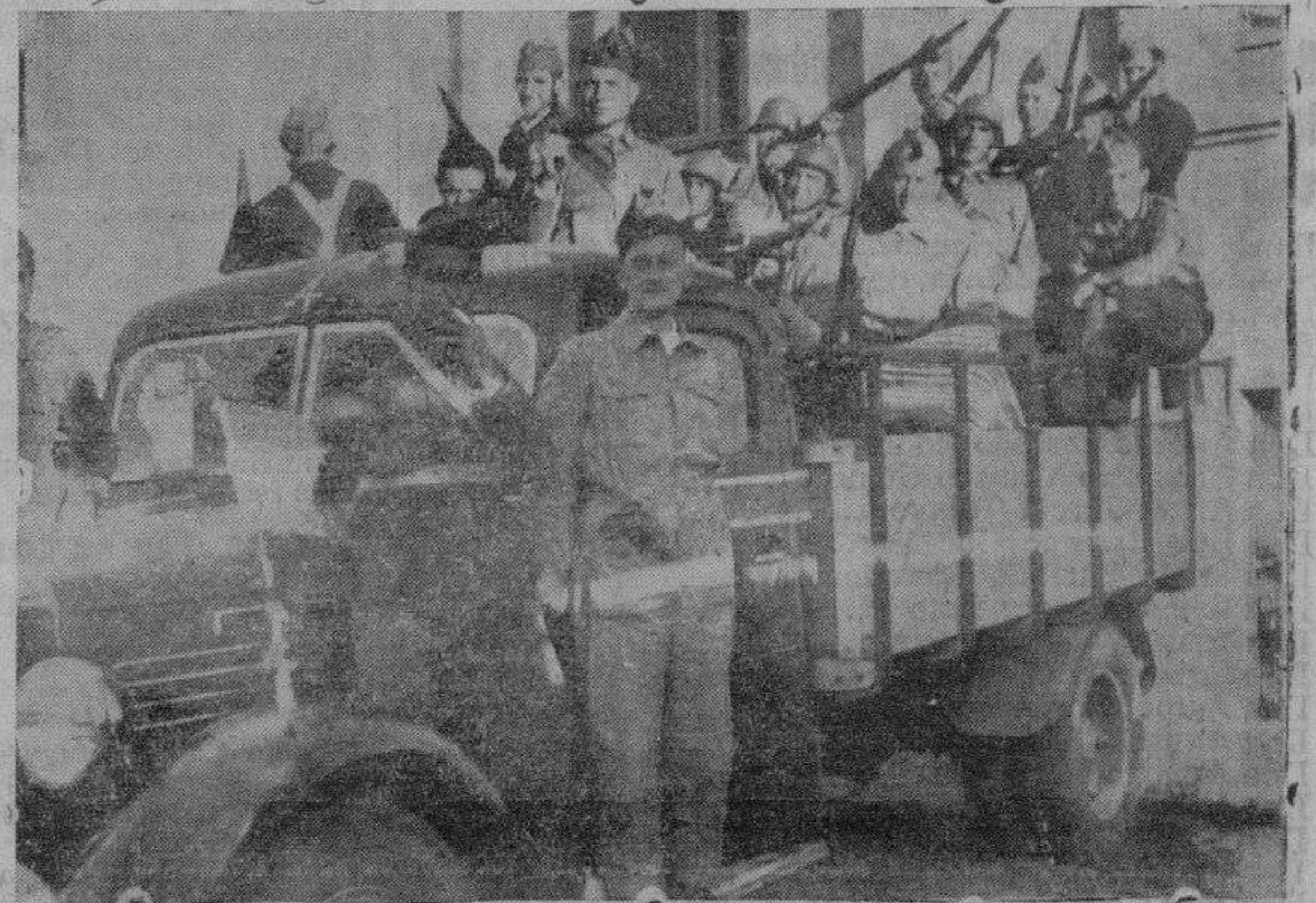
Una camioneta llena de soldados, dispuestos para marchar al frente.

Y hacedlo pronto, dando cada uno ejemplo vivo de cómo se