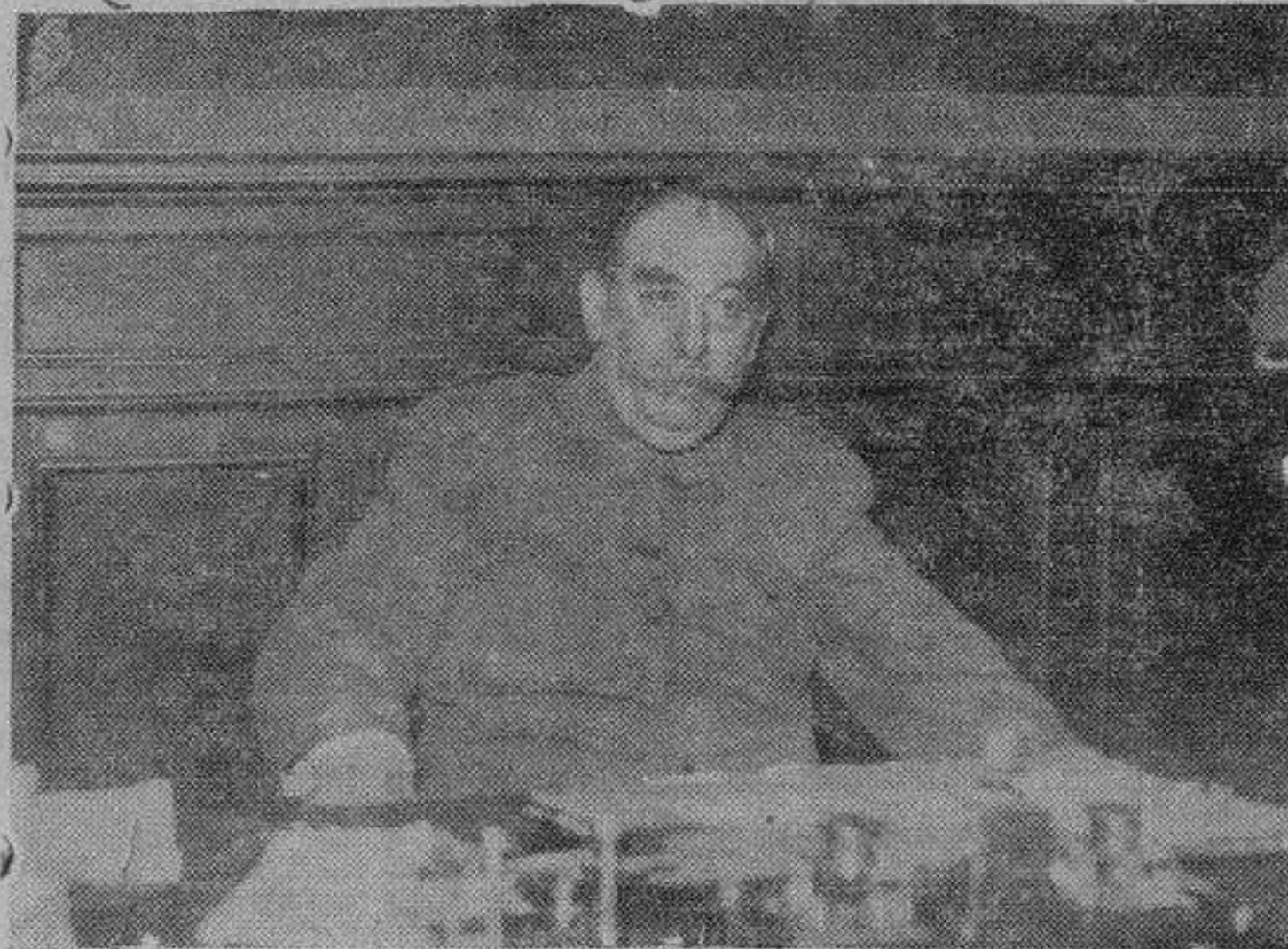
El Excelentísimo señor don Andrés Saliquet, Jefe de la Séptima División