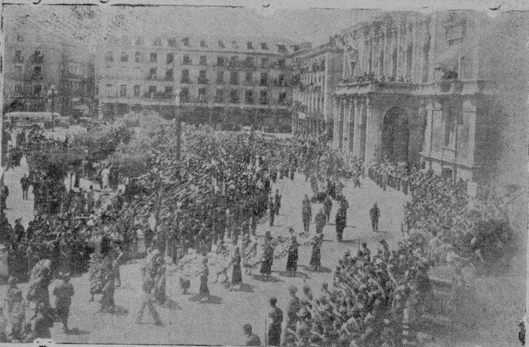
VALLADOLID.—El entierro del jefe regional de Falange Española, Onésimo Redondo, a su paso por la Plaza Mayor

Los pueblos castellanos han vuelto también a su normalidad. Y en ellos se puede respirar y vivir. La realidad es que esa vida de hoy ha de ser más intensa y mejor cada día.