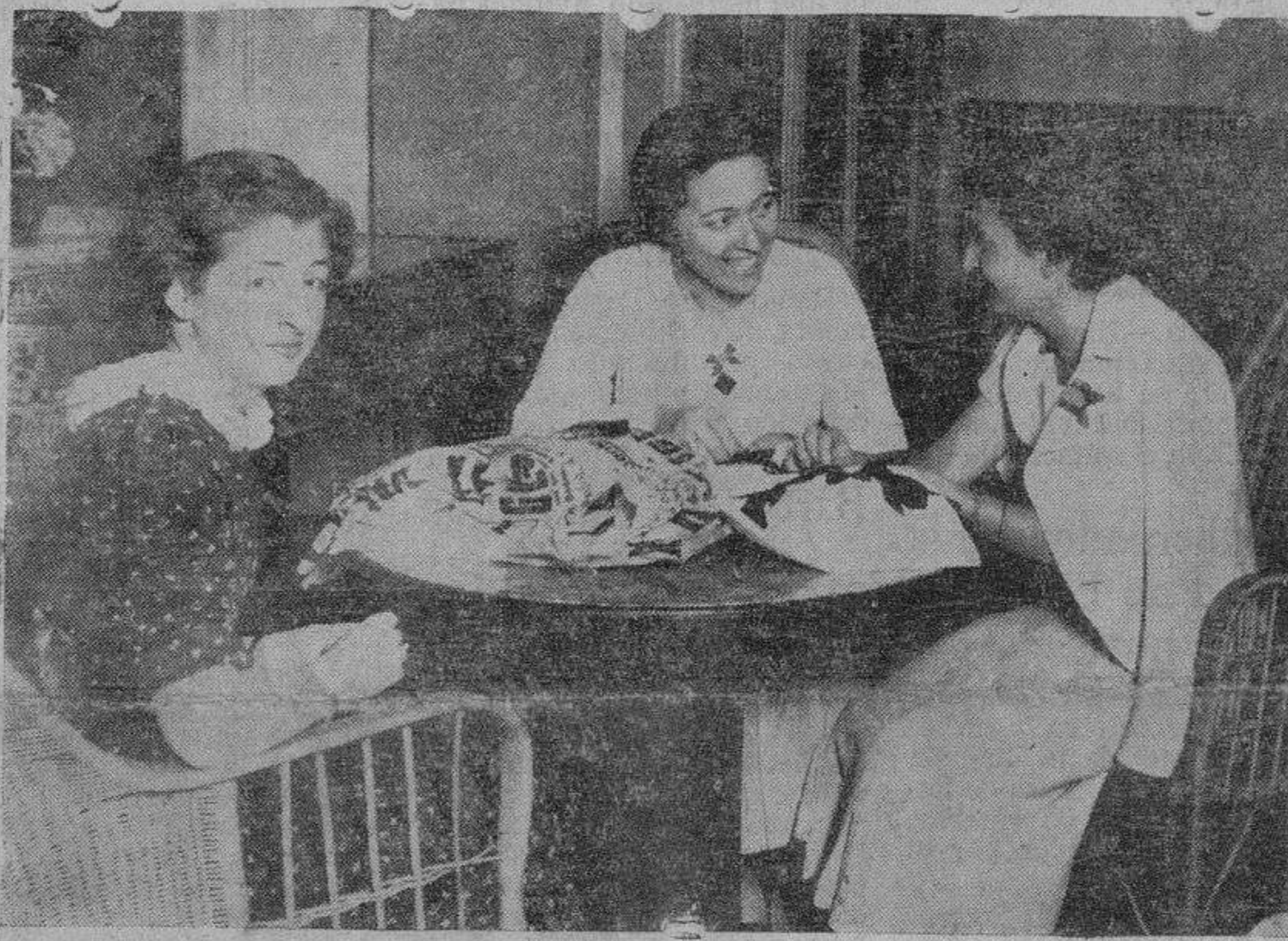
Distinguidas señoritas que se dedican a pedir donativos para la institución de la Cruz Roja Foto Almaraz.