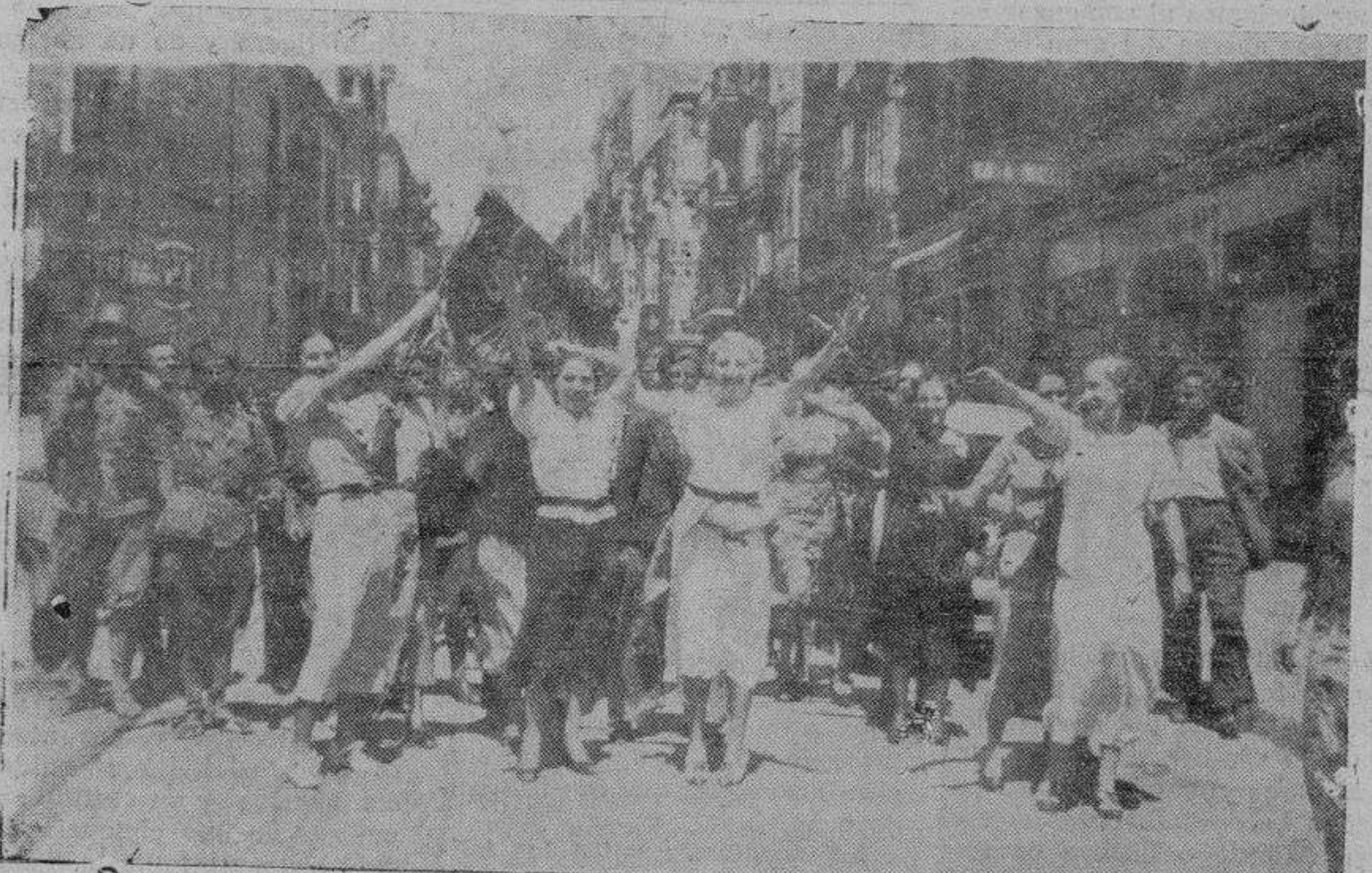
VALLADOLID.—Alegría popular por el éxito de las tropas

Los paréntesis en la vida normal cotidiana, corresponden a las radios puestas al servicio de España, y que papel tan importante desempeñan en estas circunstancias. Las emisoras de Burgos, de Valladolid, de Salamanca y todas las demás con ellas conectadas, propor-