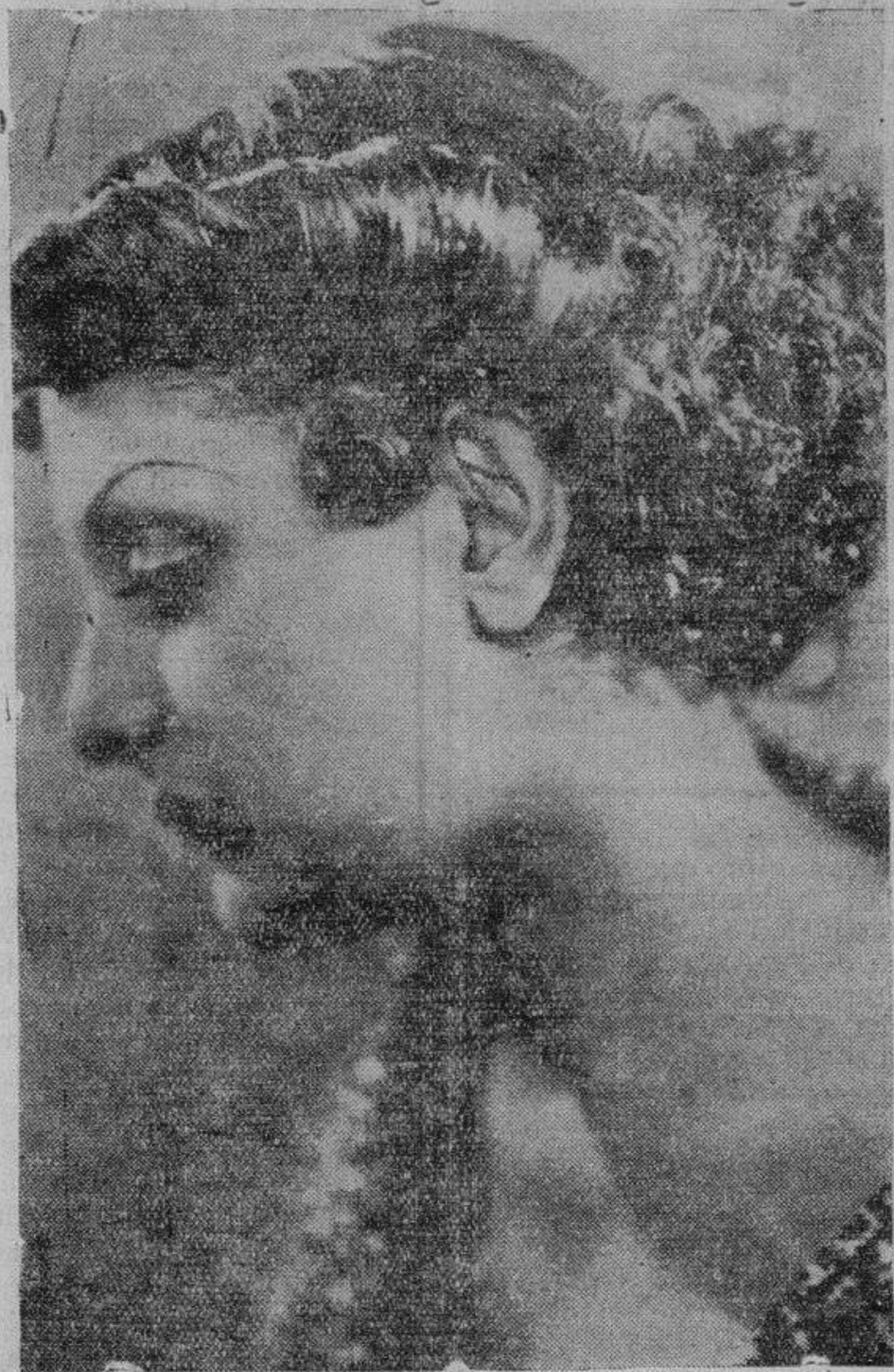
Nuevo modelo de peinado para la noche, creado por el maestro parisiense Desfossé