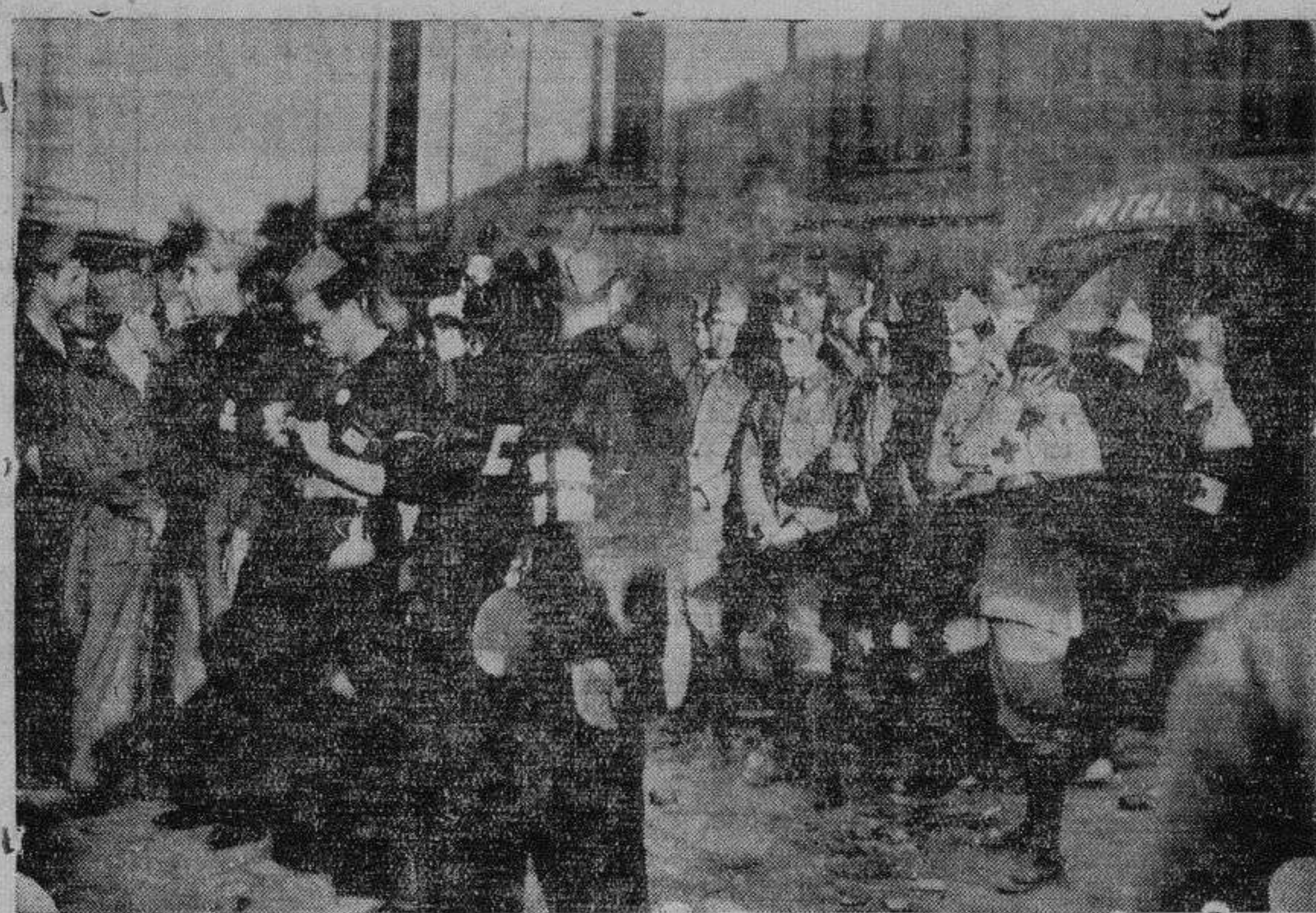
Soldados de la Cruz Roja preparados para salir a prestar servicio.

En el Sur, es oficial que las columnas avanzan con alguna lentitud en pequeños núcleos, que van sometidos a los grandes pueblos de Andalucía. Algunos de los cuales que se resisten, son sofocados por las fuerzas de África sin que hayan tenido el menor fracaso. Además, en los primeros momentos el Gobierno militar no quiso proceder a mandar grandes núcleos de fuerzas de África, ante el temor de que algún barco fuera bombardeado por elementos de la Escuadra que no se han sumado al movimiento, pero el bombardeo eficaz de la aviación sobre alguna