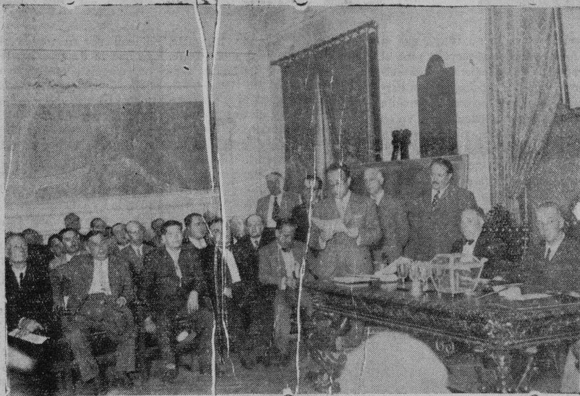
En el Colegio de Médicos, de Madrid, se ha celebrado una Asamblea para tratar de asuntos de interés para la clase. Asistieron representantes de toda España en número de trescientos. Un momento del acto