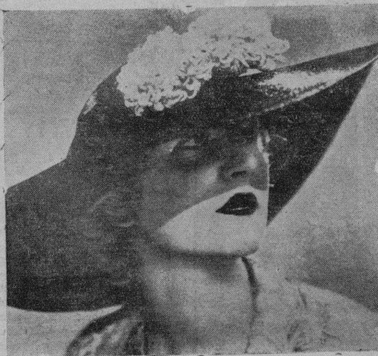
Capelina de paja barnizada, de color negro, guarnecida con dos crisantemos blancos y cinta de terciopelo