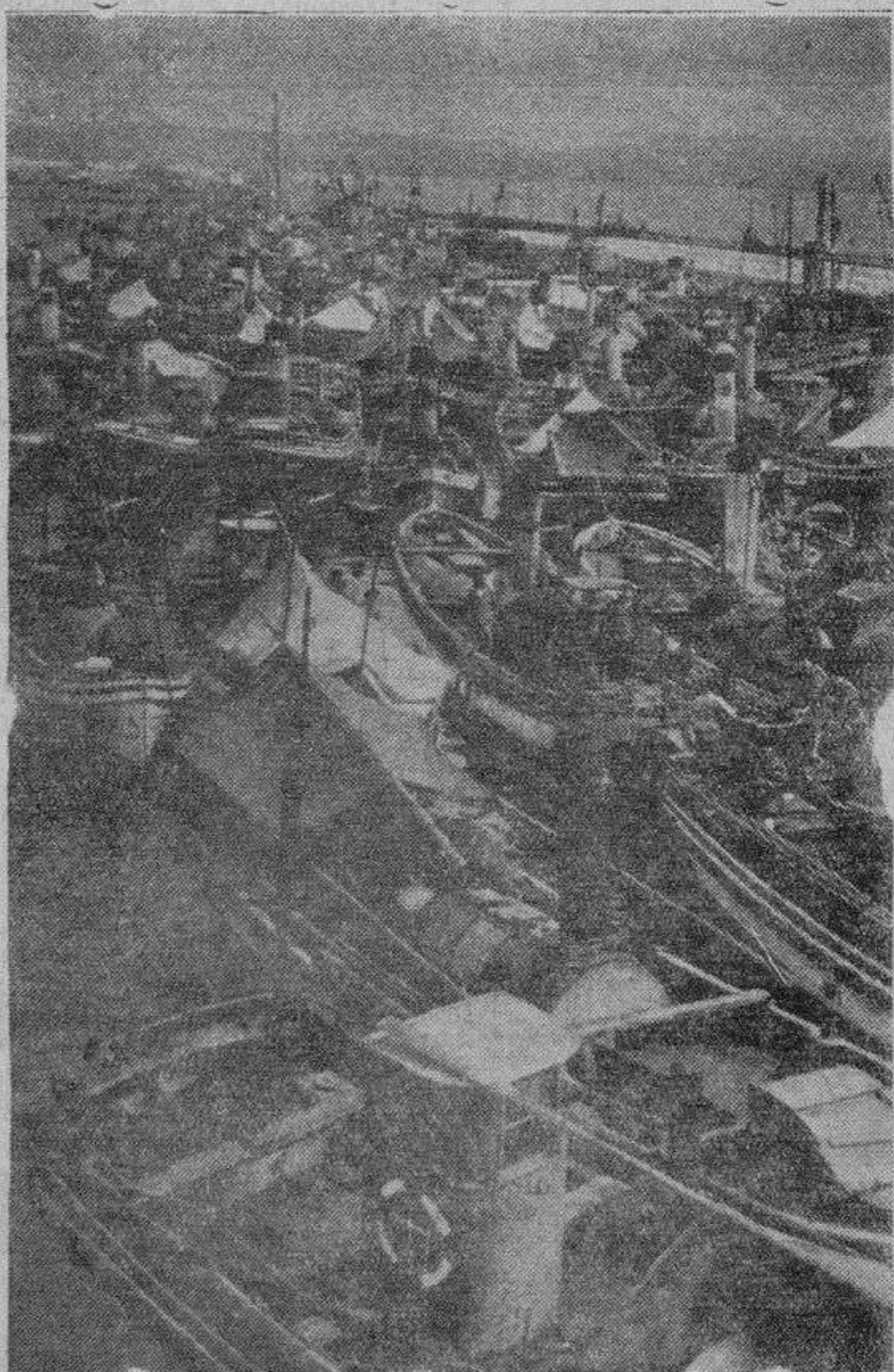
Un aspecto del Puerto Chico, en Santander, repleto de barcos pesqueros, al que pertenecen varias de las embarcaciones que se hallaban en alta mar al producirse la galerna de la madrugada del jueves, y cuya suerte se desconoce