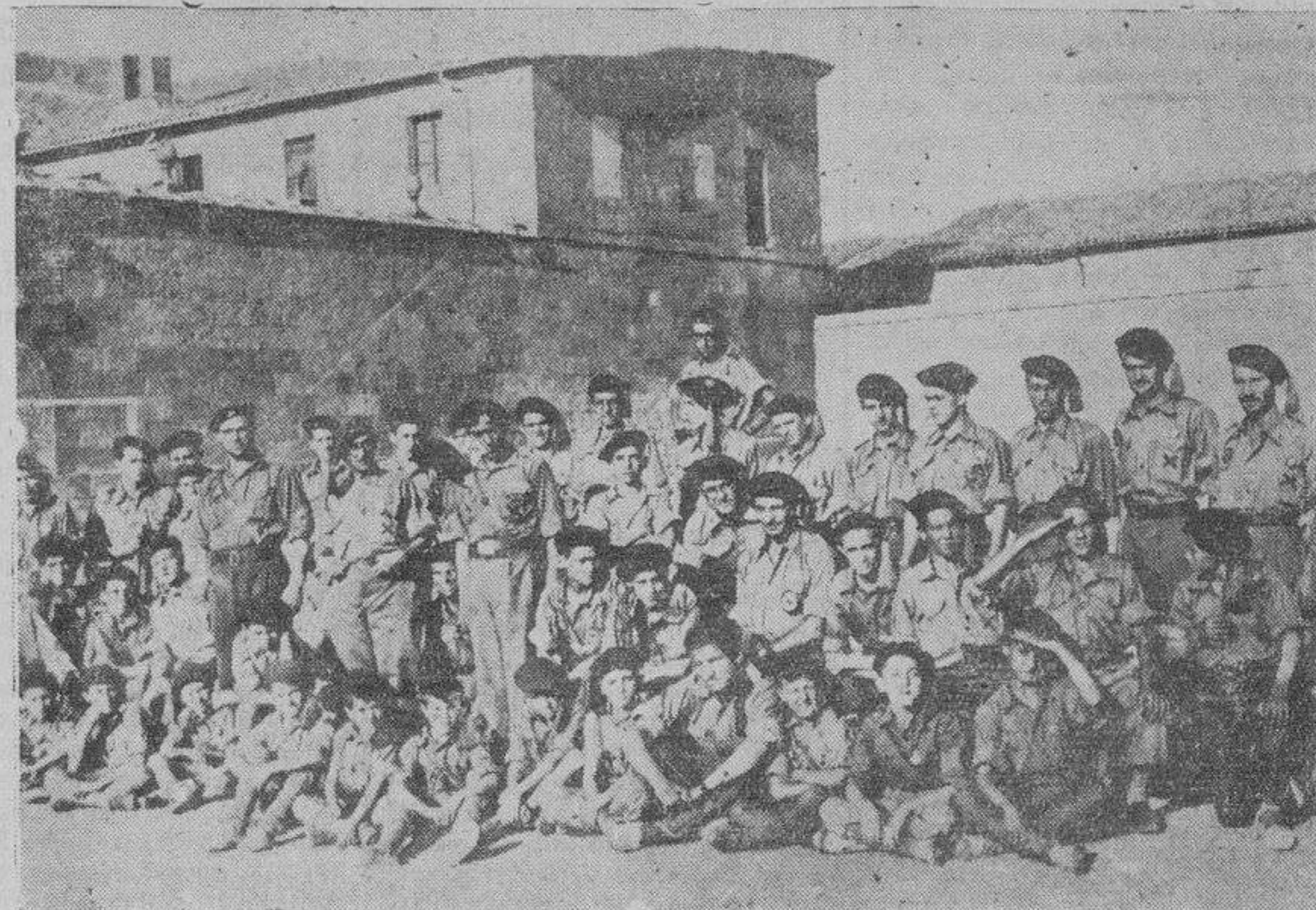
Un grupo de Requetés salmantinos