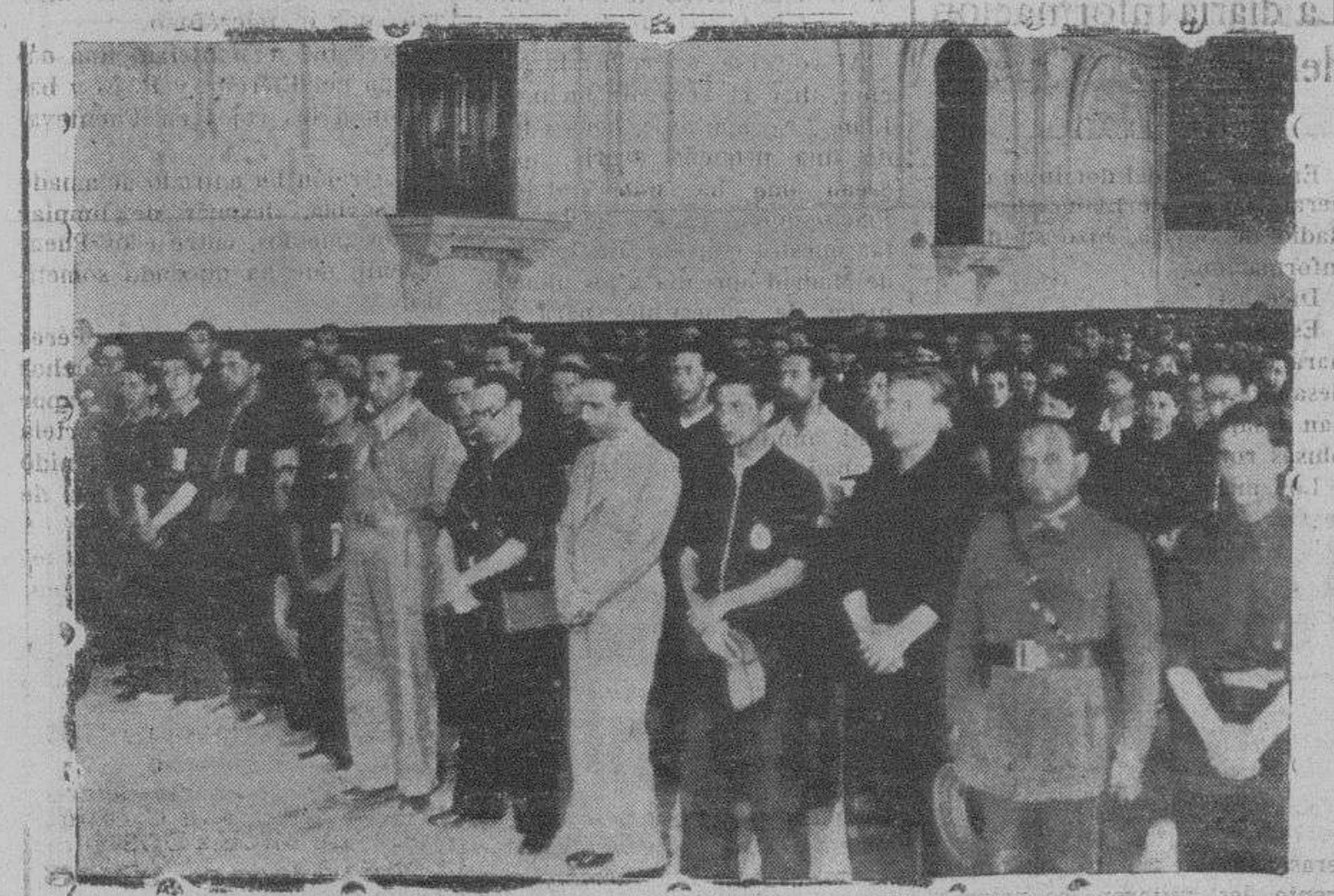
La presidencia del acto religioso celebrado el domingo por los fascistas

En el cuartel de Falange Española de las J. O. N. S., el domingo, a las nueve y media de la mañana, se celebró una solemne misa, a la que concurrieron numerosas representaciones de Falange, de la oficialidad del Ejército de la Sección Femenina de Falange y más de 600 falangistas.