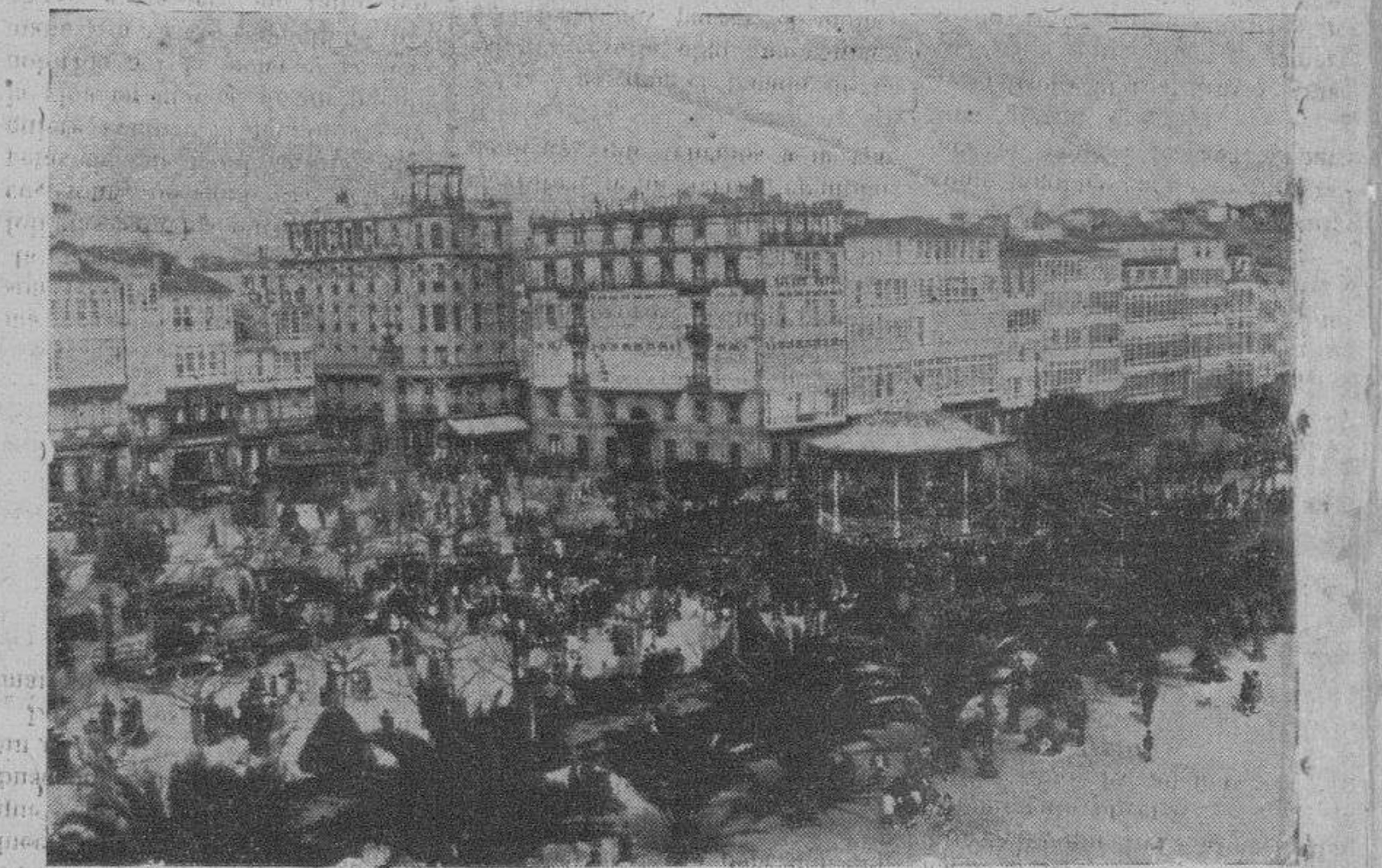
El paseo de Méndez Núñez, en La Coruña

Tanto la draga como el buque, que con su largo tubo lanzan el fango al ensanche del puerto a fin de ganar terrenos al mar, deben tener mucho trabajo. Ya que el paseo y hasta las casas modernas de la marina están cimentadas sobre este suelo artificial, lo que ha contribuido no sólo a que el oleaje sea menos fuerte, sino a que el recio vendaval encuentre en los casi-