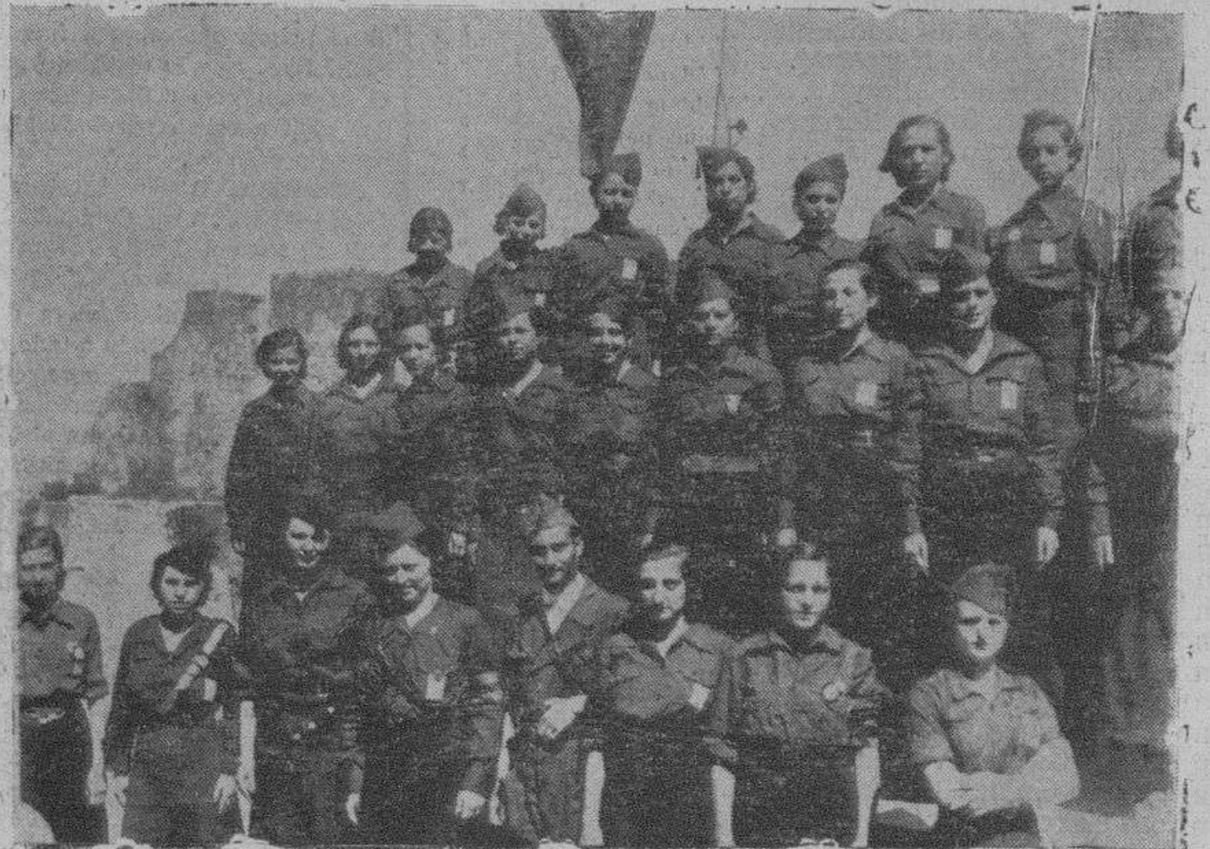
Un grupo de señoritas fascistas uniformadas