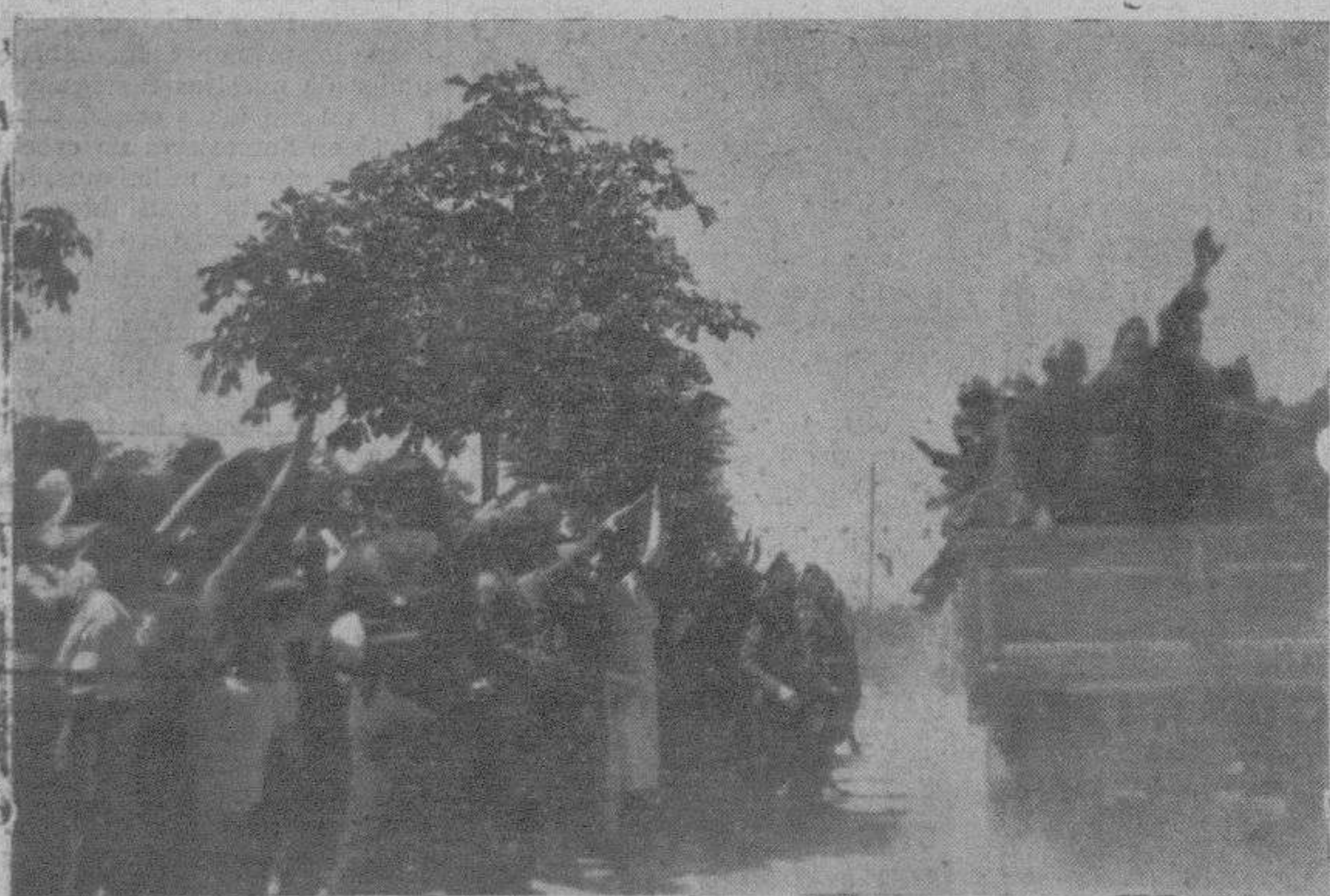
Momento de salir la columna de tropas del Ejército y de Falange Española con dirección al frente de Guadarrama