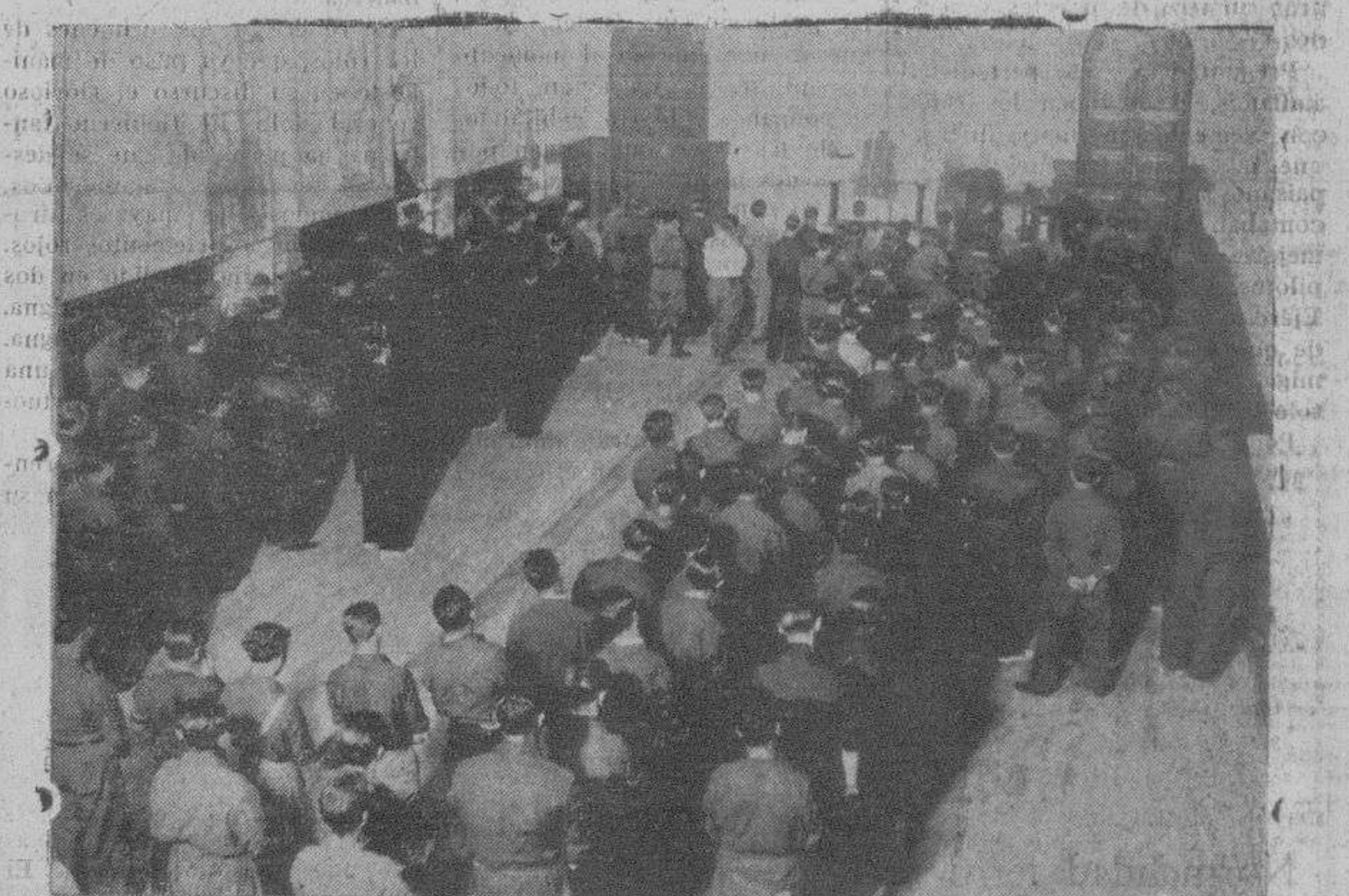
Aspecto que ofrecía la iglesia del antiguo Noviciado de los Jesuitas durante la misa celebrada con asistencia de los miembros de Falange Española

Solemnes Cultos que la Comunidad de Siervos de María (Mistérios de los Enfermos) dedica en su iglesia de San Millán a su Excelsa Patrona la Santísima Virgen en el Misterio glorioso de su Ascensión a los Cielos desde el día 8 de agosto de 1936. Todos los días habrá misas re-