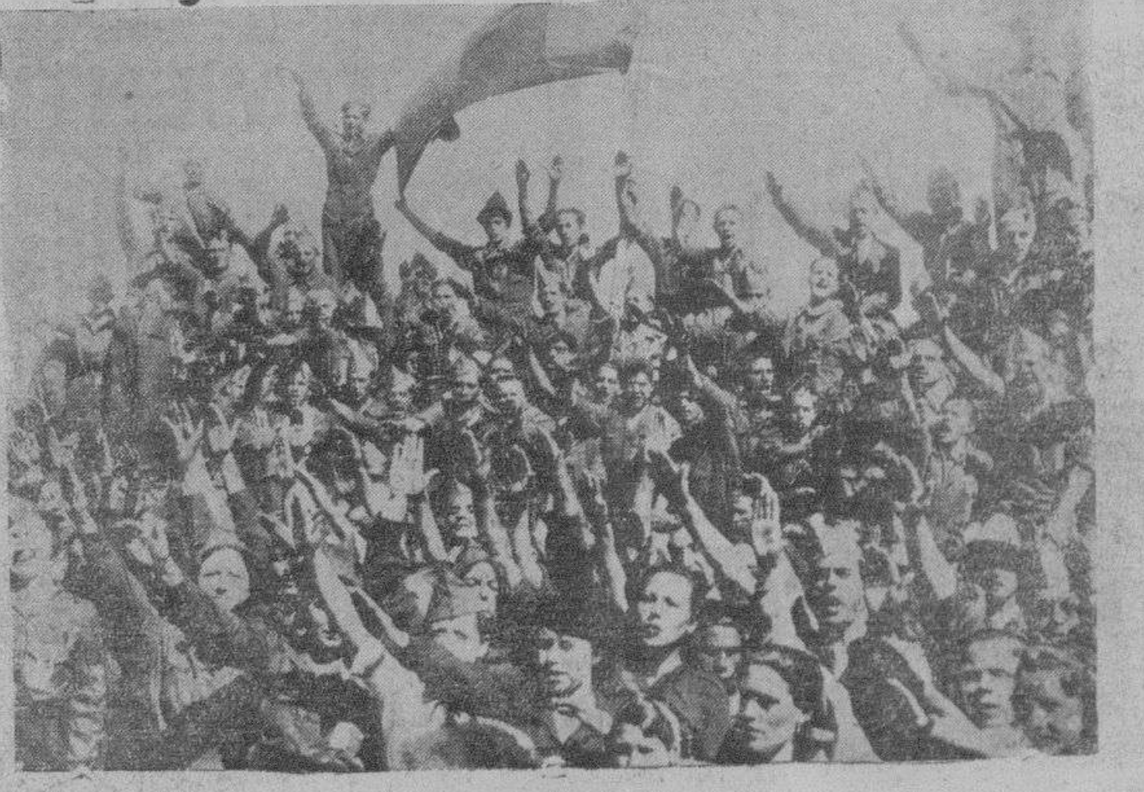
Grupo de fascistas, entonando el Himno de Falange, después de terminar el sacrificio de la misa para celebrar la fiesta religiosa del domingo