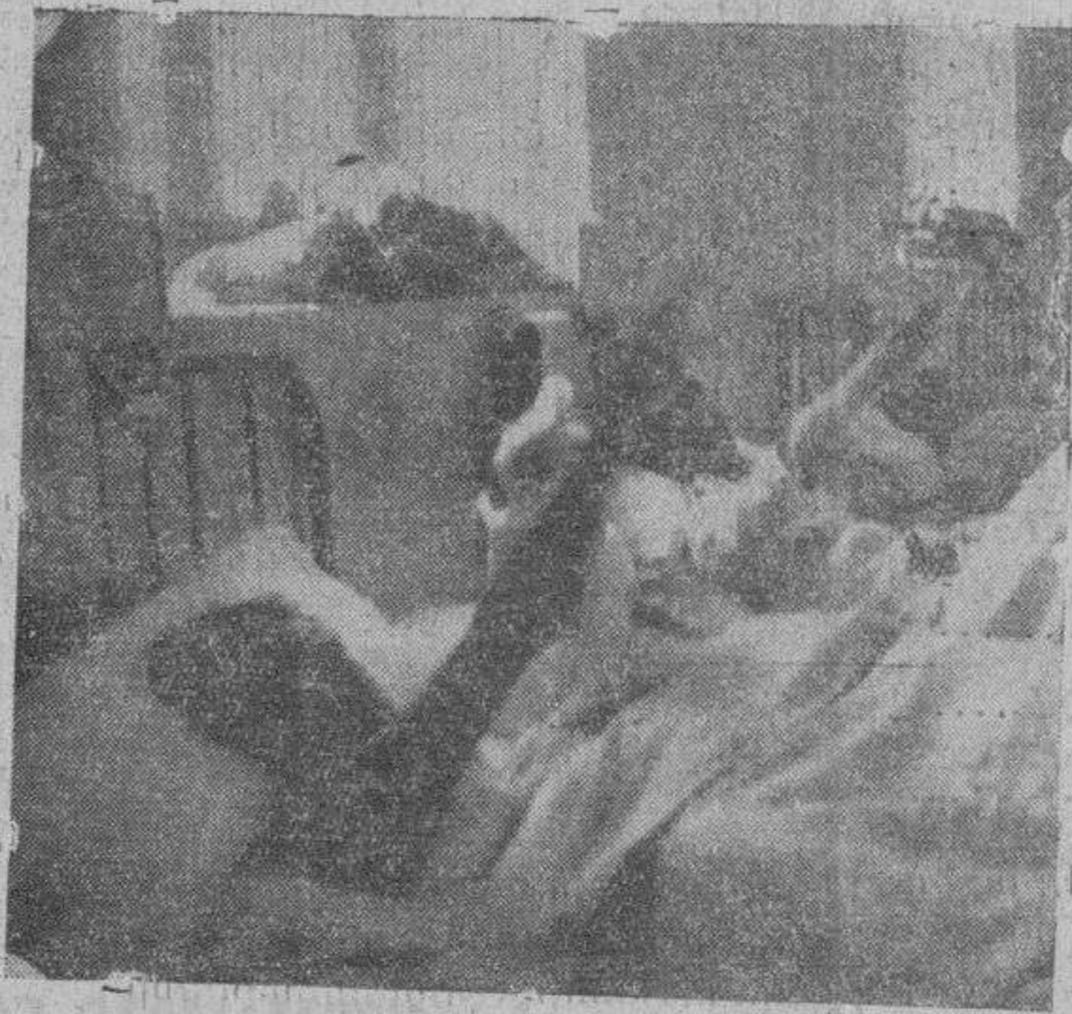
Algunos falangistas hospitalizados en Avila sonríen y extienden el brazo en saludo a los lectores de EL ADELANTO.

niones de la campaña, y todos coinciden en que no hay enemigo serio enfrente. El peor enemigo que tenemos es nuestra hidalguía y caballerosidad, de cuyos factores morales se valen las milicias a sueldo de Moscú para levantar bandera blanca, en la seguridad de que avanzaremos en son de paz, y recibiremos con fuego de ametralladora. De esos traidores todo se puede