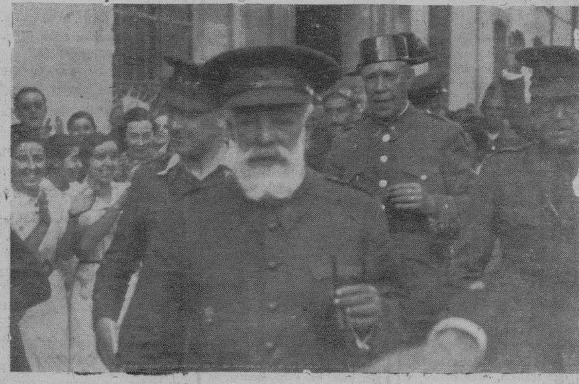
El presidente de la Junta de Defensa Nacional, excelentísimo señor don Miguel Cabanellas, a su paso por las calles de Zamora, durante su estancia en la vecina capital.