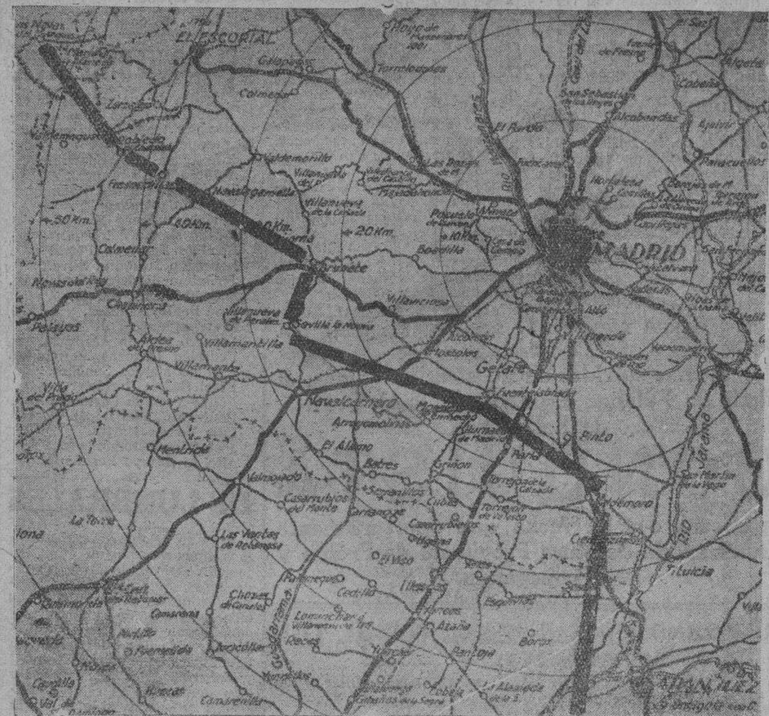
En su arrollador avance hacia Madrid, nuestras victoriosas fuerzas se encontraban el domingo en la posición indicada en el presente gráfico

cia de las autoridades, que se publicarán listas negras de los malos patriotas que, debiendo hacerlo, según su modo normal de vida, no contribuyan a esta empresa nacional, llegándose en casos notorios a la imposición de multas que compensen con exceso las cantidades con que hayan dejado de contribuir.