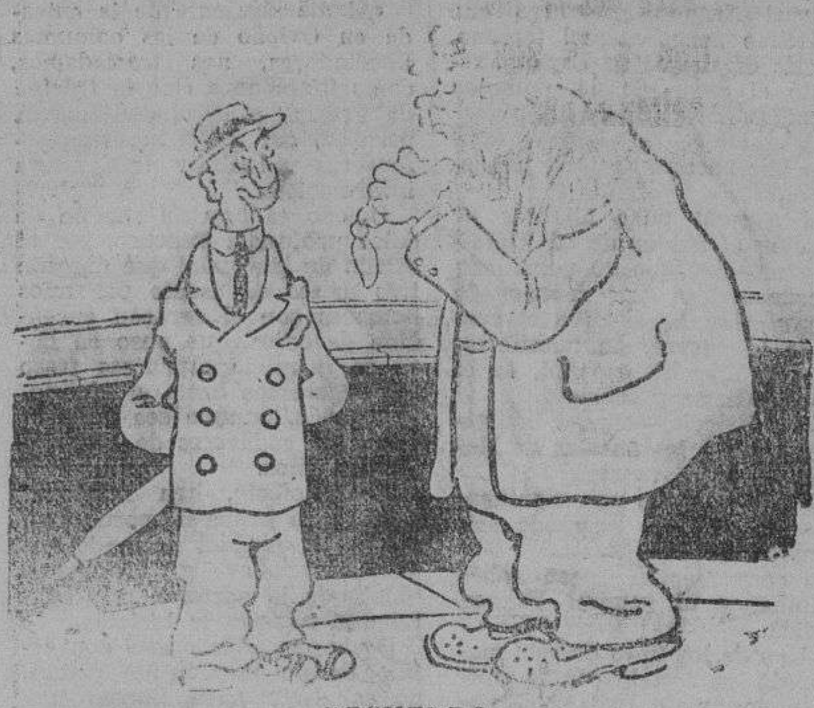
RECUERDO —Para qué llevas el mudo en el pañuelo? —Para no olvidar de entrar al correo una carta de mi mujer. —¿Y te sirvió de algo? —De nada, porque fué a mi mujer a la que se le olvidó el dermeita. (Grand-Soir)

Porque, aunque digan lo contrario los cabezallas rebeldes, Madrid es su fin. Madrid tendrá