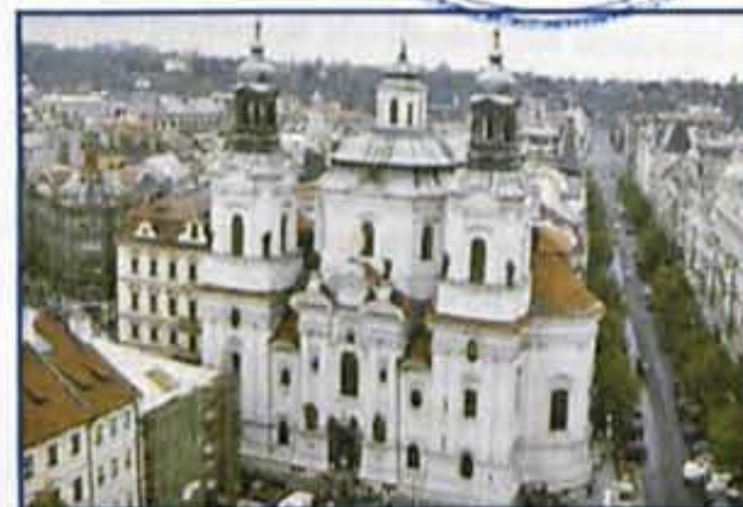
ESPLENDOR DE BOHEMIA BARROCA