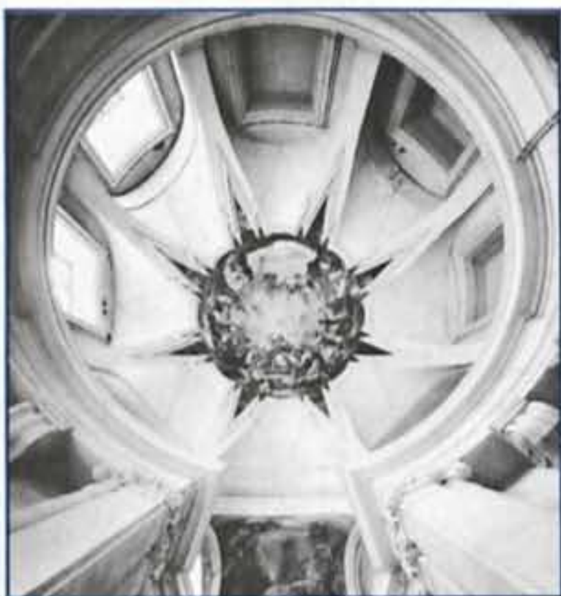
ARTE Y LITERATURA EN LA PRAGA BARROCA