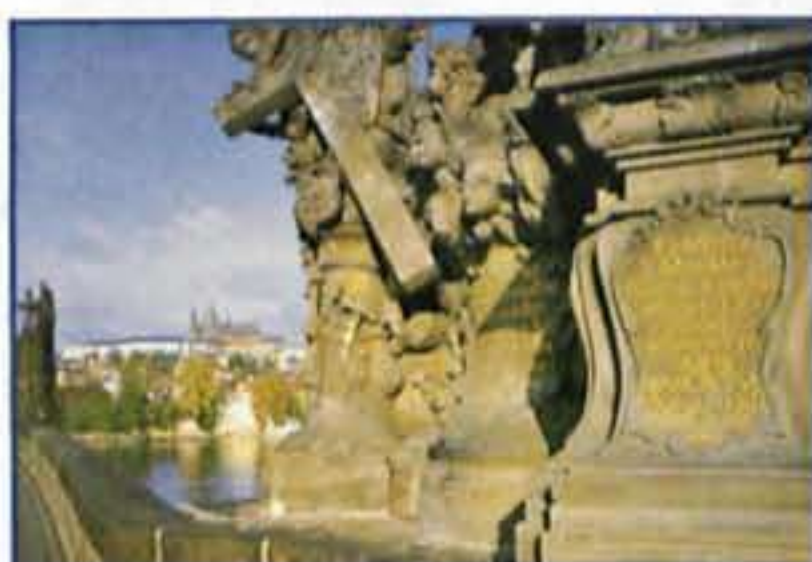
JOYAS DE LA ARQUITECTURA BARROCA CHECA