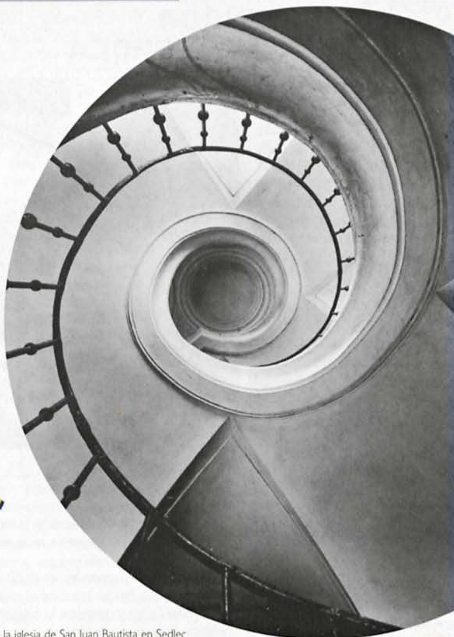
Escalera de la iglesia de San Juan Bautista en Sedlec Obra de Jan Blazej Santini-Aichel, 1703-1709.