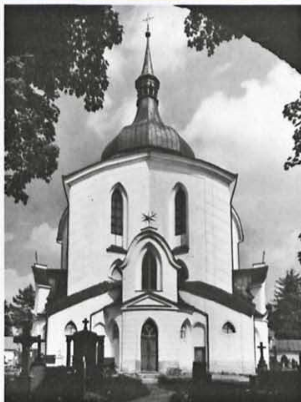
Iglesia de peregrinación de San Juan Nepomuceno en Zelená Hora, junto a Zdar nad Sázavou. Obra de Santini-Aichel, 1719-1722.

- Los triunfos barrocos recogerá en la Pinacoteca del Castillo de Praga todo lo relativo a la fe, la religiosidad y la iglesia barroca, a través de cuadros, escultura y orfebrería. Las relaciones de Bohemia con