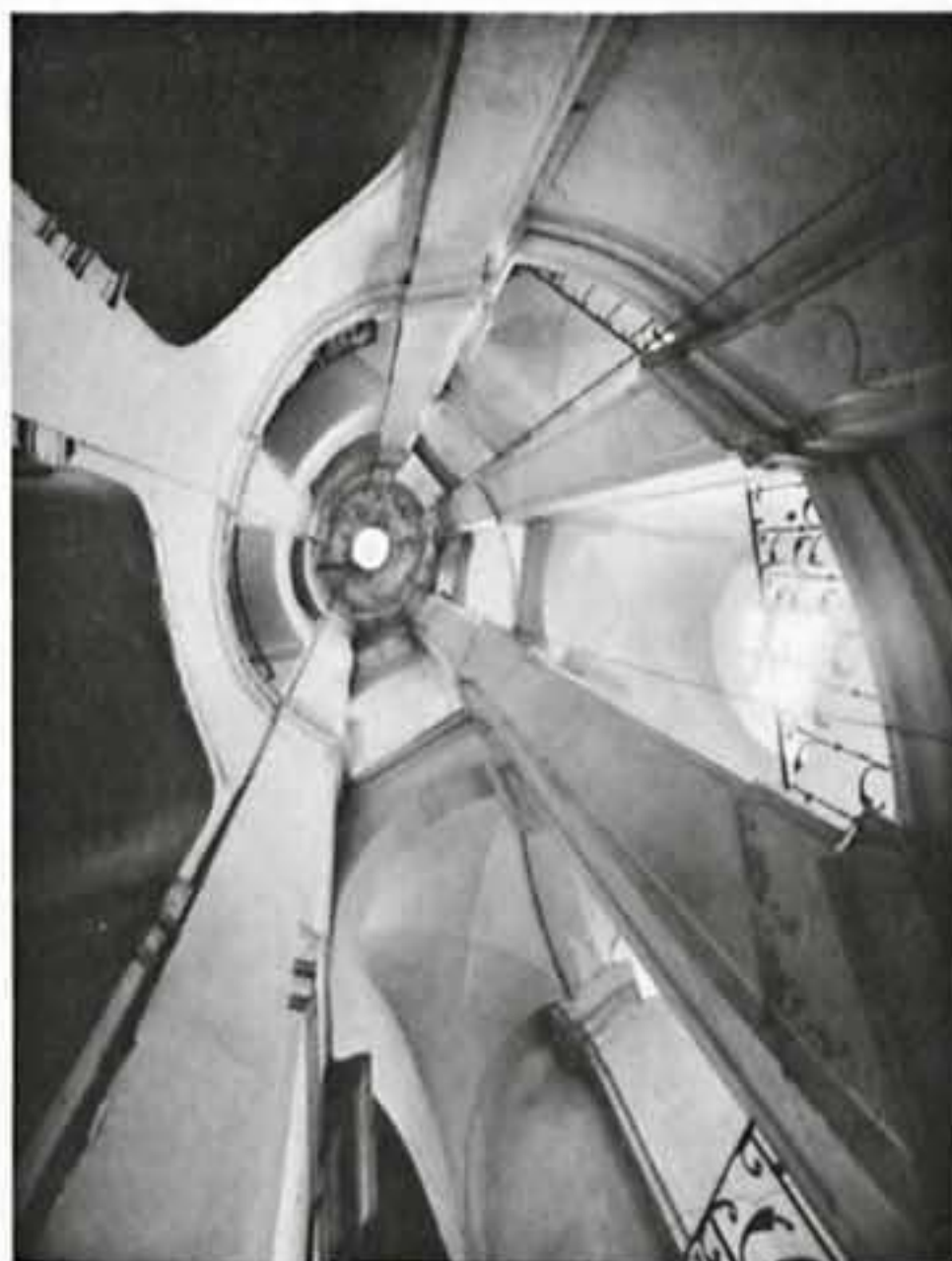
Escalera del convento de las Ursulinas de Kutná Hora. Kilián Ignác Dientzenhofer, 1735-1749