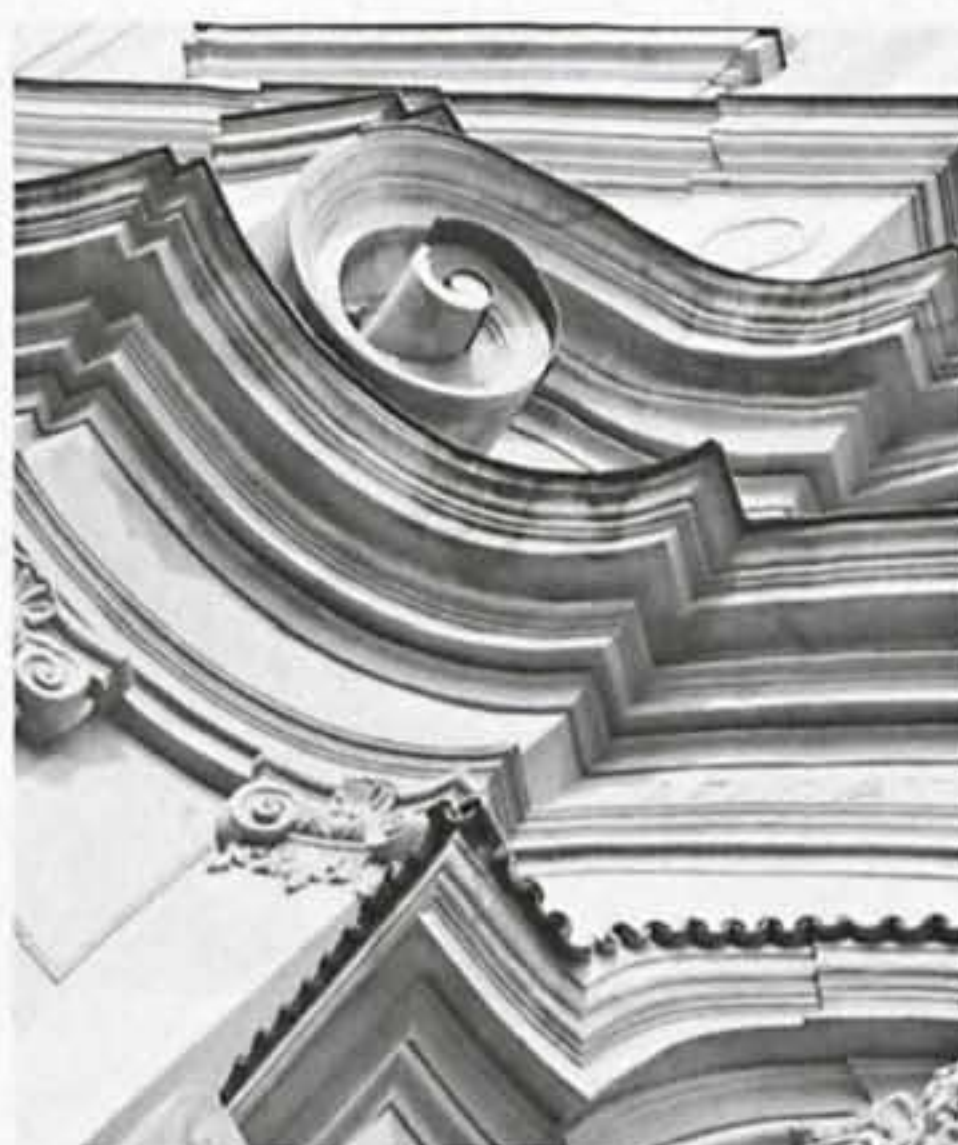
Cornisas y bóvedas de la capilla de Santa Ana de Panenské Brezany de Santini-Aichel, 1705-1707.

A nadie se le escapa que el barroco es arte en el que los volúmenes arquitectónicos y escultóricos cobran vida y amenazan con escapar a cualquier marco impuesto, de la misma forma que la pintura y en especial la que ornamente las bóvedas y muros juega con efectos de trampantojo ilusionista.