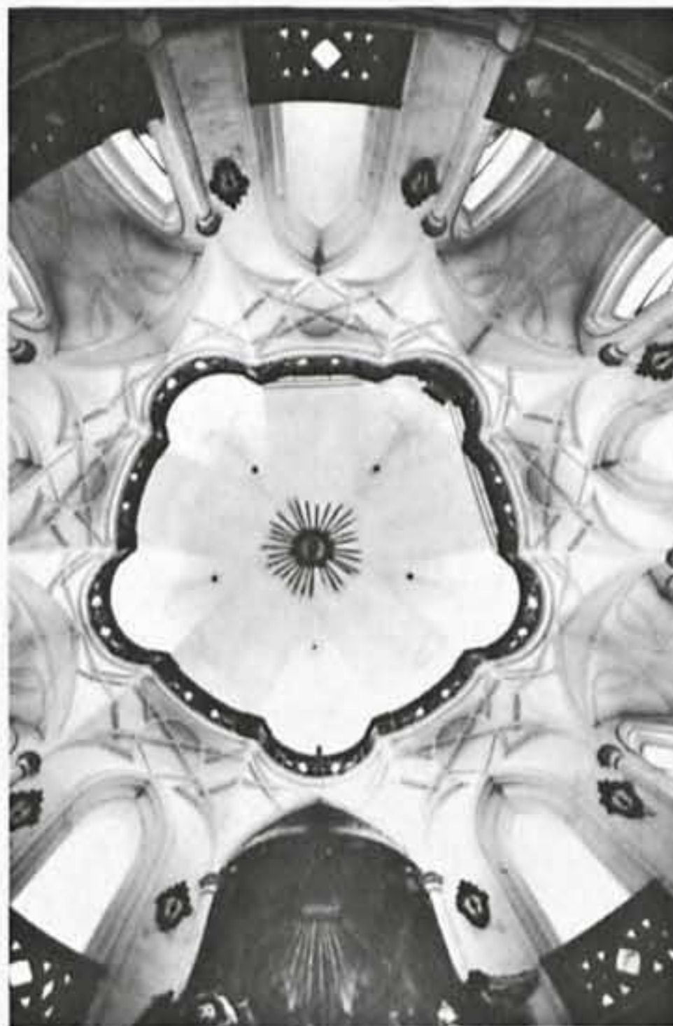
Cúpula de la iglesia de peregrinación de San Juan Nepomuceno en Zelená Hora, junto a Zdar nad Sázavou. Obra de Santini-Aichel, 1719-1722.