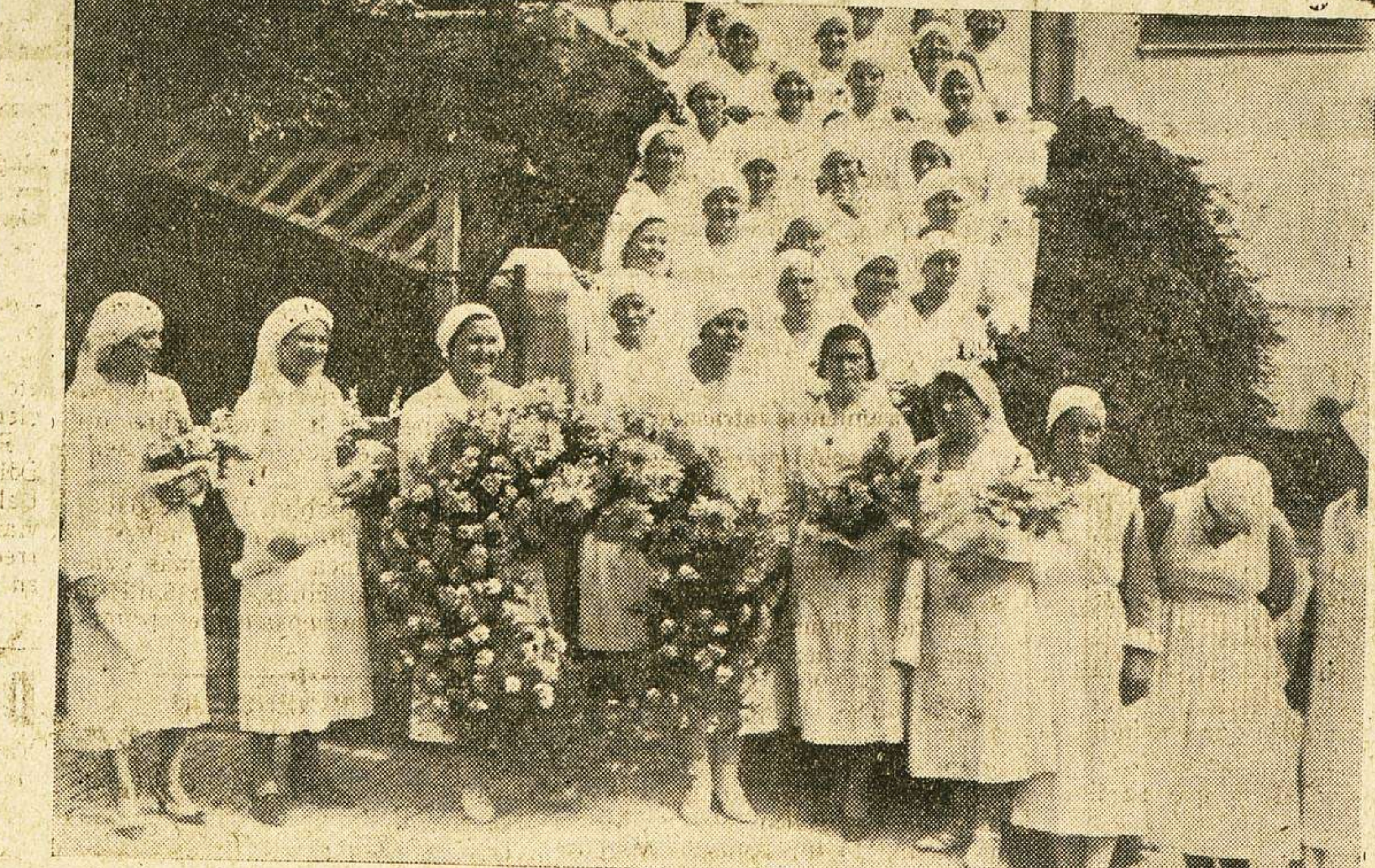
Señoritas enfermeras del establecimiento, que depositaron una corona a la memoria de su fundador, con motivo de la inauguración del curso.

Hoy, iniciado el periodo electoral y llegado el momento inexcusable de la lucha, volvemos a la carga, quizá con el mismo candor, con la misma ingenuidad de siempre, equivocando seguramente el camino, que según la vieja costumbre electoral y política es el inverso; es decir, utilizar por delante la intriga privada y el conyerto previo entre las sombras, despreciando la sinceridad y la publicabilidad con que, sin preparaciones,