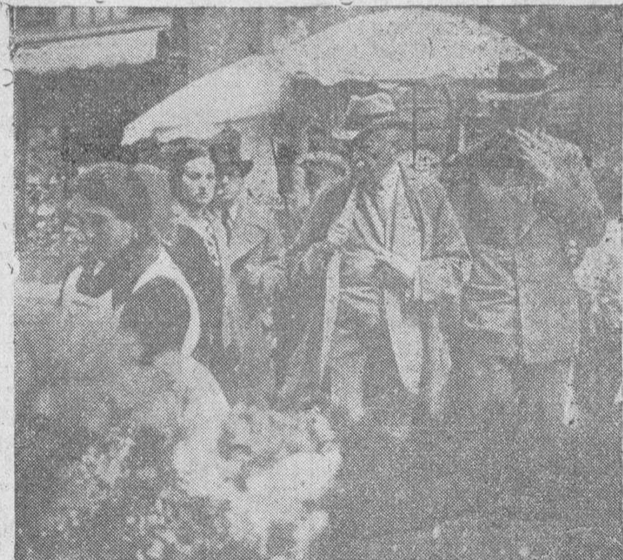
Se encuentra en Barcelona el príncipe Augusto, hermano del rey de Suecia. Hélo aquí paseando por la Rambla de las Flores