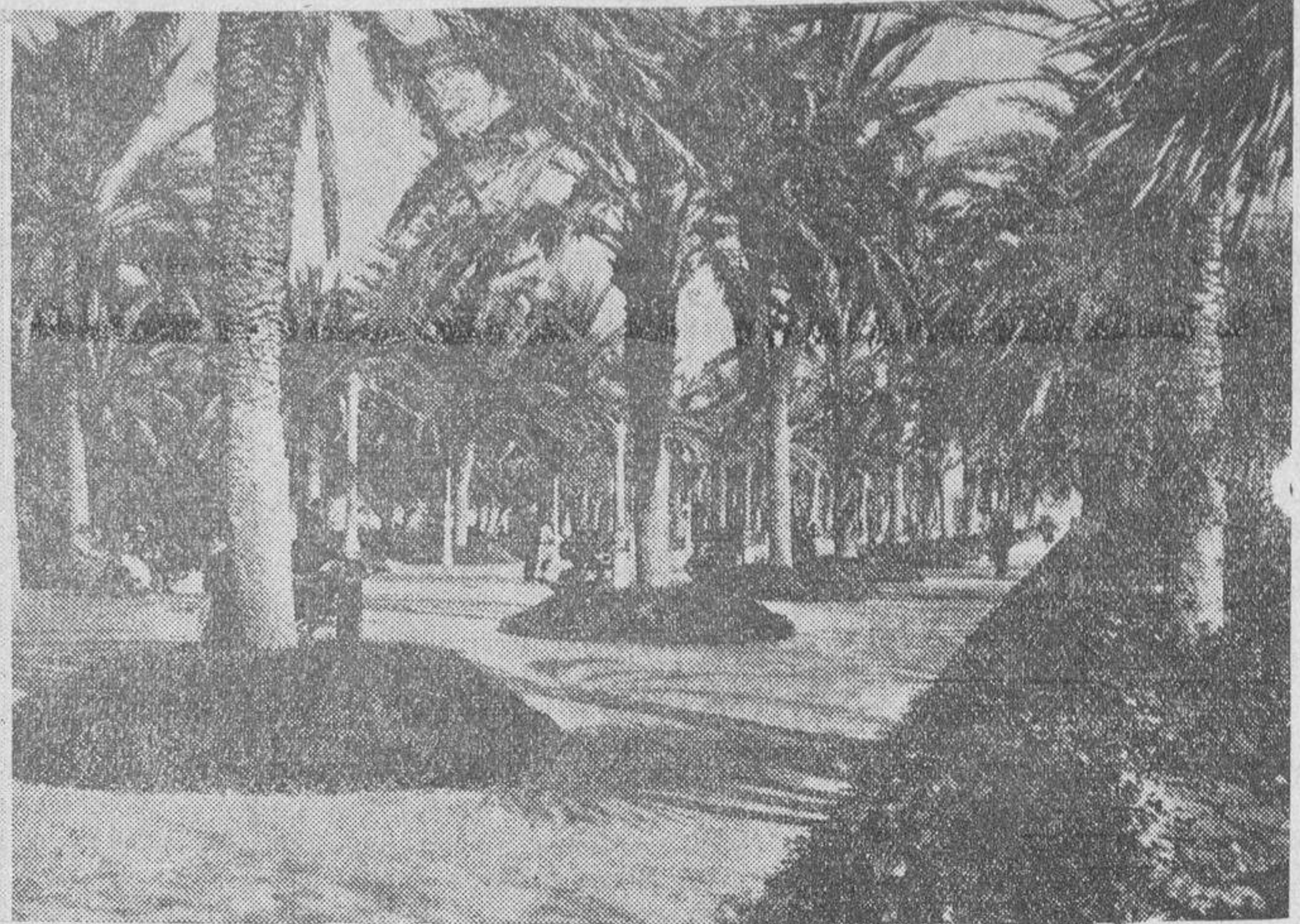
CADIZ.—El Parque Genovés

Una etapa más de la excursión: Sevilla-Jerez de la Frontera-Puerto de Santa María-Cádiz. Hemos dejado Sevilla, en esta mañanita de abril, tercer día de su feria, en contraste extraordinario con el anterior, puesto que el sol ha lucido nuevamente y los sevillanos se disponen a recibir al excelentísimo señor, Presidente de la República, señor Martínez Barrio y al de la Generalidad, señor Companys.