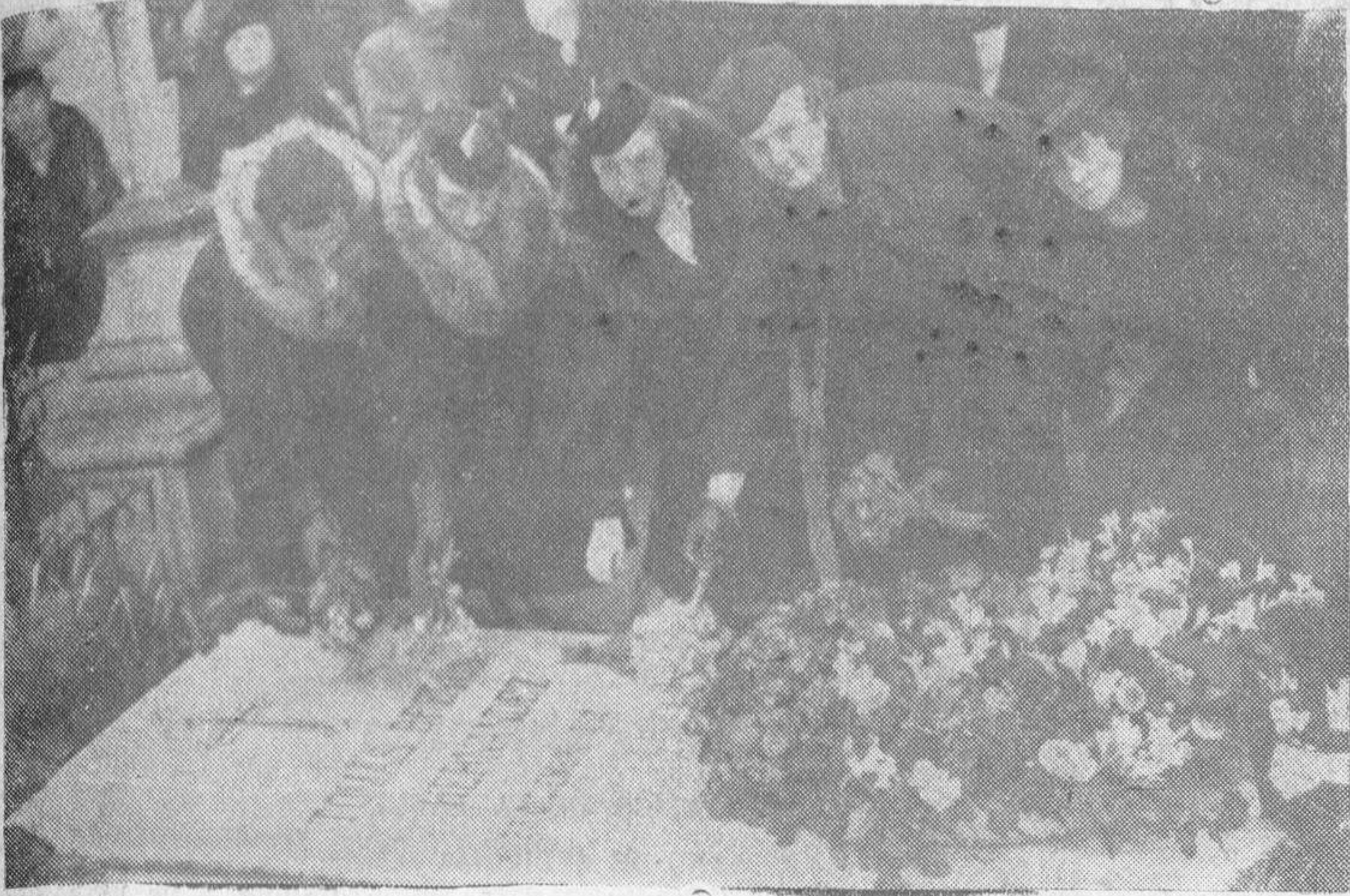
La hija y nietas del insigne músico salmantino don Tomás Bretón, depositando flores sobre la tumba de éste