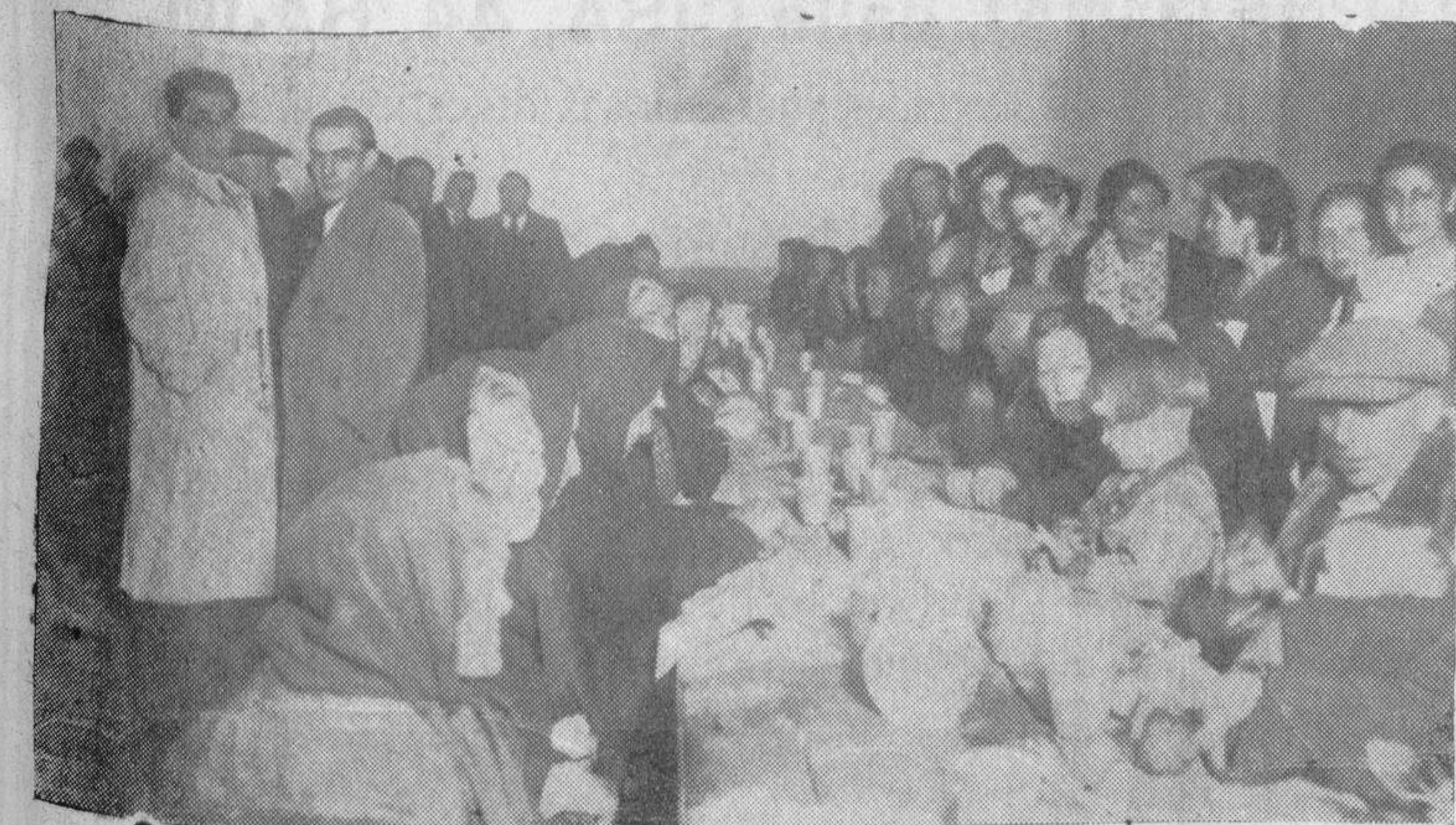
Un aspecto de los comedores de Asistencia Social durante la comida extraordinaria de ayer

Como ya habíamos anunciado, ayer la Cámara de la Propiedad Urbana obsequió con una comida extraordinaria a los indigentes que acuden a los comedores de Asistencia Social.