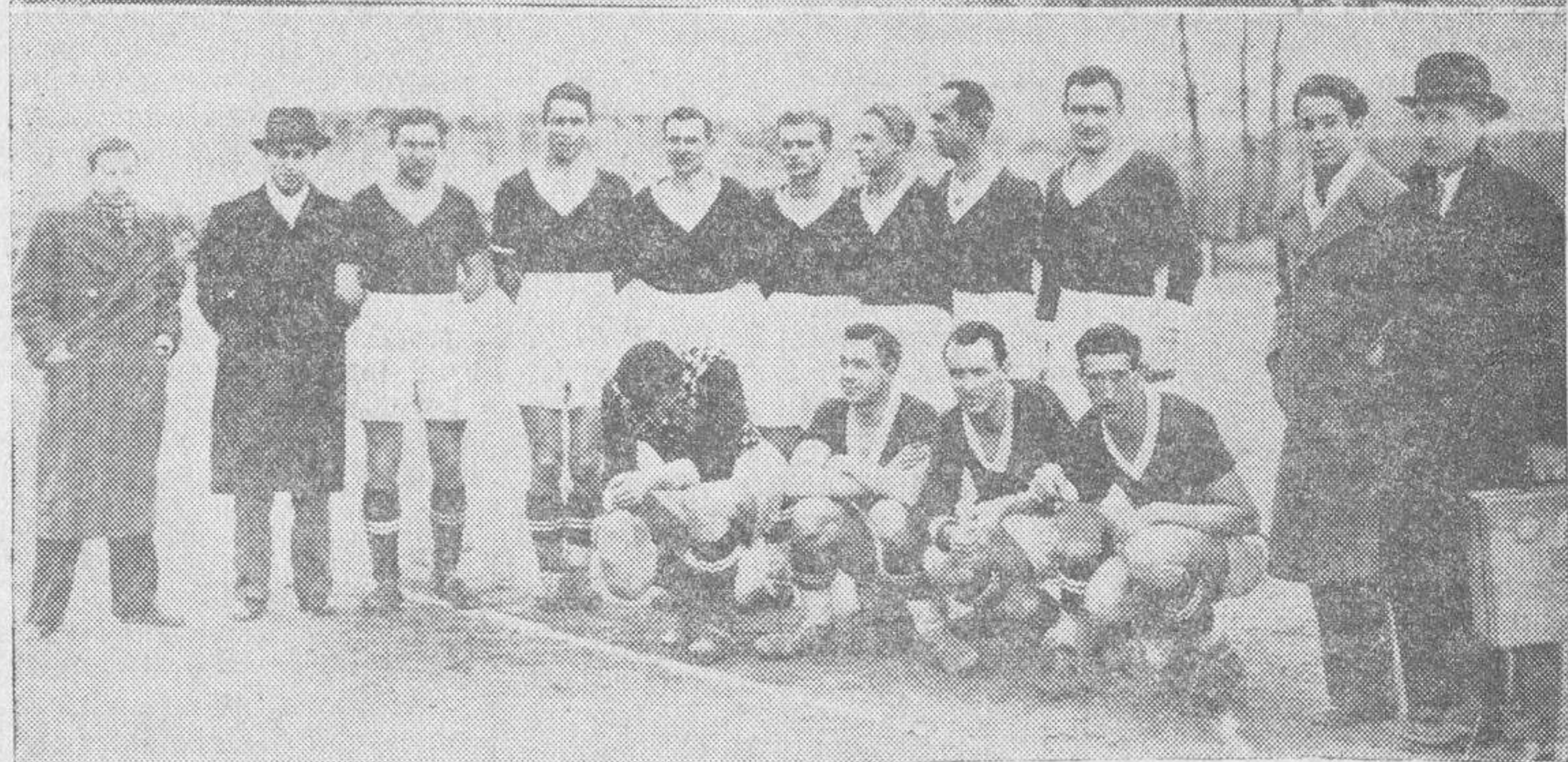
Los equipos de la U. D. Salamanca y el Szegeed húngaro, que ayer jugaron un interesante partido en el Campo del Calvario

defiende, sin bloquear, recogiendo por fin el balón, despejando. El primer tiempo, termina señalando el marcador 2-1 a favor de los salmantinos.