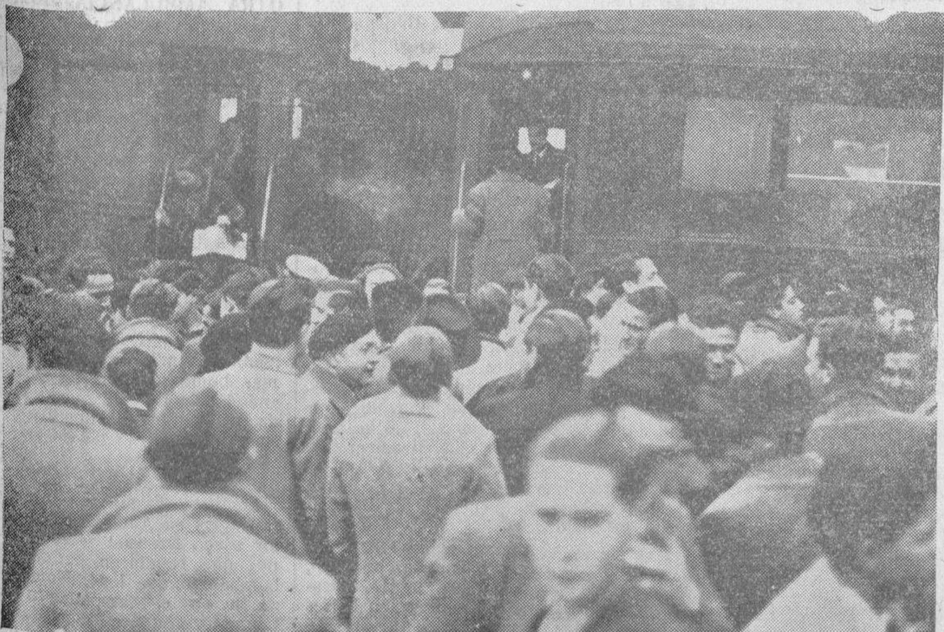
Aspecto de los andenes de la estación del ferrocarril a la llegada de los futbolistas salmantinos

VENTA: Droguerías y Asociación de Ganaderos