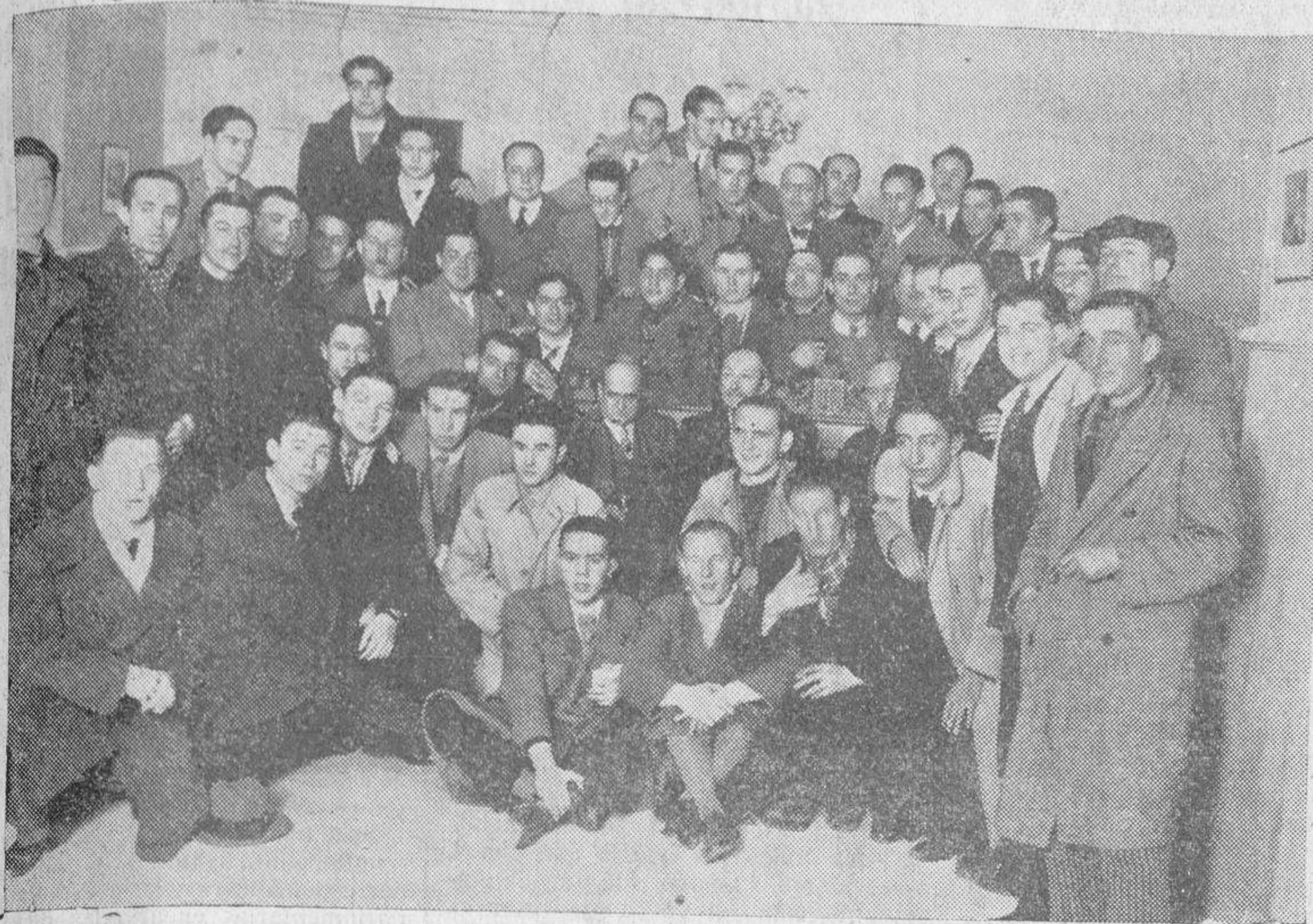
Los jugadores de los equipos Szegeed y U. D. Salamanca, con el Alcalde, el Presidente de la Diputación y varios directivos, después de la recepción celebrada en el Ayuntamiento