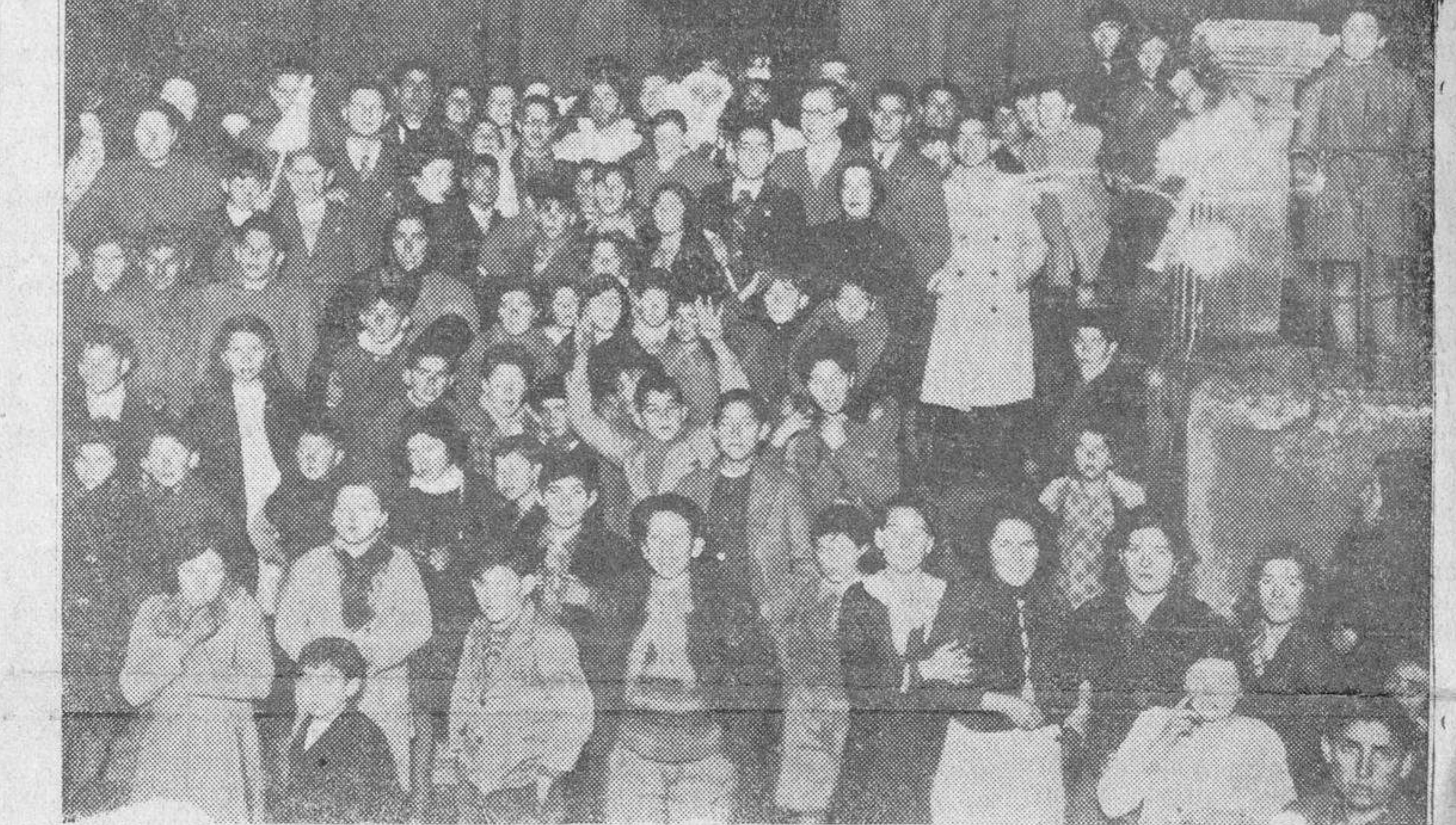
Los Reyes Magos de la Congregación de San Luis, durante su visita a los Catecismos de los Pizarrales y Tejares, donde repartieron numerosos juguetes