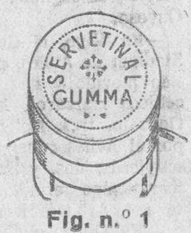
Fig. n.º 1

De venta: 5,80 ptas. (timbre incluido) en todas las farmacias de SALAMANCA. — Gayoso, Arenal, 2 — Farmacia del Globo, Plaza Antón Martín — Félix Borrell, Puerta del Sol, 5, MADRID