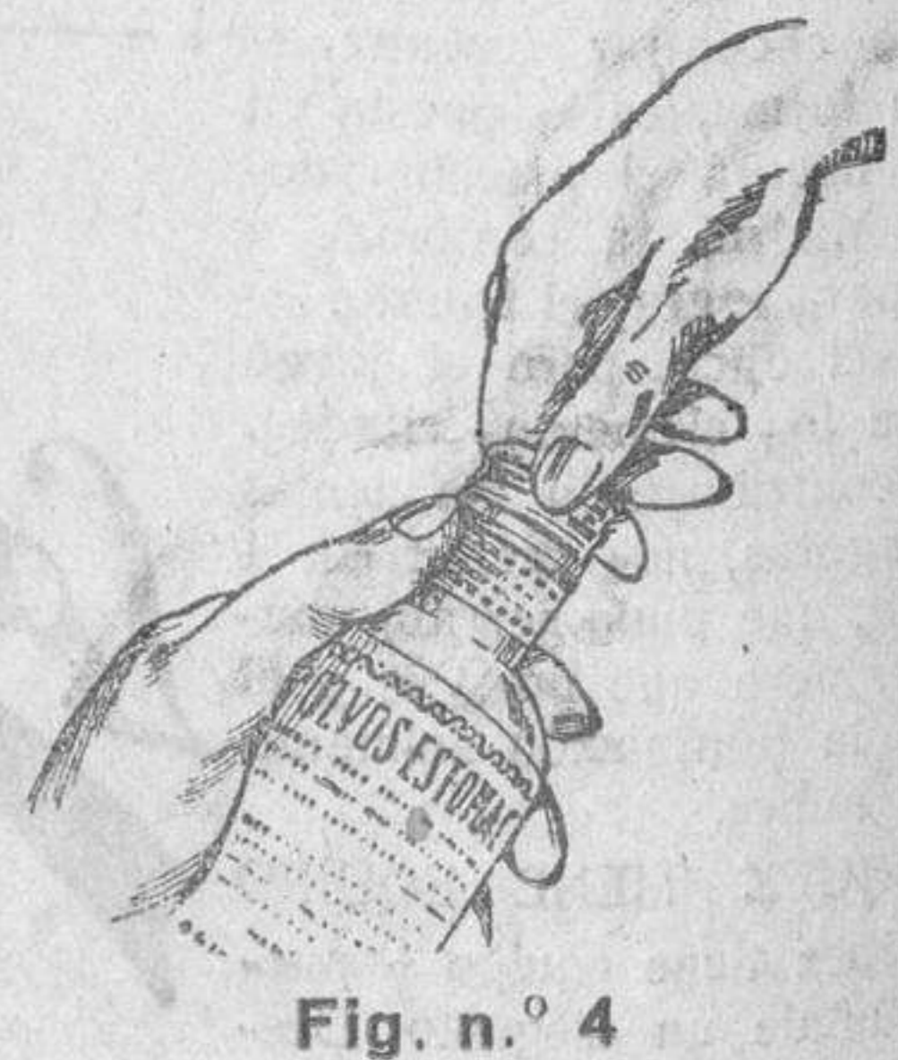
Fig. n.º 4