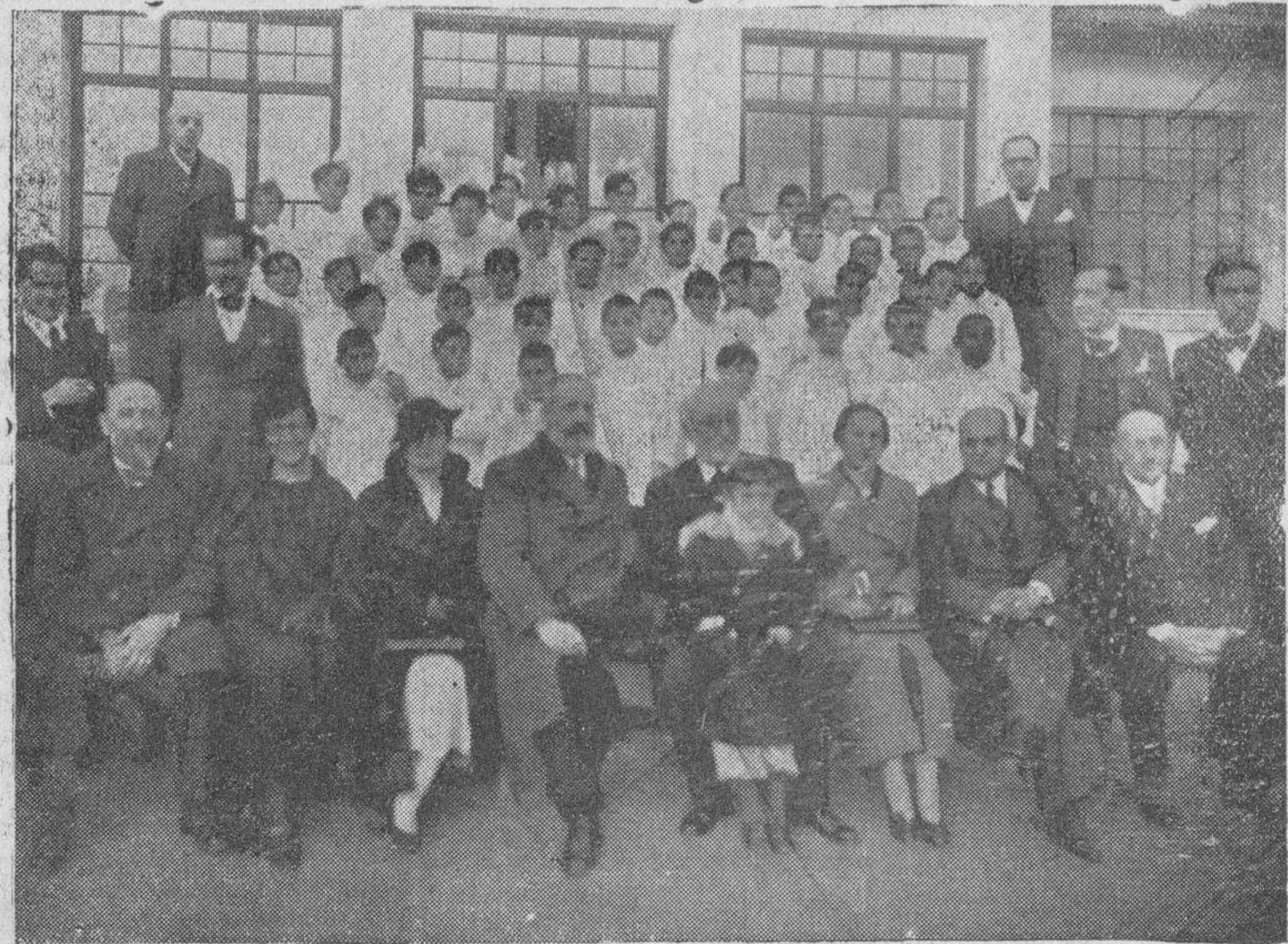
Grupo de asistentes al concierto dado por el «Cuarteto España» en honor de los niños del Preventorio-Escuela de la Caja de Ahorros