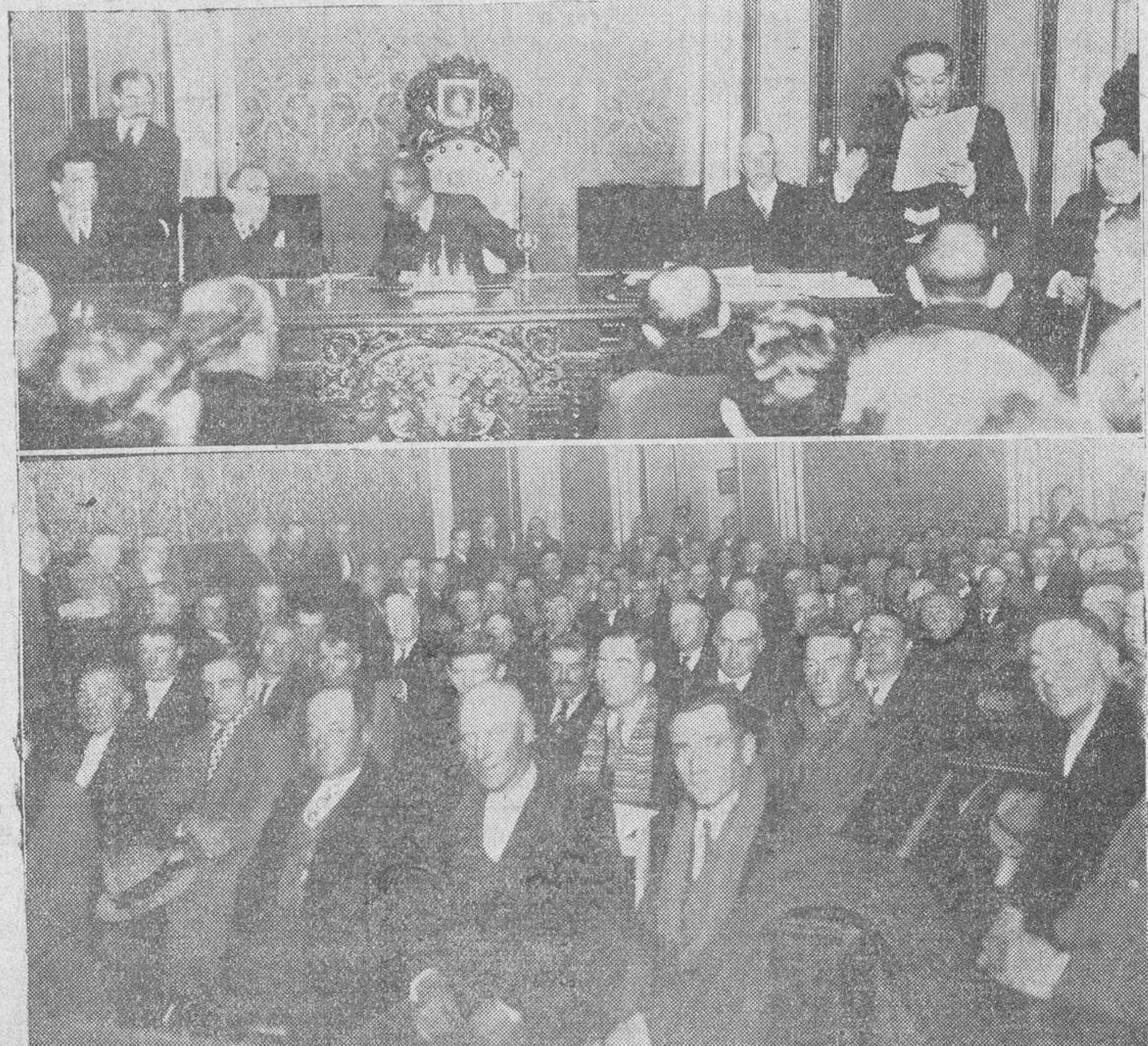
Arriba: La presidencia de la asamblea de representantes de Ayuntamientos, celebrada ayer. Abajo: Un aspecto del salón de sesiones del Ayuntamiento

debe dejar pasar lo referente al abono de sueldos hasta el 31 de Octubre de 1935 a los practicantes y matronas, y por último examina un decreto del 30 de Noviembre, relativo a las facultades de la Junta administrativa de la Mancomunidad para regular los quinientos de los funcionarios sanitarios.