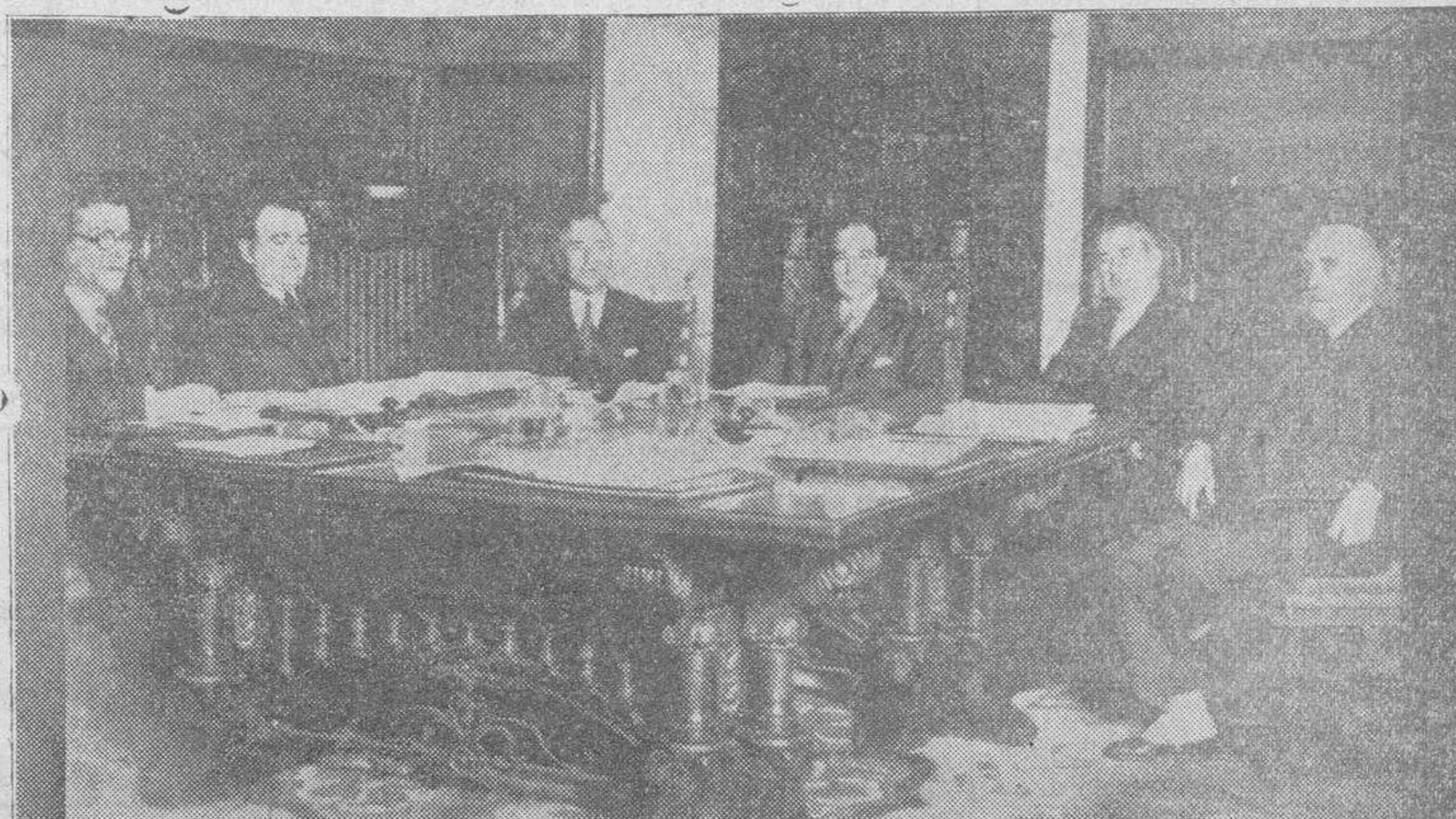
Los miembros del nuevo Consejo de la Generalidad de Cataluña, reunidos por vez primera, bajo la presidencia del gobernador general, señor Villalonga