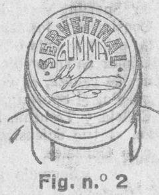
Fig. n.º 2