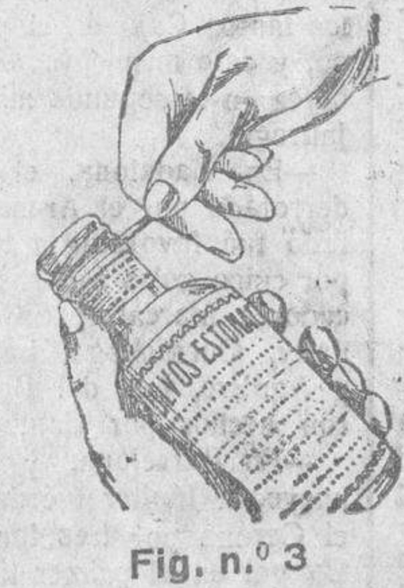
Fig. n.º 3