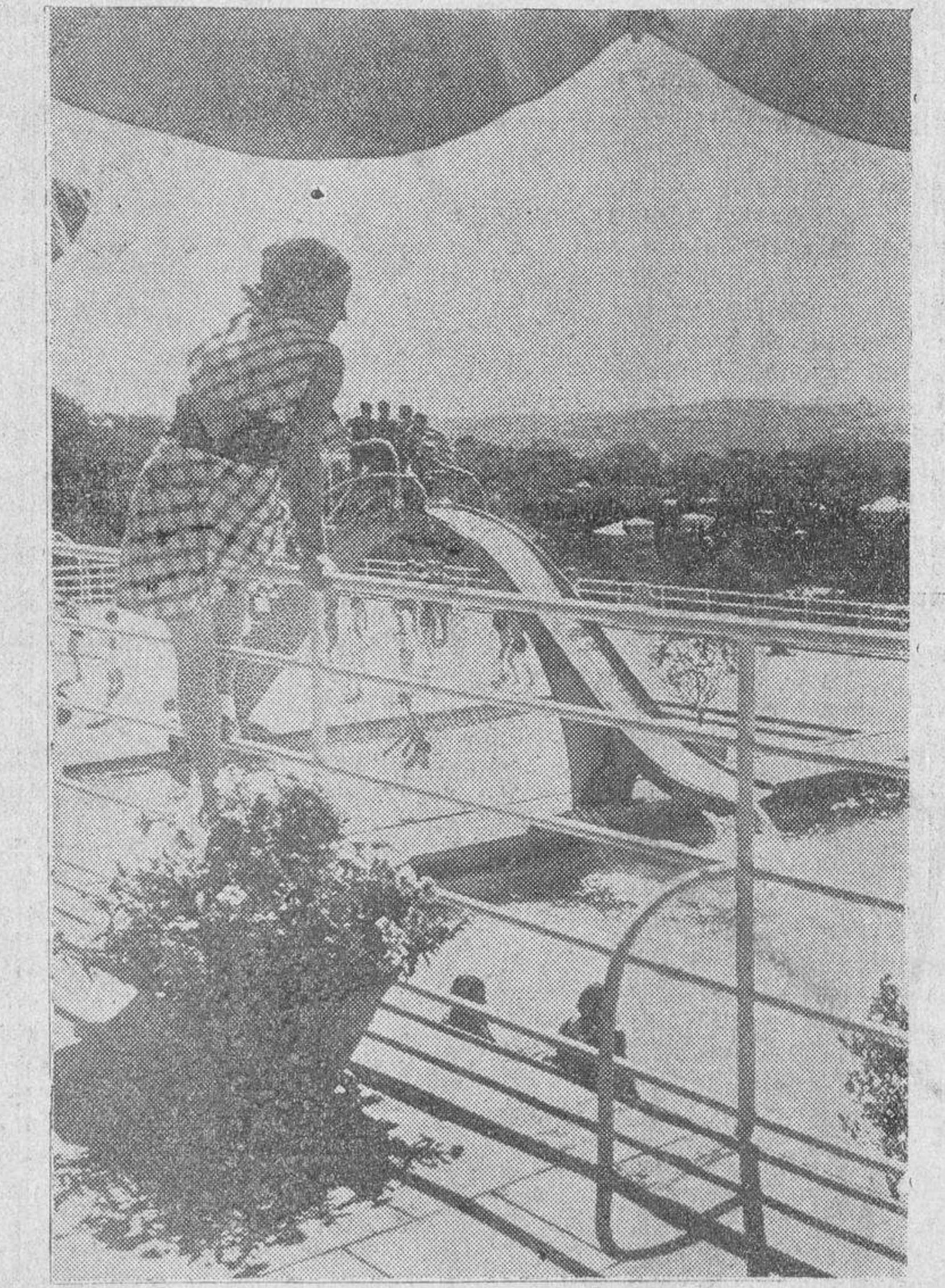
Las modernas piscinas de Wiesbaden constituyen una de las más elegantes instalaciones en su género hasta ahora construidas en Europa

Otras, en cambio, son conocidas desde hace más de 1.000 años. Baden-Baden, Wiesbaden, Badenweiler, Aquisgrán, muestran todavía con orgullo de las termas construidas por los romanos, donde los soldados de las legiones desentumecían sus cuerpos reumáticos. En el balneario de Bertrich, junto al