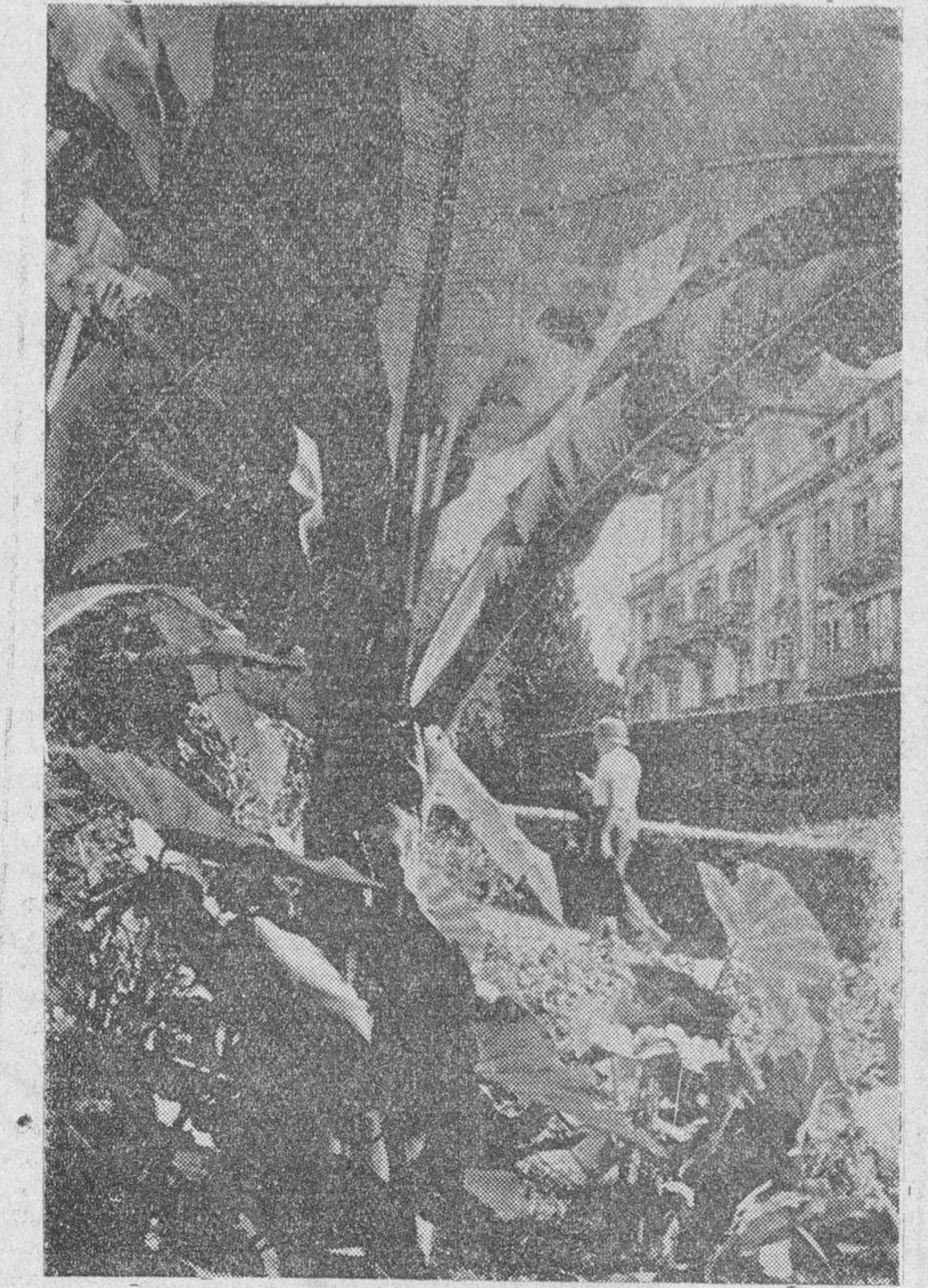
Un detalle «tropical» del Parque de Badenweiler, el famoso balneario de la Selva Negra

La lista es profusa y completa y, una vez en posesión de una de las Guías especiales sobre los balnearios alemanes que es fácil procurarse en cualquier agencia de viajes, la selección del lugar adecuado no habrá de ser difícil, sobre todo si se recurre al consejo de un facultativo experimentado. En todo caso hay que tener presente que uno de los factores primordiales para el buen éxito de las curas balneológicas es el tiempo. Pa-