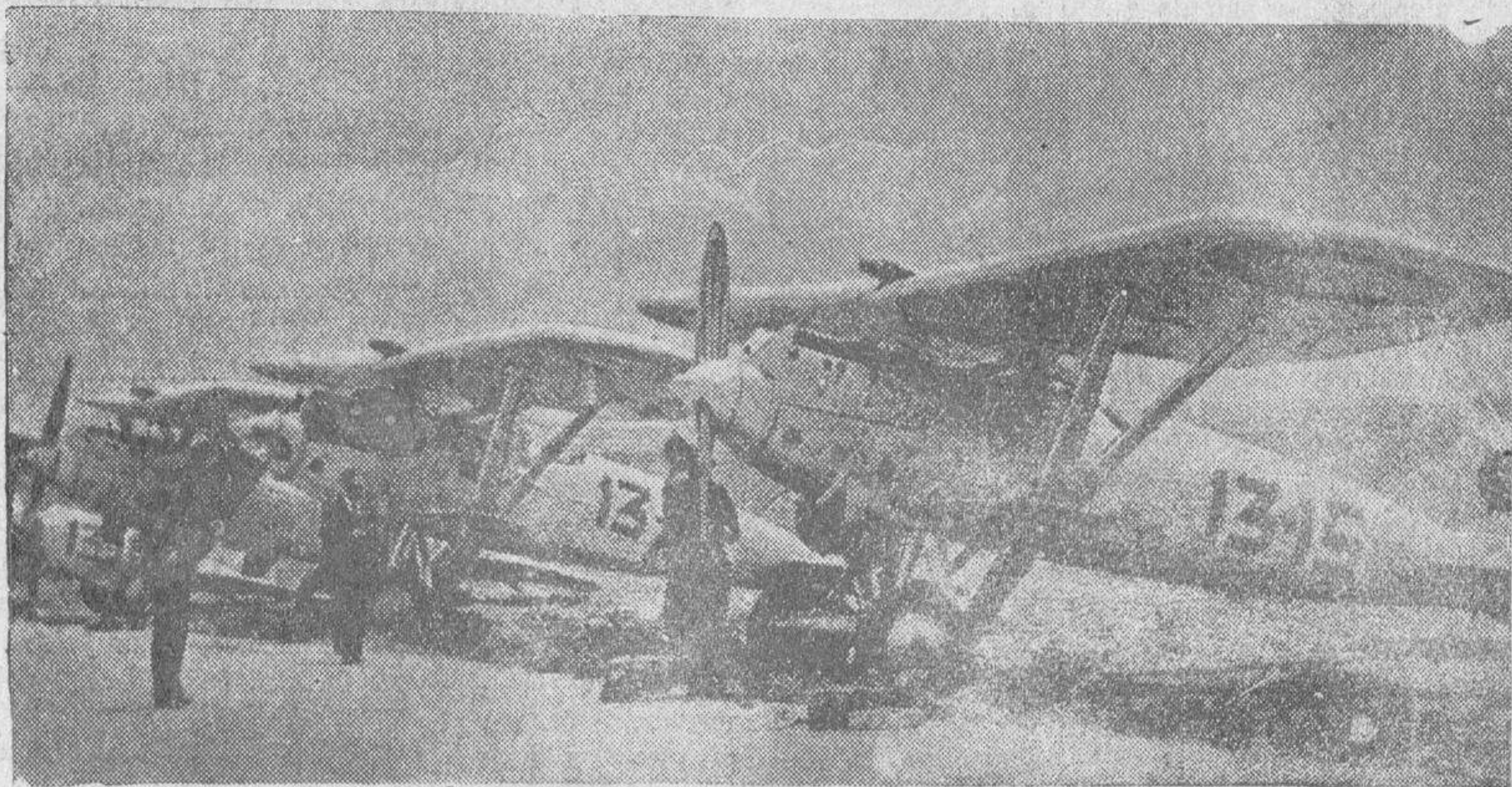
Hay, jueves, comienza la vuelta a España de los aviones militares, partiendo de la base aérea de Getafe, donde se han concentrado, durante estos últimos días, aviones de todas las bases de la Península y territorios de Africa. He aquí la escuadrilla de aviones de caza que tomará parte en la prueba