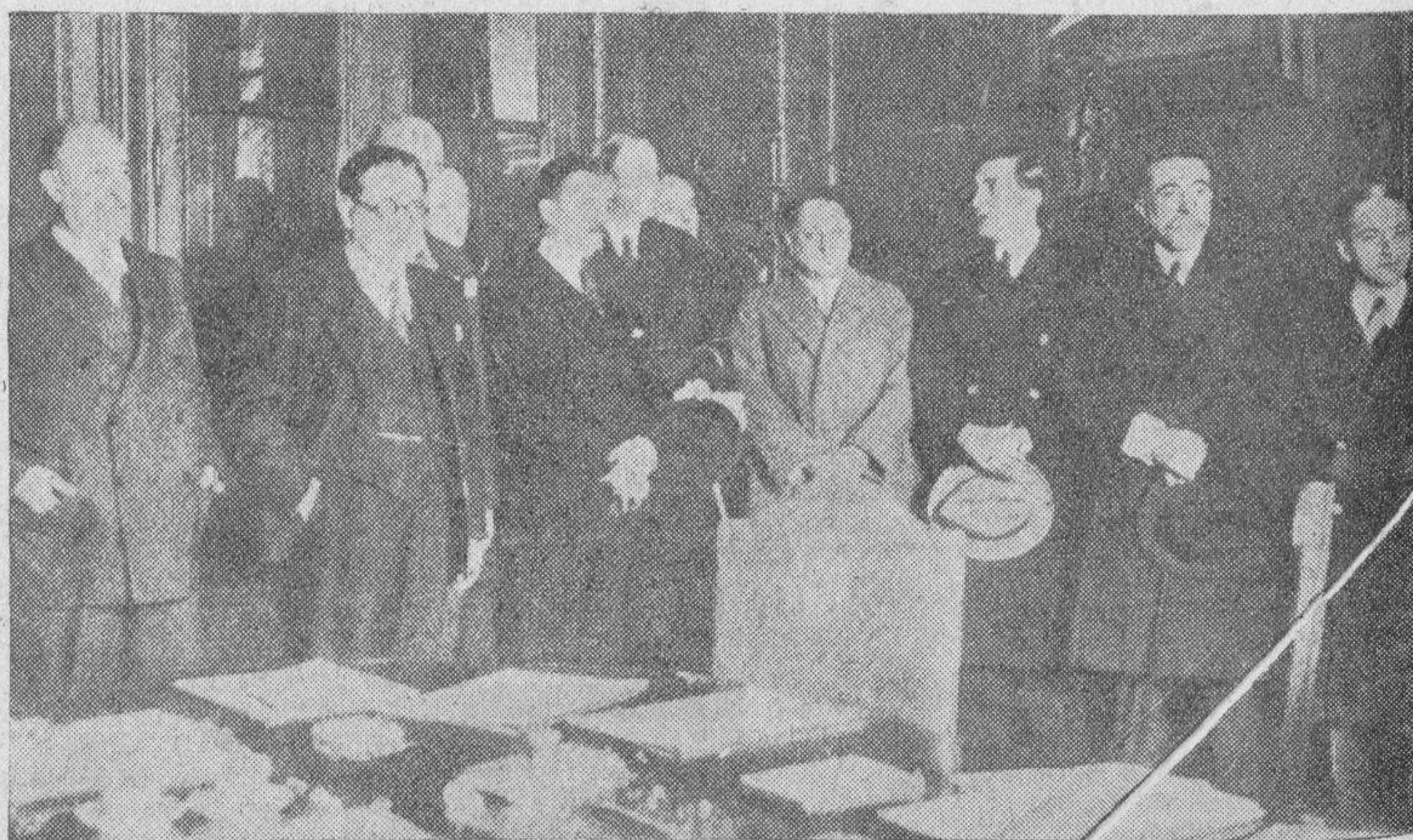
La firma del armisticio entre Bolivia y Paraguay ha puesto fin a la sangrienta guerra que sostenían ambos pueblos hermanos desde hace tres años. He aquí en el salón del Ministerio de Estado de Buenos Aires, donde tuvo lugar la firma, a los ministros de Estado de Paraguay, Argentina, Brasil y Bolivia, que tomaron parte en el acto