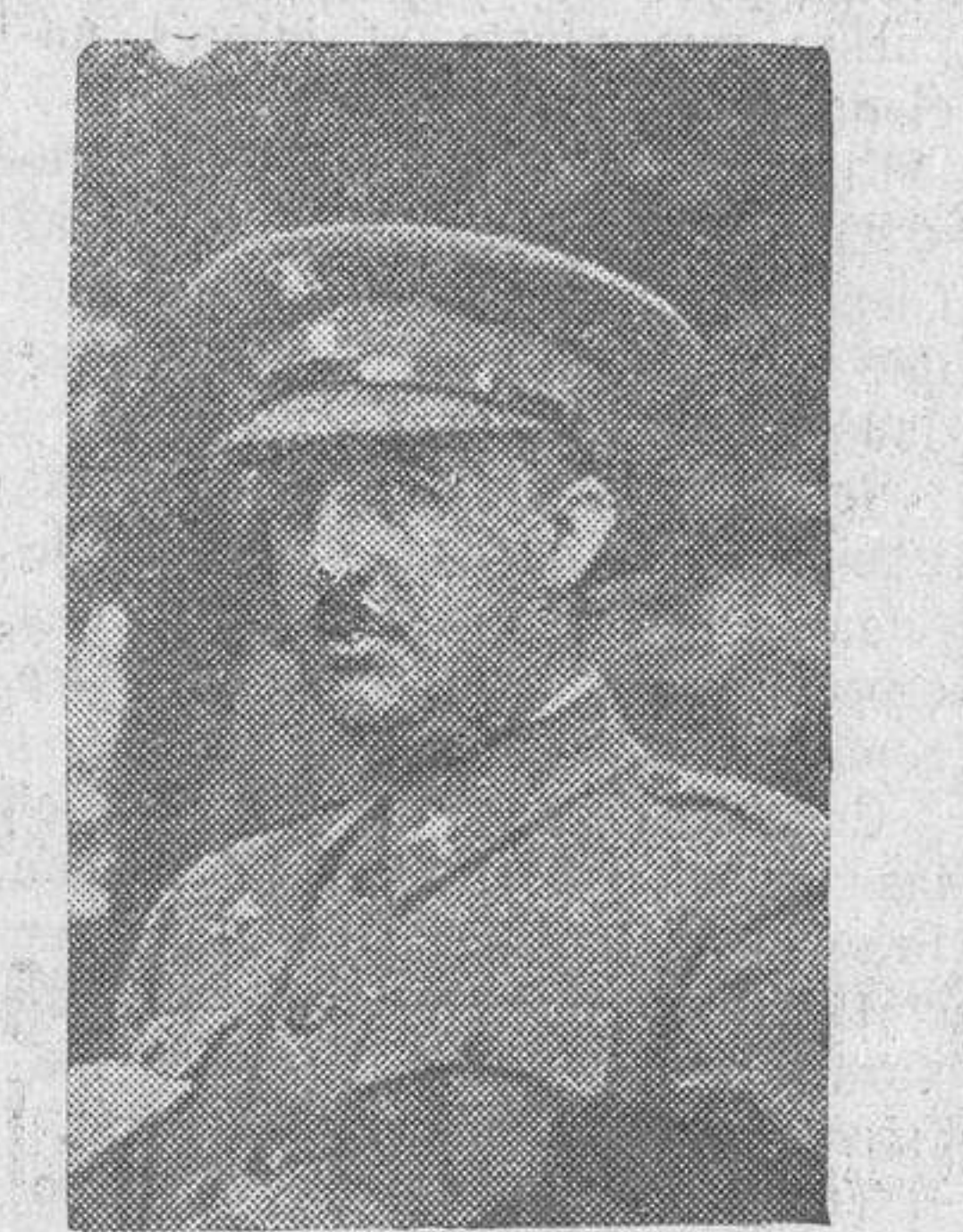
El general don Francisco Franco, nombrado jefe del Estado Mayor Central

Según referencias facilitadas por algunos miembros de la comisión,