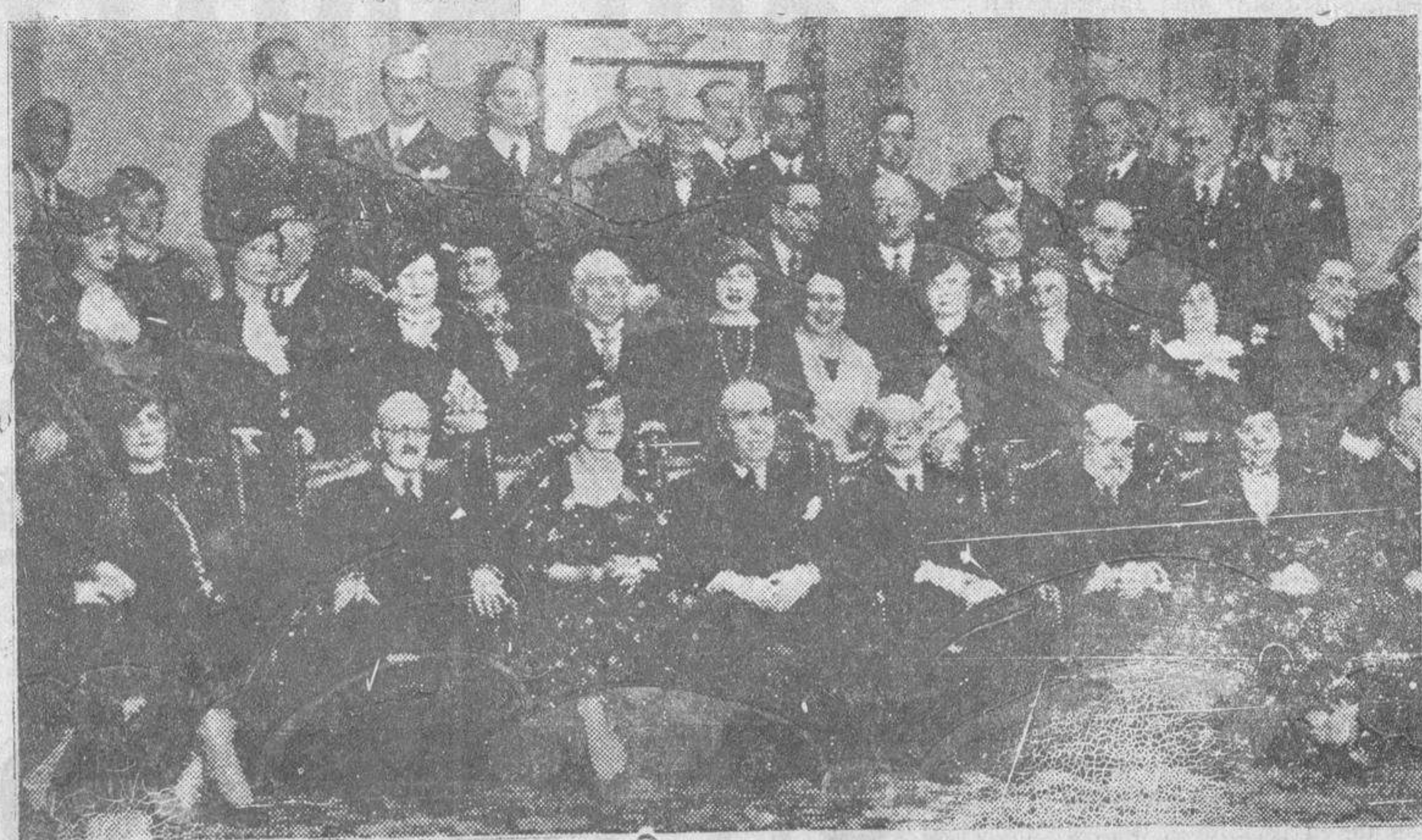
Los delegados que han asistido a la I Conferencia Oceanográfica Iberoamericana, han ofrecido un homenaje a su presidente, don Odón de Buen. He aquí algunos de los asistentes al acto, entre los que se encuentran los ministros de Estado y Marina