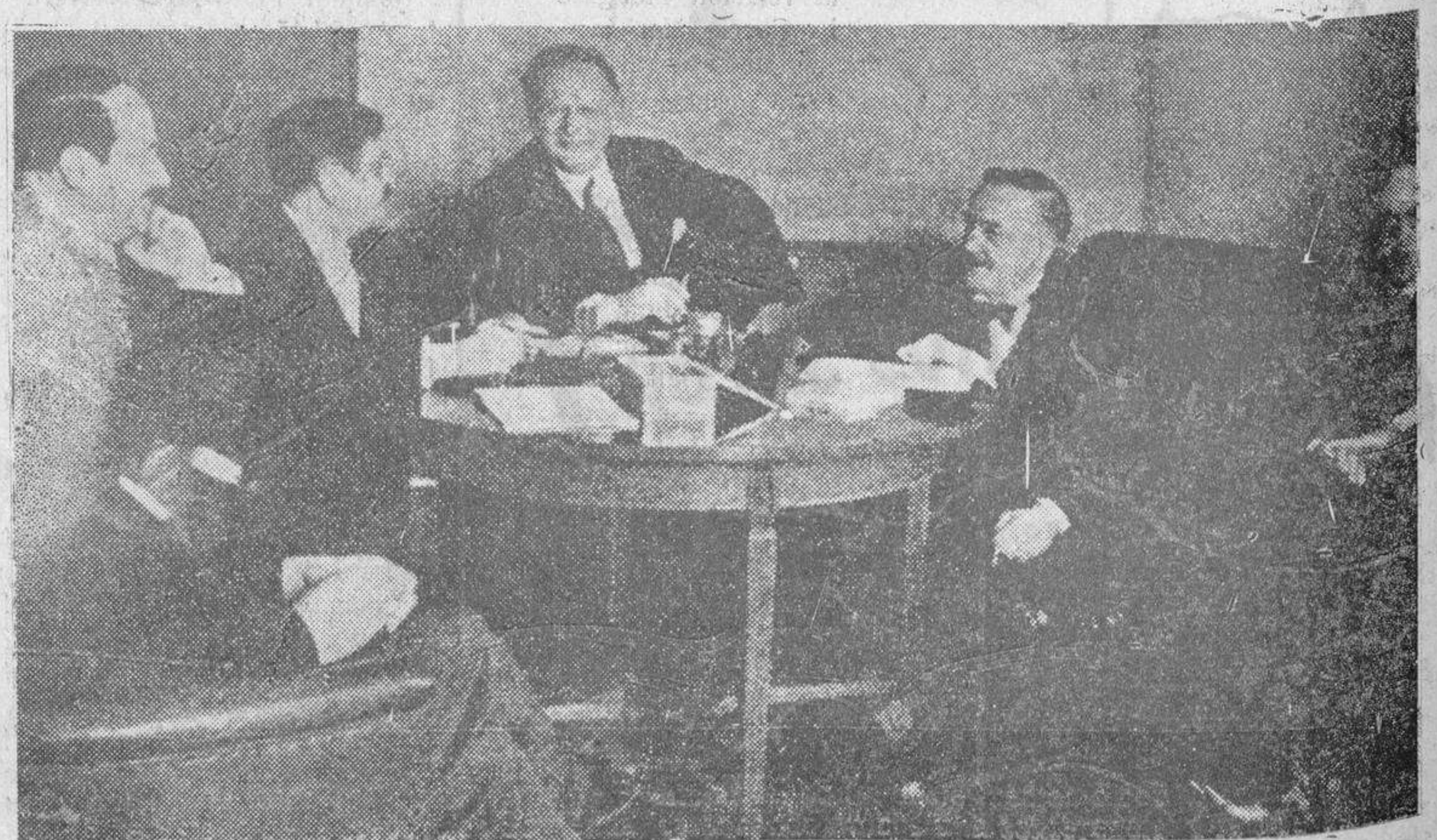
El ministro de Negocios Extranjeros de Francia, señor Laval, es recibido por Litvinoff, comisario de Estado de la República Soviética, celebrando ambos una conferencia, a la que asistieron otras personalidades destacadas