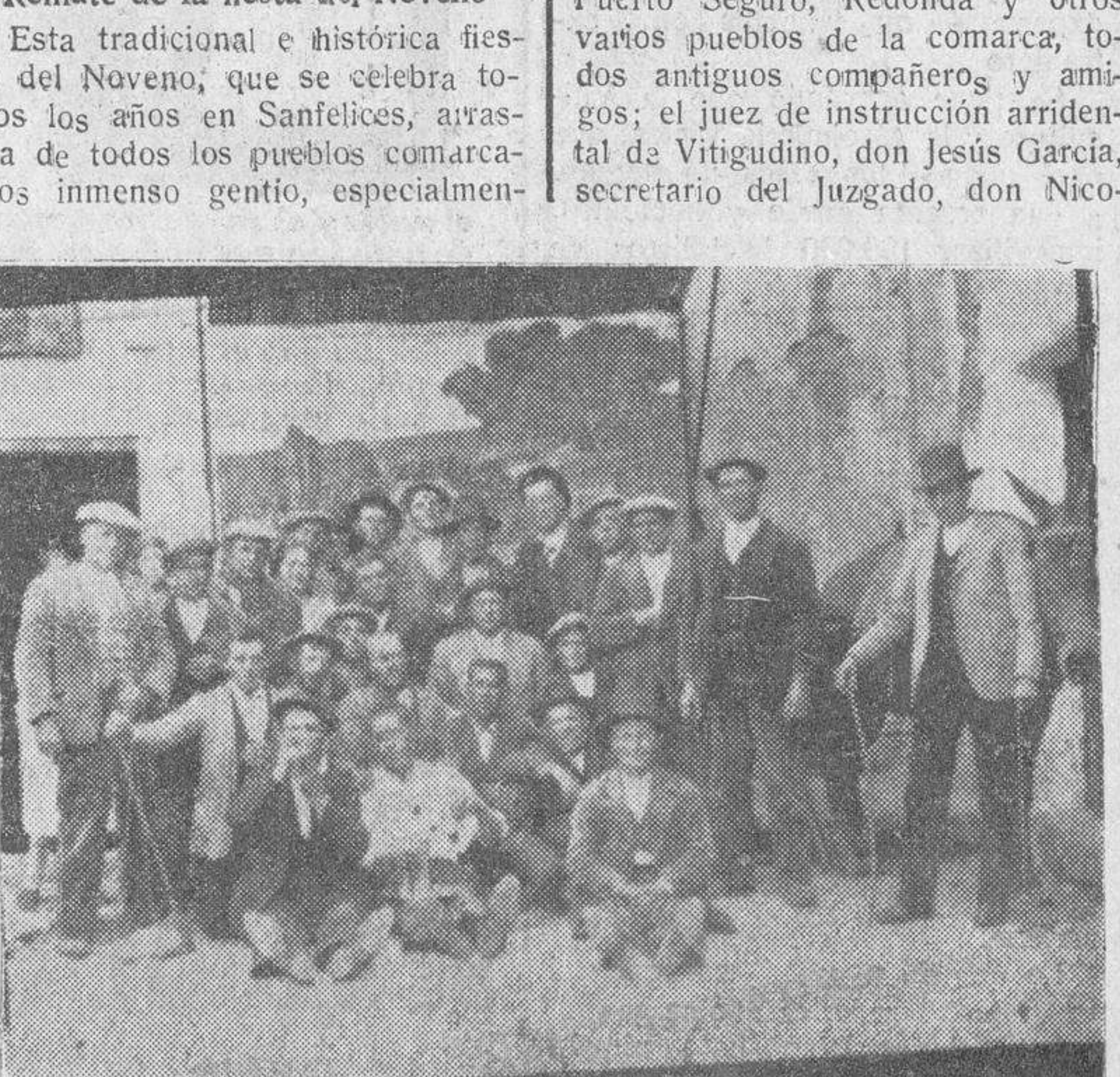
Un grupo de feriantes en Lumbrales